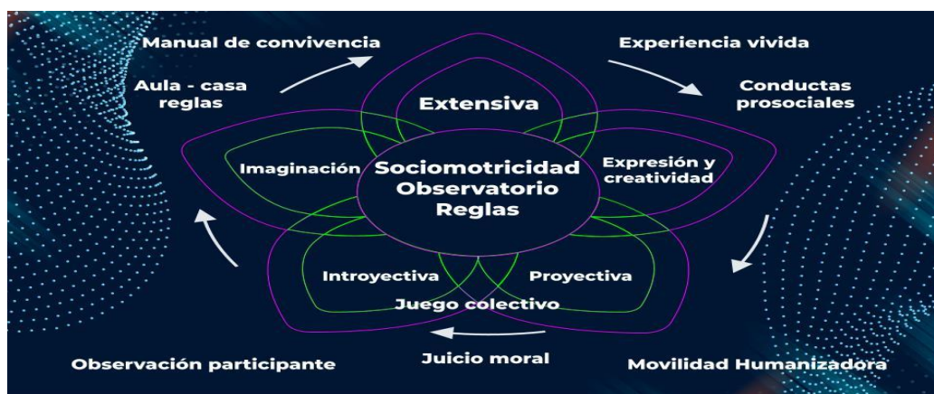
Figura 2. Desarrollo de las capacidades físicas y sociomotrices

La imaginación: tipo de pensamiento divergente curiosidad de exploración de nuevas experiencias, cuya función es asociar y combinar los elementos que ofrece la experiencia para obtener productos variados, novedosos que permitan la representación interior de la experiencia y el pensamiento convergente (síntesis de los elementos conocidos (Castañer y Camerino, p. 118). Para este trabajo de investigación es de gran importancia el poder involucrar diferentes miembros de la comunidad educativa y en este aspecto se cuenta con las niñas del grado 11° quienes planearon actividades de tipo imaginativo y elaboraron unas fichas con diversos juegos basados en la sociomotricidad, para ser implementados con los niños de preescolar.