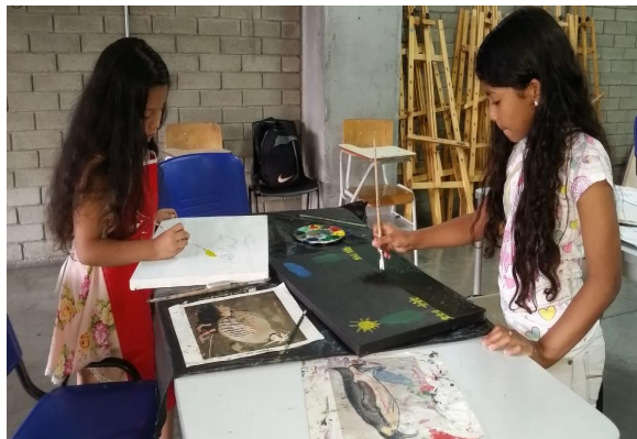
Tabla N° 3: Pinturas realizadas por los niños y las niñas del Proyecto Nexo Miranda