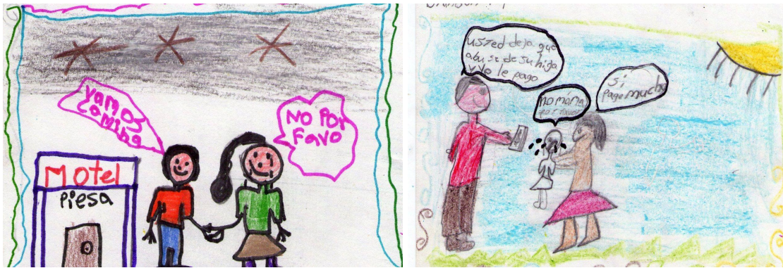
Tabla N° 2: Pinturas realizadas por los niños y las niñas del Proyecto Nexo Miranda

Si a partir del dibujo o la pintura el niño construye un proceso complejo, ya que reúne diversos elementos de su experiencia para formar un conjunto con un nuevo significado, se podría entonces concluir que cuando ellos representaron en sus ilustraciones fenómenos vividos de violencia y agresividad, esto en general consistía en sus únicos insumos. Todo lo anterior fue cambiando con las metodologías de enseñanza aprendizaje que se implementaron por el Proyecto Nexo Miranda .