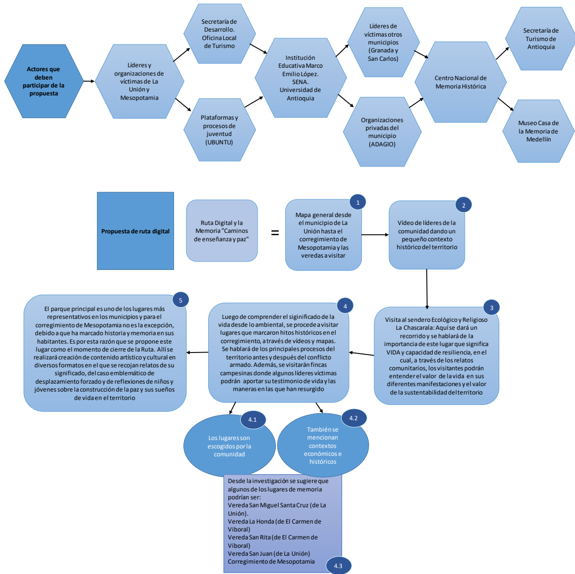
Figura 7 Ruta Digital y la Memoria “Caminos de Enseñanza y Paz”

El esquema anterior corresponde a una posible ruta digital que será dirigida por las comunidades. Para el diseño como tal de la propuesta, construcción de guiones y del contenido, se propone la gestión de alianzas con la Corporación Adagio, el SENA y la Universidad de Antioquia. También es importante articular en estos procesos a entidades gubernamentales como la Oficina Local de Turismo de La Unión y la Secretaría de Turismo de Antioquia, que pueden acompañar a las comunidades en acciones que no impliquen la revictimización y que permitan tener conceptos pedagógicos necesarios para construir