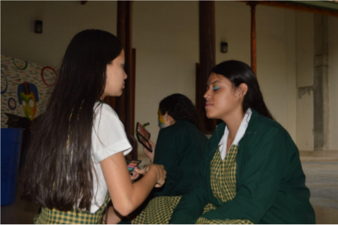
7 Taller #6 Teatreando, foto 1 y 2, grado 11° (2019). Fotos propias