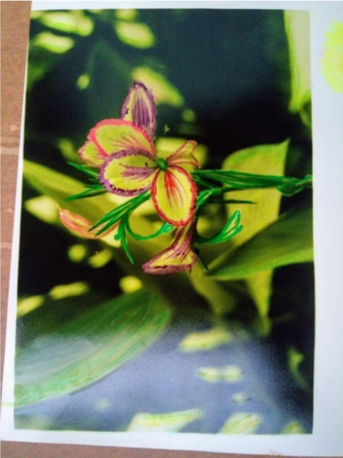
12 Actividad de intervención fotográfica, foto 2, grado 10º (2019).