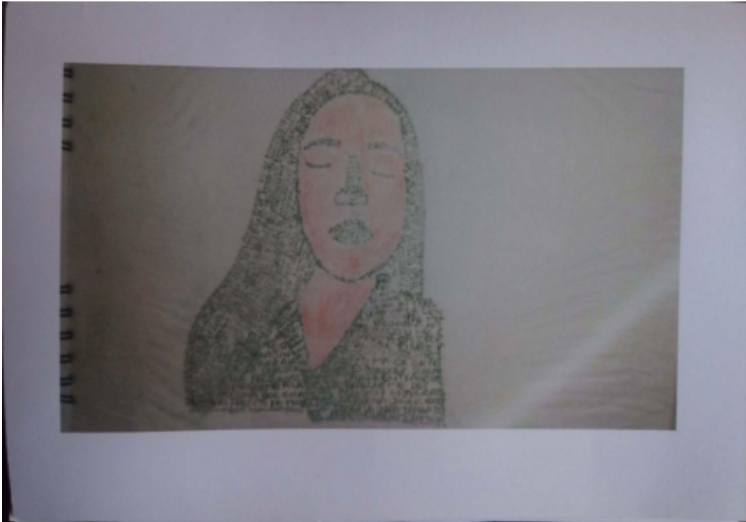
5 Taller #2 Caligramas, 5 foto 3, grado 11° (2019). Foto propia