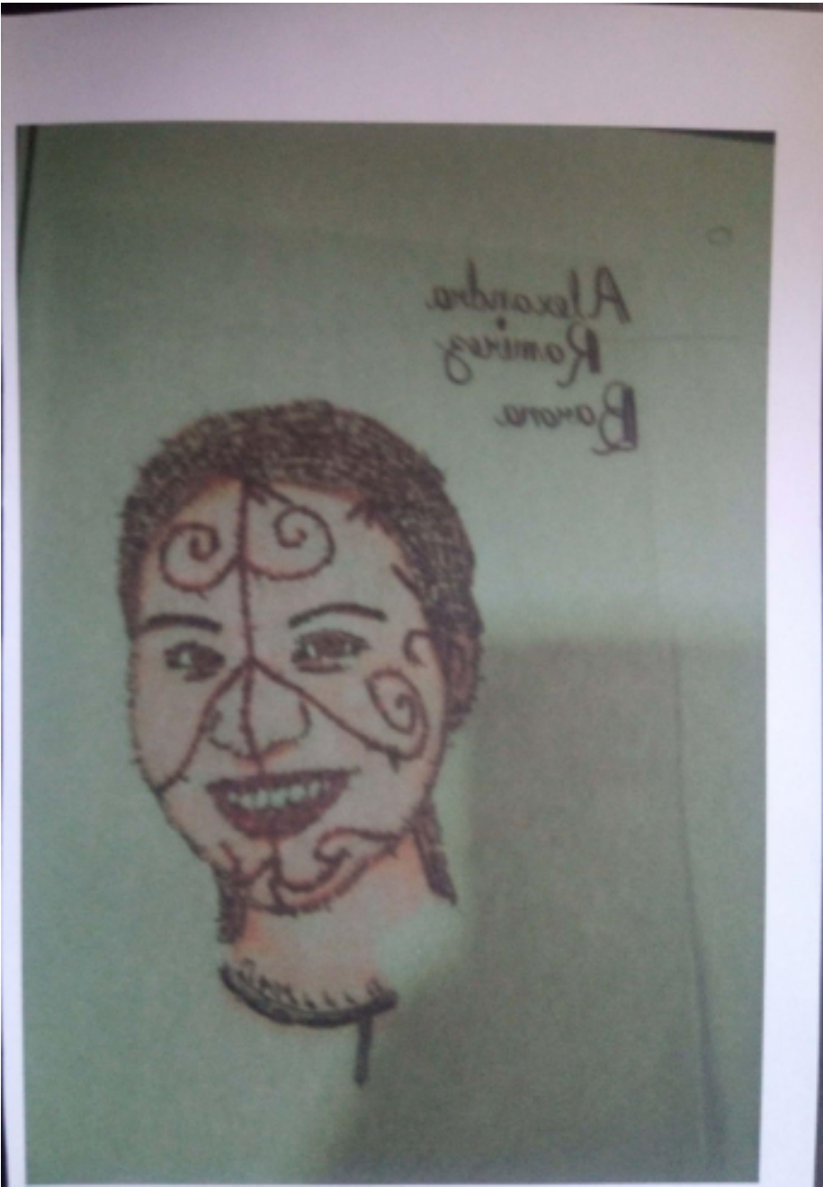
3 Taller # 2 Caligramas, foto 1, grado 11° (2019)