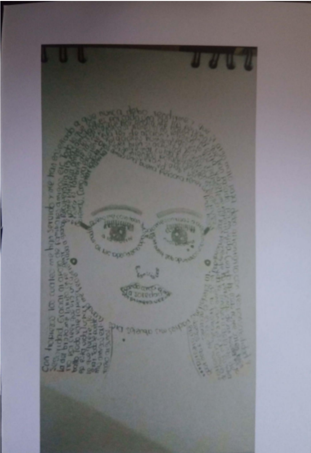
4 Taller # 2 Caligramas, foto 2, grado 11° (2019).