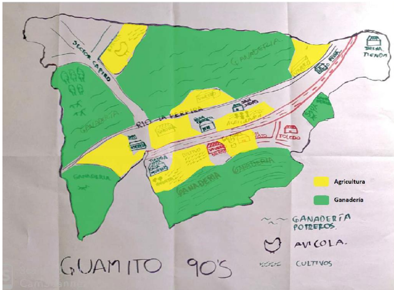
Figura 1 Cartografía social: mapa del ayer (1990)

Nota. Elaborado a partir de la cartografía social realizada el día 18 de mayo de 2022 en la vereda Guamito.