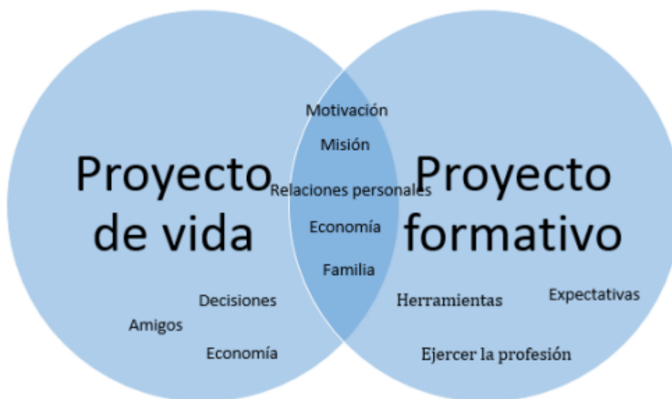
Figura 2. Relaciones entre conceptos