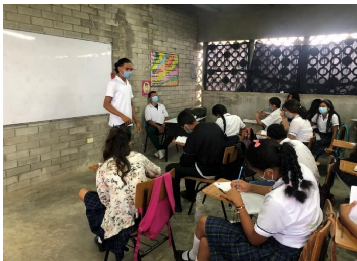
Charlas de convivencia escolar

Nota: Estudiantes del servicio social dando la charla de convivencia escolar, a lo cual los estudiantes estaban tomando apuntes de lo que se estaba exponiendo.