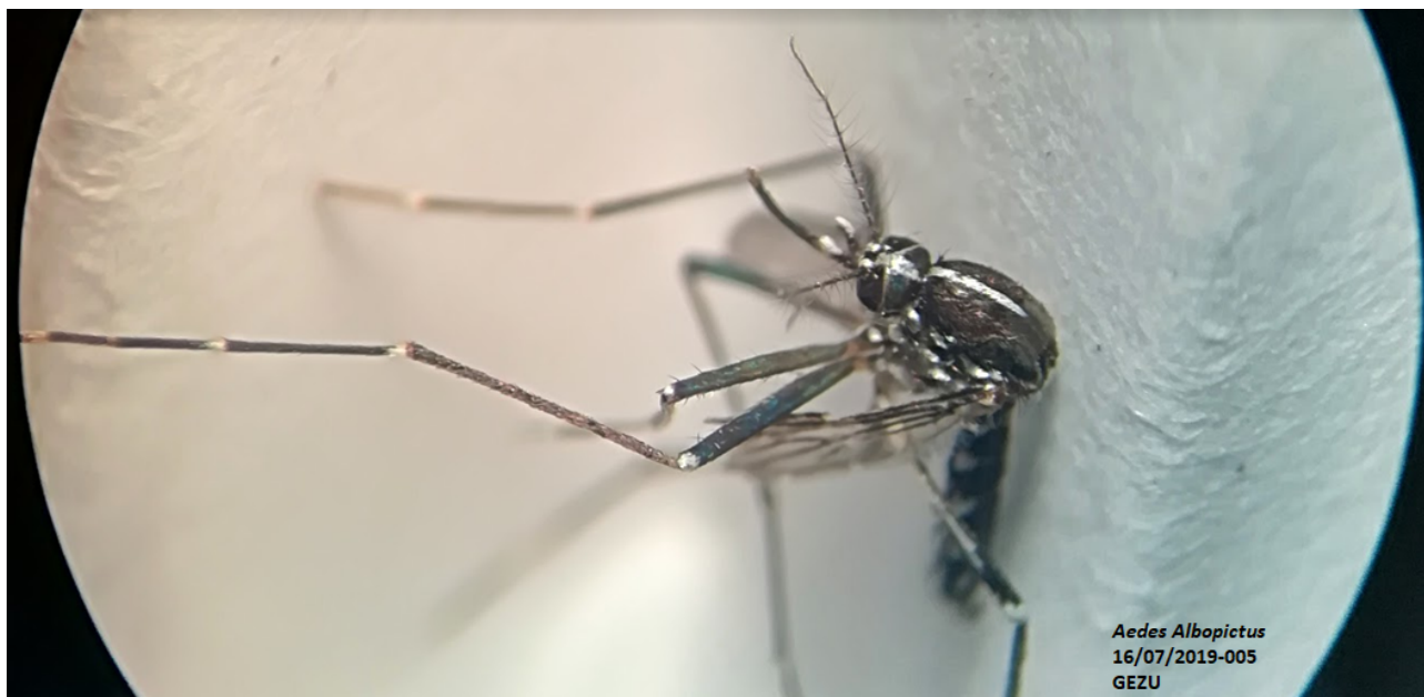
Figura 2. Vista dorsal del tórax de Ae. albopictus , espécimen recolectado en el área de influencia del Proyecto Hidroeléctrico Ituango. Antioquia.

Un comportamiento similar se observó para los estados inmaduros con un 47,3% de las capturas en peridomicilio y un 52,7% en el extradomicilio. No se registraron capturas en el embalse.