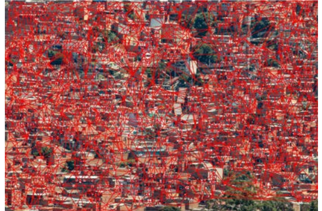
Conexiones aisladas, 2020. Video.

Dadas las configuraciones urbanísticas en nuestros barrios populares, se puede ver el territorio que habitamos como una gran familia en donde todos aportan al cuidado de la colectividad, porque la distancia social se torna difícil, cuando la misma morfología de las viviendas y su aglomeración ya lo impiden.