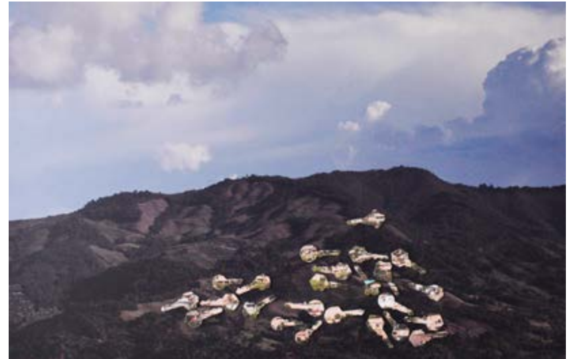
Abriendo montañas , 2018. Ensamble. Objeto intervenido con impresión fotográfica adhesiva sobre impresión digital 60 cm x 80 cm.

Haciendo una metáfora sobre el habitar encuentro la idea de hogar, casa, vivienda, contenida de manera simbólica en un objeto pequeño, la llave. Este nivel de abstracción permite visibilizar la relación de las unidades frente al todo y detonar pensamientos sobre lo que hubo antes de lo urbano. La ciudad se constituye por un sin número de partes fundadas sobre áreas que en un momento pertenecieron a la naturaleza y en un afán por crecer se construyó restando importancia en los desarrollos urbanos a los lugares verdes, parques, reservas, etc. Vemos como el cemento va absorbiendo estos sitios, generando un desplazamiento constante del paisaje natural.