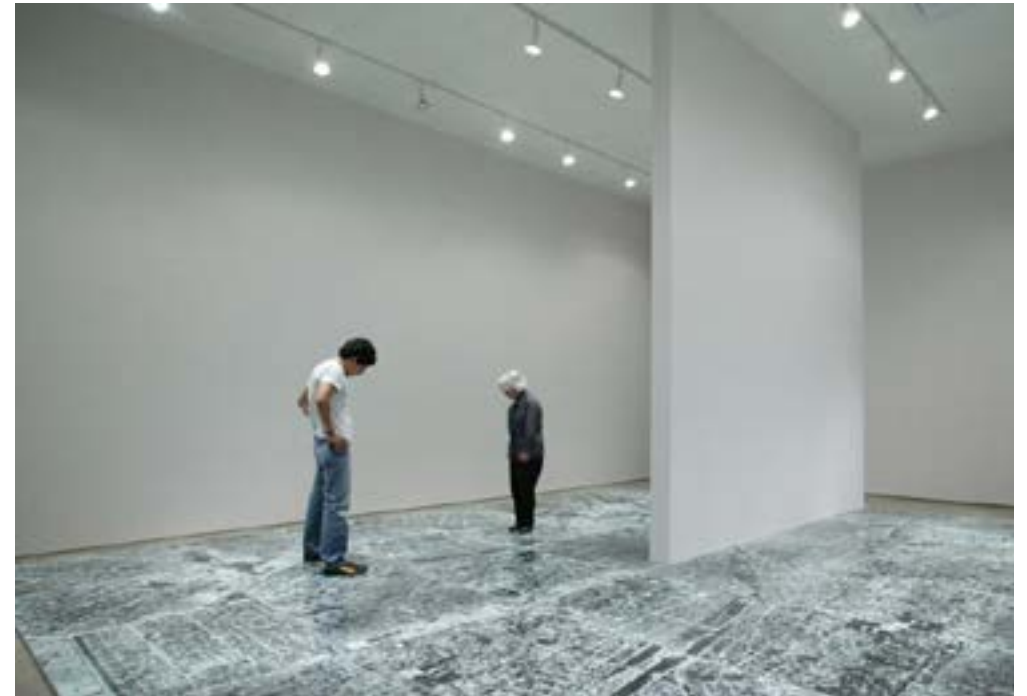
Oscar Muñoz. Ambulatorio , 1994. Instalación (Fotografía y vidrio de seguridad).

Nació en Popayán, en el año de 1951. Desarrolló sus estudios en la escuela de bellas artes de la ciudad de Cali en la década del setenta. Es conocido principalmente por la exploración y búsqueda de materiales que ofrecen una inestabilidad en la imagen, aunque sus intereses conceptuales están ligadas al tiempo, la mortalidad, la identidad, la memoria y temas relacionados con la transformación de los individuos, encuentro una relación con el paisaje en la instalación Ambulatorios , es una impresión de gran formato, de un área de la ciudad de Cali, ubicada en el suelo sobre la que se encuentra una película de vidrio de seguridad por la que caminan los espectadores, se generan fracturas en el vidrio cuando se camina por este. La instalación se realizó en una época de violencia, surge de un bombardeo realizado en esta ciudad de Cali (clavoardiando, 2018). Abordo este artista no desde sus búsquedas y desarrollos conceptuales sino más bien desde sus estrategias para integrar el tiempo como un agente activo que tiene un papel fundamental dentro de sus propuestas. Me interesa cómo articula el tiempo desde sus reflexiones en torno a la fugacidad, el desaparecer, lo efímero, la memoria y la inestabilidad de la imagen.