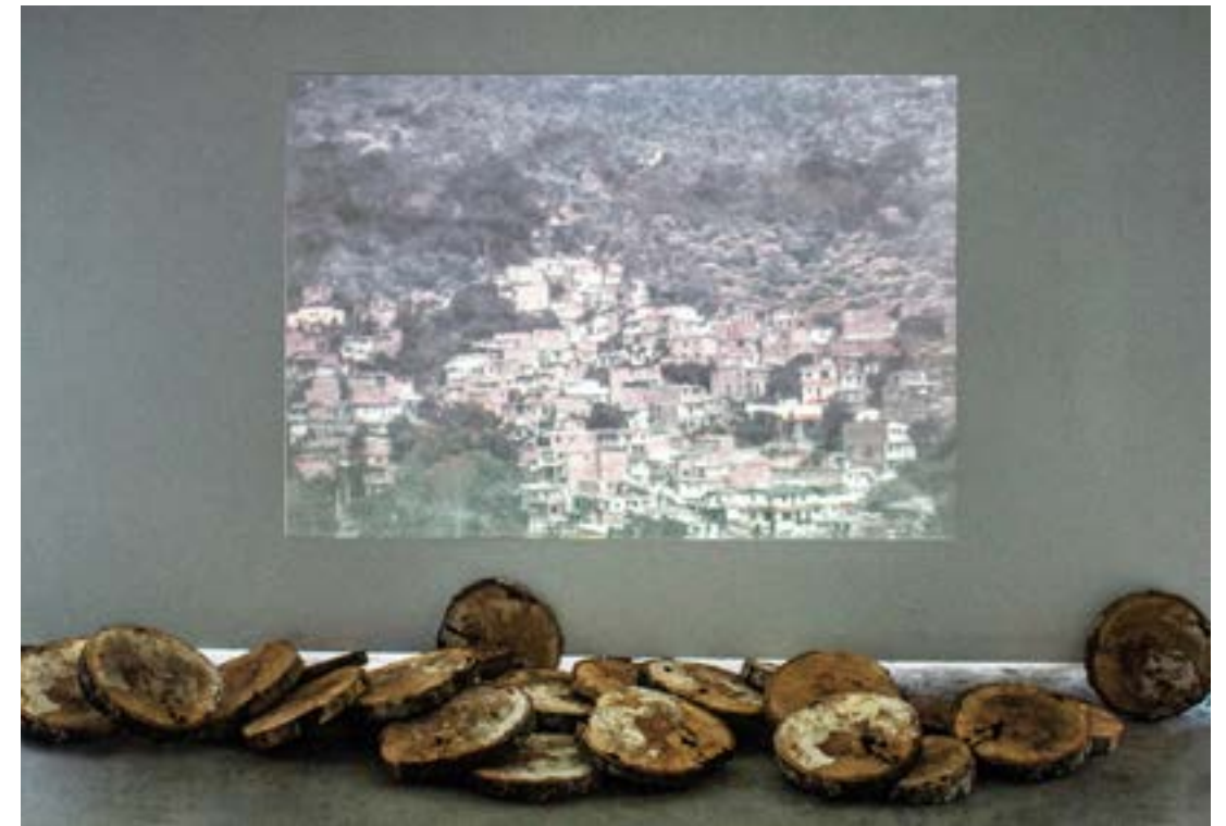
Descenso/ascenso , 2019. Vídeo instalación. Proyección sobre pared 43 rodajas de tronco de árbol.

El vertiginoso y acelerado crecimiento de las ciudades deja en evidencia una relación tensa entre lo urbano y lo rural, la ciudad y sus límites. El crecimiento desbordado genera un desplazamiento de la naturaleza cada vez mayor, se cambian los árboles por el concreto y la ciudad se deja ver como una plaga que se extiende, como un virus que infecta amplias superficies que en algún momento fueron verdes. Descenso/ ascenso plantea reflexiones en torno al crecimiento de los barrios marginales que debido a la necesidad y a la emergencia del espacio se extienden sobre terrenos ubicados en laderas, casi como si las casas se construyeran sobre una pared. Utilizo una animación que se realiza a partir de dos fotografías, fundiéndolas progresivamente a partir de fotomontajes y con ellas obtengo 213 imágenes que utilizo como frames para dar vida a la animación. La narrativa visual hace un paralelo entre la textura urbana que va adquiriendo cualidades de deterioro con el tiempo y la exposición al medio ambiente, en contraposición a las texturas del tronco, que de la misma manera se degradan con el tiempo. Por esto, las maderas utilizadas en este proyecto llevan un proceso de exposición al medio ambiente y a factores de humedad, que no solo las llenan de texturas, sino que también las han recargado de vida, dejando sobre estas cantidades de insectos y hongos.