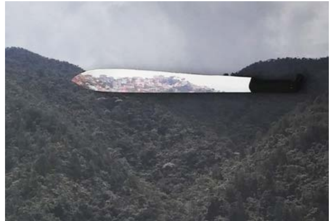
Al filo , 2018. Ensamble. Objeto con impresión sobre adhesivo, Fotografía color 60 cm x 90 cm sobre retablo de madera

La ciudad es como un sistema vivo que crece constantemente, imponiéndose sobre su entorno natural, montañas y bosques que la rodean. Invasiones y crecimiento ilegal son un problema evidente que deriva en futuros retos de integración y permanencia, tales como: la estabilización de los terrenos, las adecuadas conexiones a los principales servicios domésticos o conexión al transporte público. El Machete es una herramienta colonizadora que por medio de su filo logra abrir paso a través del bosque, con el que generalmente tiene una relación violenta, además, como el hacha el machete es una herramienta cotidiana de la cultura antioqueña, cultura históricamente colonizadora y aventurera que se extendió por un territorio geográficamente complejo con herramientas básicas. El nombre nace de los múltiples significados que puede tener la palabra filo, referenciando siempre el límite: podemos vivir al filo, vivir en el filo. Además el machete también es portador de un filo que expande los límites de la ciudad: lo que hoy es bosque, mañana será un nuevo barrio.