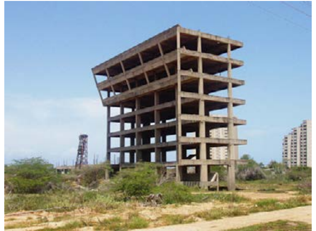
Alexander Apóstol. De la serie skeleton coast , 2005. Fotografía digital, 75cm x 100cm.

Me interesa cómo este artista logra posar su mirada en aspectos sensibles, concretos que hablan de sucesos, circunstancias que alteran las dinámicas y en consecuencia el paisaje (Apóstol, 2005).