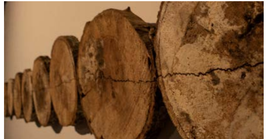
Texturas descompuestas del caos , 2019. Talla sobre rodajas de tronco de árbol 30 cm x 430 cm.