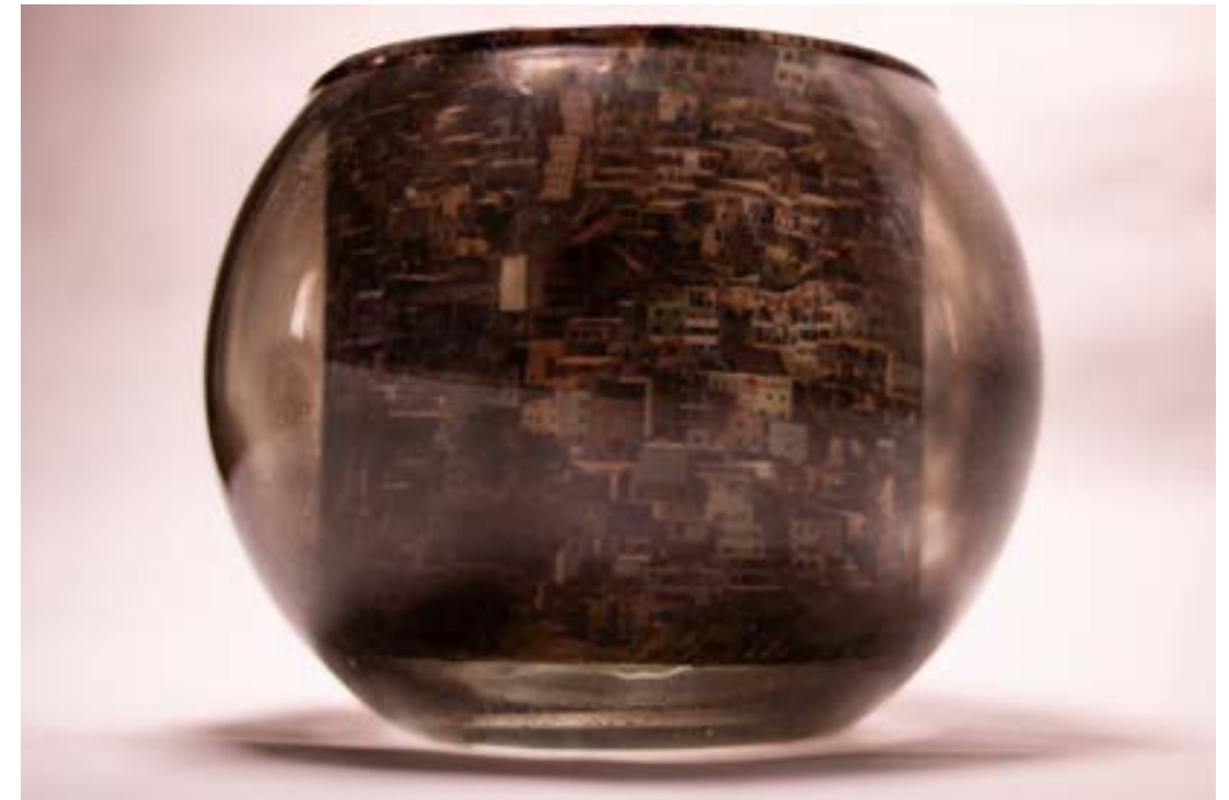
Inhalo , 2020. Fotografía digital.

Finalmente, en el proceso encuentro cómo la combustión de aire produce una imagen abstracta por el registro que consigna el hollín de esta situación, y con la superposición de texturas materiales y visuales, busco que se conjuguen los pesares que agotan nuestro aliento, vinculando el borramiento como signo narrativo que comenta este paisaje urbano en Medellín, abrazado por la nube grisácea y desesperanzadora.