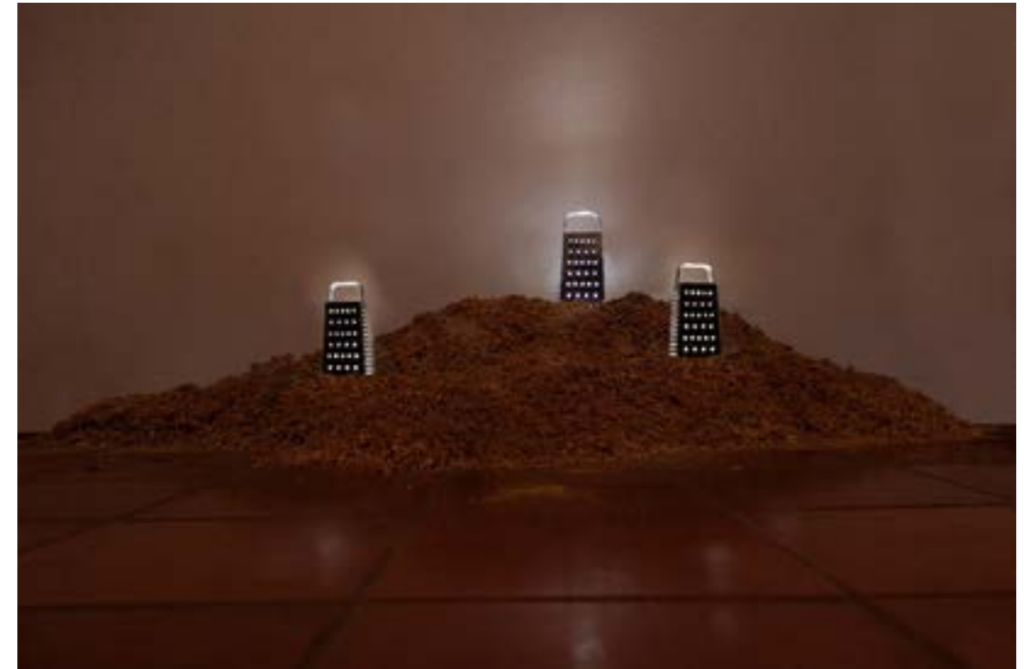
Hábitat , 2020. Instalación (luces led, rayadores, madera).

Planteo un paisaje que juega entre lo micro y lo macro, generando metáforas con los modelos constructivos y la pérdida de áreas verdes. A primera vista tiende a ser un paisaje idílico de ciudad, sin embargo, adquiere un carácter siniestro una vez analizados los elementos que lo conforman, como si esas edificaciones se levantaran sobre montañas de residuos generados por ellas.