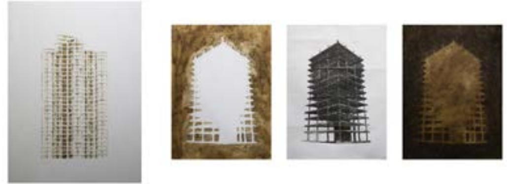
¿Efimeros? , 2020. Pintura con óxido de hierro y dibujo con calor sobre papel termosensible.

Estas representaciones en principio, y a modo de experimentación, las cualifico desde lo gramatical construyendo una serie donde se presentan relaciones entre vacío y lleno, contenido y forma y elementos estructurales.