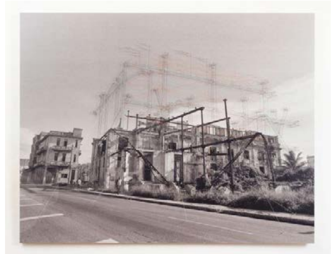
Carlos Garaicoa. Sin título (Chocolatería) , 2014. Alfileres e hilo sobre fotografía lambda montada y laminada sobre gator board, 125 x 160 cm.

Es un artista que se centra en un diálogo entre arte y espacio por medio del cual investiga la estructura social de las ciudades en cuanto a su arquitectura, utilizándola como referencia formal y metafórica, siendo esta un espacio de análisis en torno al contexto social, así mismo, aspectos visuales de esas arquitecturas dinamizan ese contexto. Garaicoa considera que la arquitectura es un espacio moldeable, abierto, público real como lo es el espacio urbano.