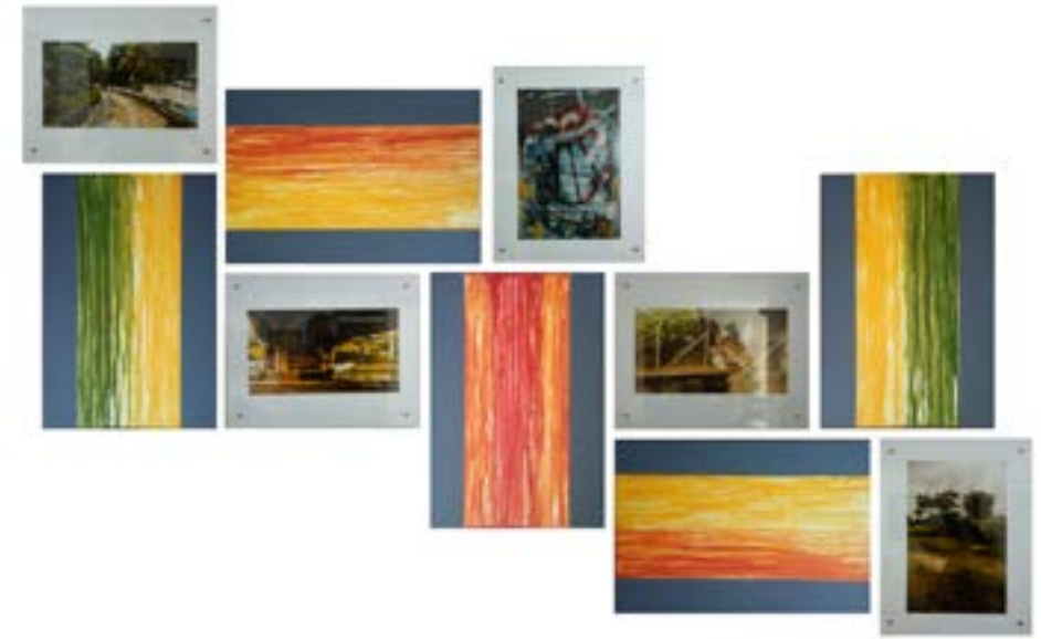
Perpetuo y Fugaz , 2018. Instalación en pared, 115 cm x 206 cm (Fotografía digital y acrílico sobre madera)

Mi interés ha sido captado por la complejidad de las calles, sus texturas y colores, que con el tiempo van creando atmósferas particulares, entregando una identidad propia a cada lugar. Me enfoco en los espacios de tránsito, lugares de nadie, que nos muestran una cara de la ciudad, un reflejo de la realidad, evidencias del tiempo y de la continua mutación, pues nada permanece igual. En este mosaico, aparecen registros de ciudad y a su vez síntesis de las variaciones cromáticas implícitas en las fotografías, siendo estas analizadas desde un punto de vista netamente pictórico, llegando a los colores predominantes que me llevan a reflexionar sobre el papel que cumple el color y su importancia como agente de atención, como señal. El movimiento, la velocidad, la complejidad y el ruido son parte de la distorsión que altera nuestros sentidos y nos permite ver el lugar que habitamos o por el que transcurrimos con ciertas particularidades caóticas que se normalizan.