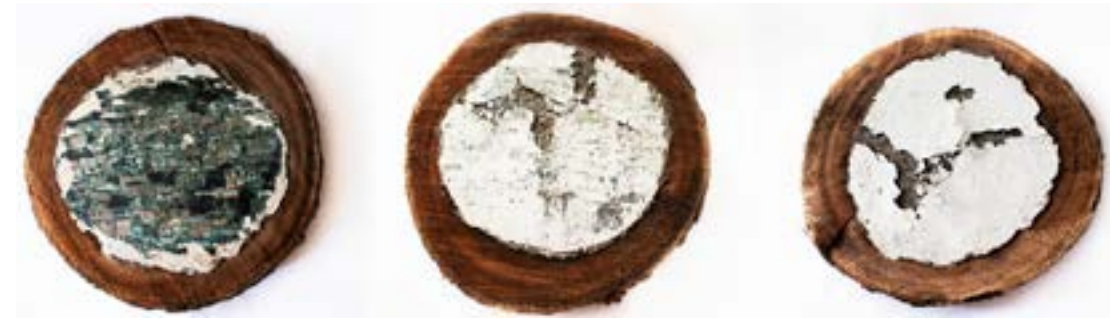
Edificaciones del olvido, 2019. Transfer fotográfico sobre estuco y cemento en madera.

Sobre tres rodajas del tronco de un árbol, instalo un fragmento de pared, preparado con maya, cemento y estuco; cada uno expuesto a distintos desgastes, por lo que los materiales antes mencionados se pueden visualizar en capas que simulan el agrietamiento de ciertas estructuras y a la vez se hacen portadoras de una imagen que termina por fundirse en el material.