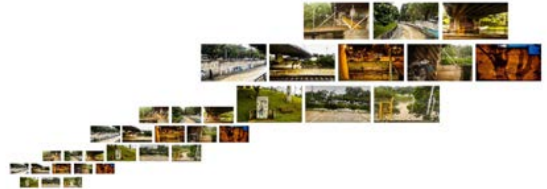
La ceguera de la cotidianidad , 2018. Mosaico fotográfico (fotografía digital).

Esta pieza se presenta a partir de una secuencia de once fotografías que se repiten y cada una más grande que la anterior, con lo que busco expresar esa monotonía que adormece la mirada en la cotidianidad y vuelve estos lugares paisajes vacíos, poéticas del olvido.