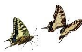
Metamorfosis de Papilio machaon (Imagen de Jens Stolt).

lo que trae la guía del Ministerio y no les agradan otras actividades de tipo lúdico, recreativo que los docentes hagan para lograr que los estudiantes construyan los conocimientos.