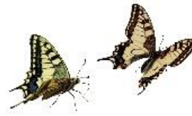
Metamorfosis de Papilio machaon (Imagen de Jens Stolt).

aprendí a trabajar mucho en equipo con mis compañeras a conocer de las necesidades y dificultades de cada una de las familias que asisten al programa. Unas madres muy participativas en cada uno de los encuentros educativos grupales al igual muy atentas en las visitas del hogar, todas ellas muy cumplidas en cada una de las unidades de servicio donde se prestaba el servicio. En el 2019 el operador del Programa fue la fundación las Golondrinas, fue un trabajo muy arduo, teníamos una coordinadora muy exigente y casi no teníamos tiempo para compartir con nuestras familias, sin embargo, una experiencia muy bonita los niños y las familias al igual que la docente y la auxiliar estrechan una relación bonita. Esta bella labor termina el 15 de diciembre de 2019.