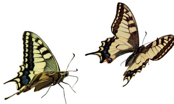
Metamorfosis de Papilio machaon (Imagen de Jens Stolt).