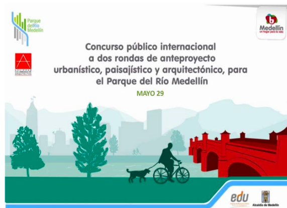
Ilustración 8. Ecard del concurso “A dos rondas”

Que las perspectivas de quienes habitan el territorio incidan en la toma de decisiones sobre sus espacios, es un claro ejemplo de participación ciudadana. Respecto a ello, en el desarrollo del proyecto de renovación urbana de Parques del Río, la participación ciudadana se dio de manera descentralizada y a través de diferentes mecanismos, entre los que se destacan los señalados en la ilustración 8 y 9.