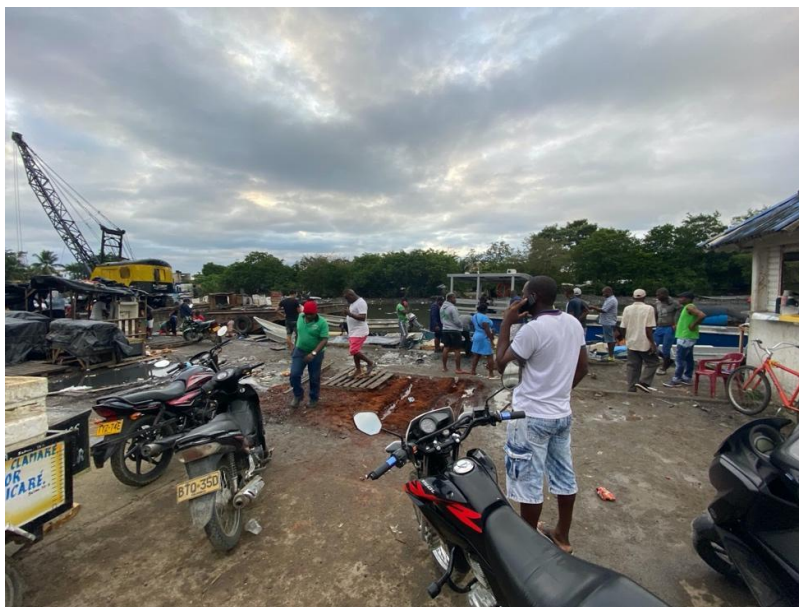
Ilustración 3. Waffe, Turbo, Antioquia