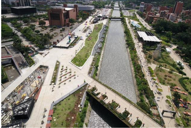
Ilustración 7. Parques del Río