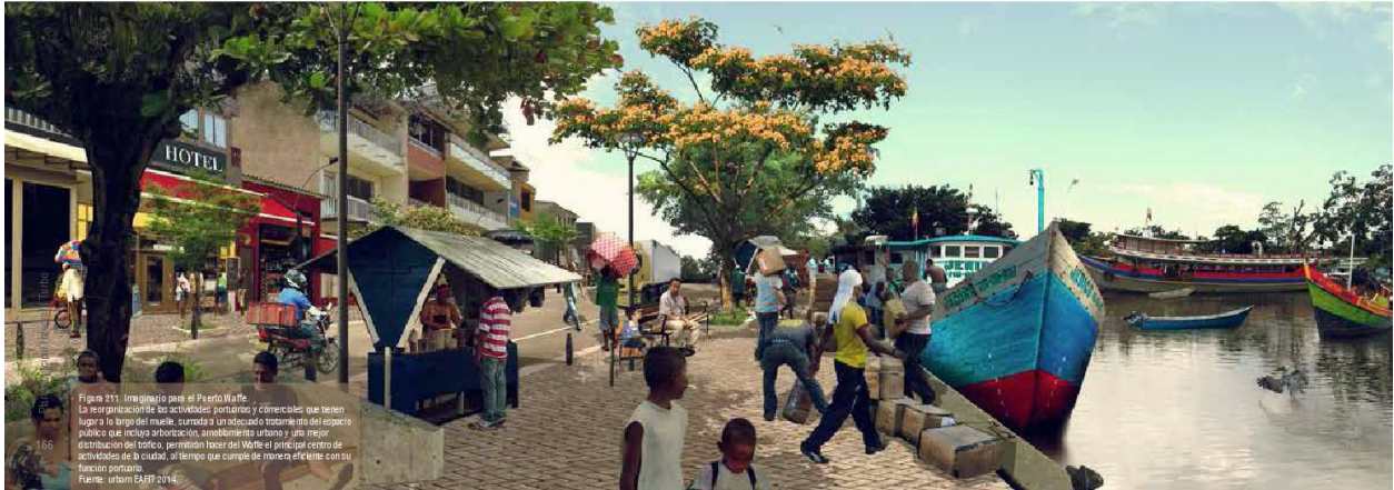
Ilustración 4. Render Proyecto estratégico recuperación integral del waffle

II. El paseo urbano de Turbo: conformado por las calles 101 y 115, este permitirá recorrer las particularidades de la ciudad, los caños Veranillo y Puerto Tranca, el centro fundacional y comercial, la bahía y la playa (ilustración 4).