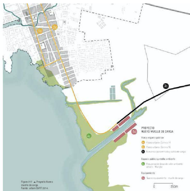
Ilustración 6. Render nuevo muelle de carga