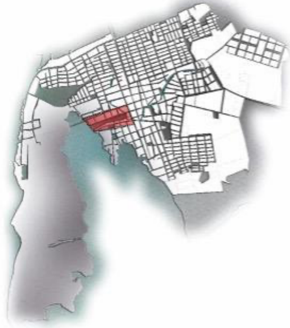
Ilustración 2. Ubicación de la zona del Waffe en el casco urbano de Turbo