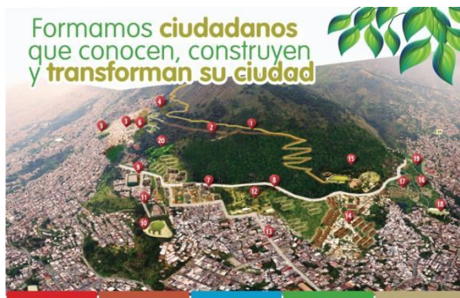
Ilustración 10. Ecard del proyecto Jardín Circunvalar