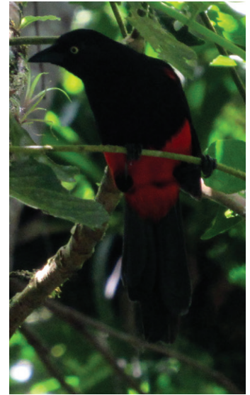
Figura 2. Uno de los individuos del Cuckoo Colombiano Hypopyrrhus pyrohypogaster registrado en el municipio de Cubarral, depto. del Meta, agosto 2017

El Chango Colombiano o Chango Ventrirrojo Hypopyrrhus pyrohypogaster es una especie endémica de Colombia 5 , categorizada como Vulnerable (VU) a nivel nacional y global debido a que presenta una distribución severamente fragmentada, y a que se estima que tanto su distribución como su población continúan en disminución en cuanto a extensión de ocurrencia, área de ocupación, extensión y / o calidad del hábitat, número de subpoblaciones y número de individuos maduros 11 . Se estima que el tamaño de