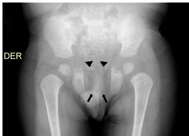
Figura 2 Radiografía anteroposterior de pelvis evidencia ausencia de osificación de las ramas iliopúbicas (cabezas de flechas) y osificación parcial del isquion, con ausencia de las ramas isquiopúbicas (flechas).

del isquion, con ausencia de las ramas isquiopúbicas (fig. 2). No se ampliaron estudios para detectar anomalías en el desarrollo óseo de manos y columna vertebral.