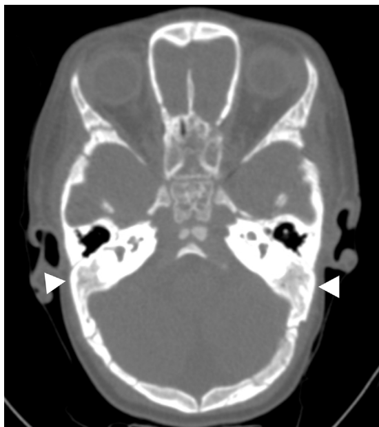
Figura 4 Tomografía computada de la cabeza con ventana para hueso identifica ausencia de neumatización de las celdillas mastoideas (cabezas de flechas).