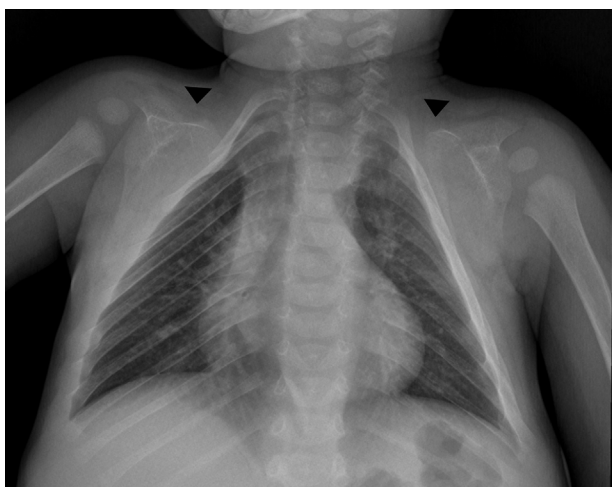
Figura 1 Radiografía anteroposterior de tórax muestra la apariencia triangular del tórax, con ausencia congénita de ambas clavículas (cabezas de flechas).

A pesar de su baja prevalencia, se considera necesario el conocimiento de esta entidad por parte del médico radiólogo para realizar un diagnóstico adecuado y oportuno. Por ello, comunicamos el caso de un niño de 3 años que consultó inicialmente por una caída desde aproximadamente 1 metro de altura, con trauma en miembro superior derecho. En la radiografía (Rx) se evidenció una fractura del cóndilo lateral humeral. No obstante, en el examen físico se encontró talla baja, hipertelorismo y alteraciones óseas craneales, consistentes en diastasis de suturas y persistencia de fontanela anterior abierta, además de macroglosia, paladar ojival, dismorfismo dentario (se sospechó diagnóstico de Síndrome de Pierre Marie Sainton en su forma esporádica), ausencia de clavículas y pectus excavatum . La Rx convencional de tórax anteroposterior demostró apariencia triangular del tórax y ausencia congénita de ambas clavículas (fig. 1), mientras que la Rx anteroposterior de pelvis reveló ausencia de osificación de las ramas iliopúbicas y osificación parcial