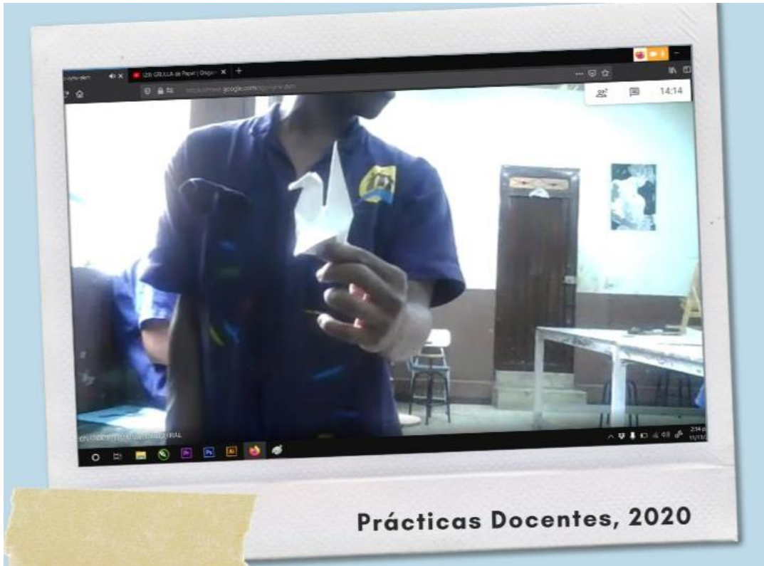
Pantallazo encuentro virtual Prácticas Docentes