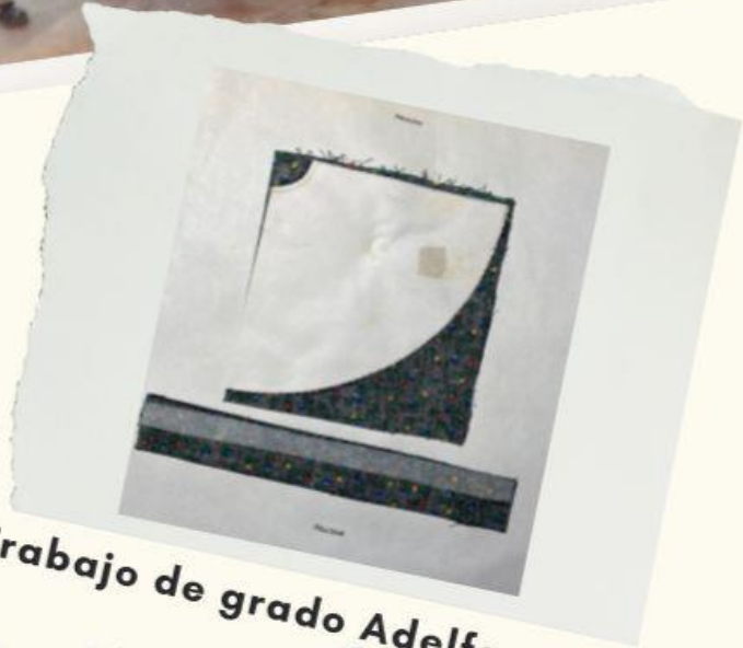
Trabajo de grado Adelfa, 1993