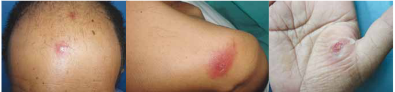
FIGURA 1. Nódulo eritematoso con centro blanquecino, de 1 cm de diámetro en la frente.