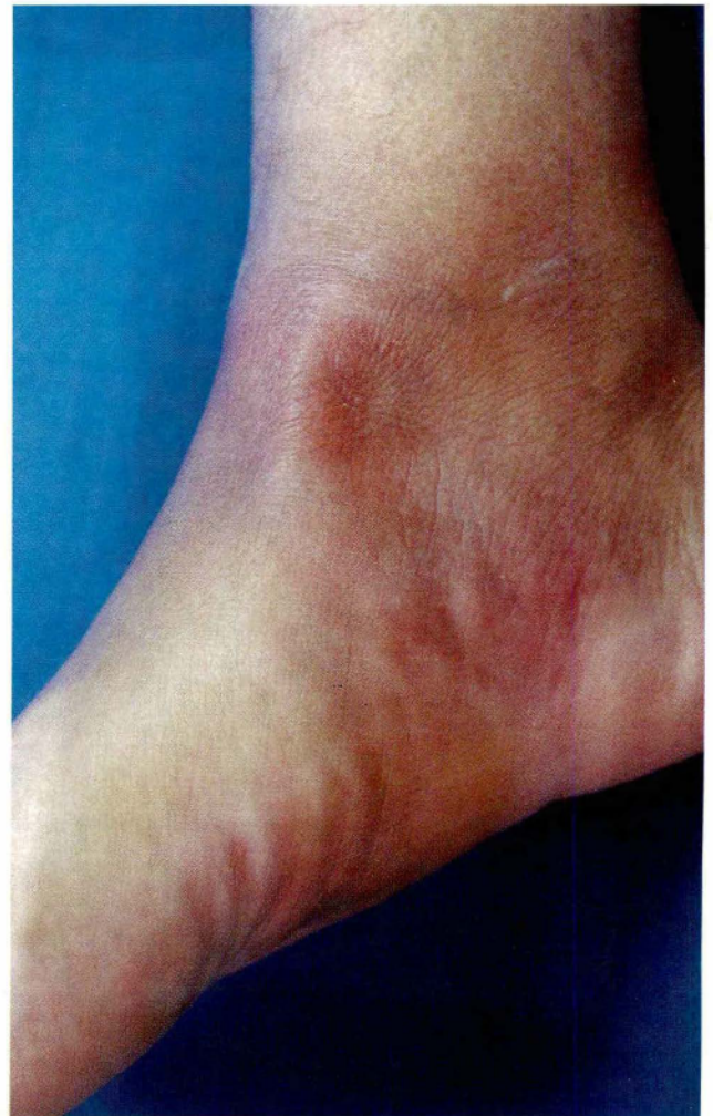
Figura 1. Placas y nódulos eritematosos en la pierna derecha

dolorosos al tacto (Figura 1). En la pierna izquierda había dos nódulos similares.