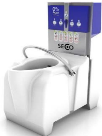
Figura 2. Estructura Sanitario Seco