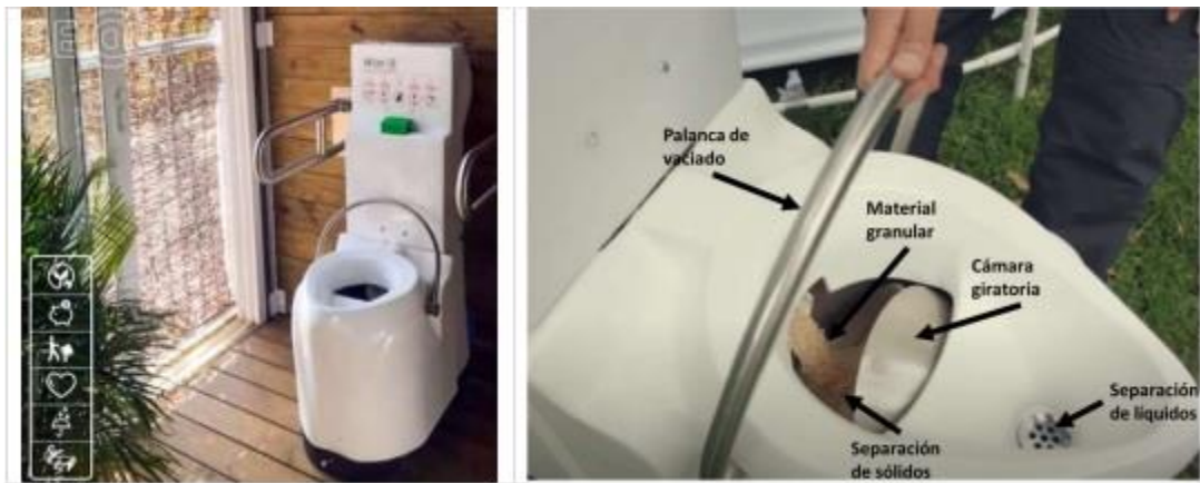
Figura 1 - Sanitario Seco.