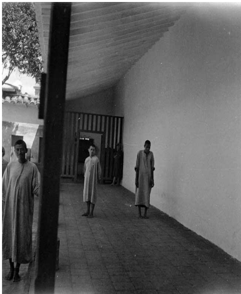
Manicomio Departamental.