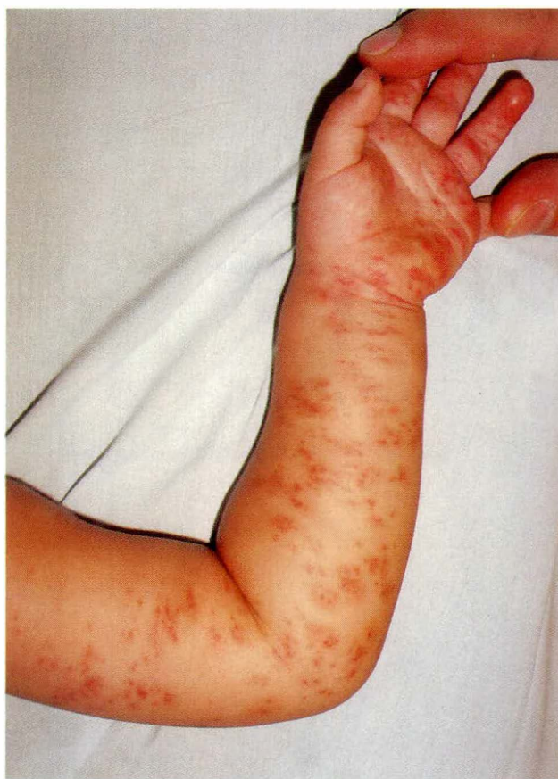
Figura 1. Máculas eritematosas unilaterales que palidecen a la dígito-presión.

Correspondencia: Silvia Herrera H. , Hospital Universitario San Vicente de Paúl, teléfono 212 5921, Medellín, Colombia. E-mail: silviah@epm.net.co.