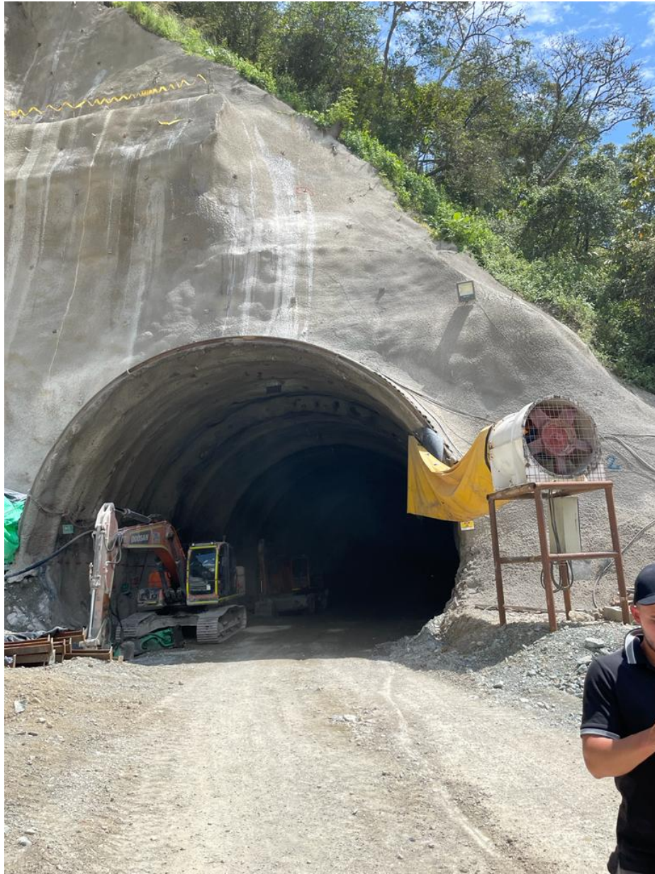
Nota: Portal entrada Túnel 3. 21 de octubre de 2022.