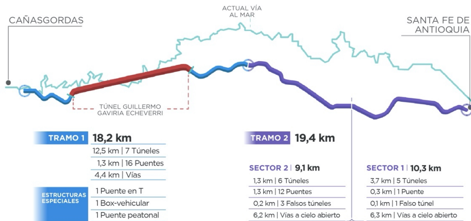
Ubicación Túnel Guillermo Gaviria Echeverri

Nota. Fuente https://www.tunelgge.com/descripcion.php (Túnel Guillermo Gaviria Echeverri, s.f.)