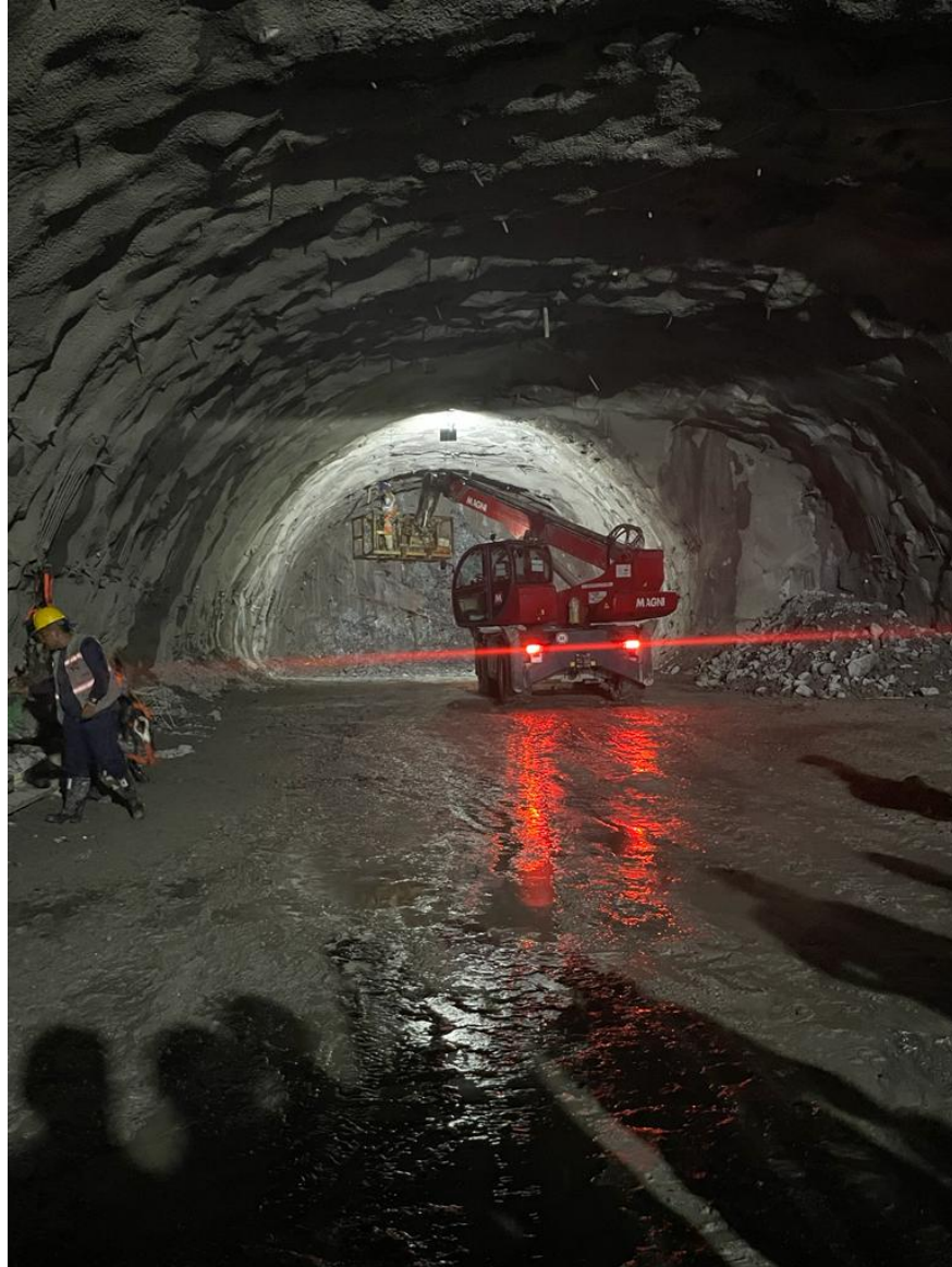
Nota: Túnel 4. 21 de octubre de 2022.