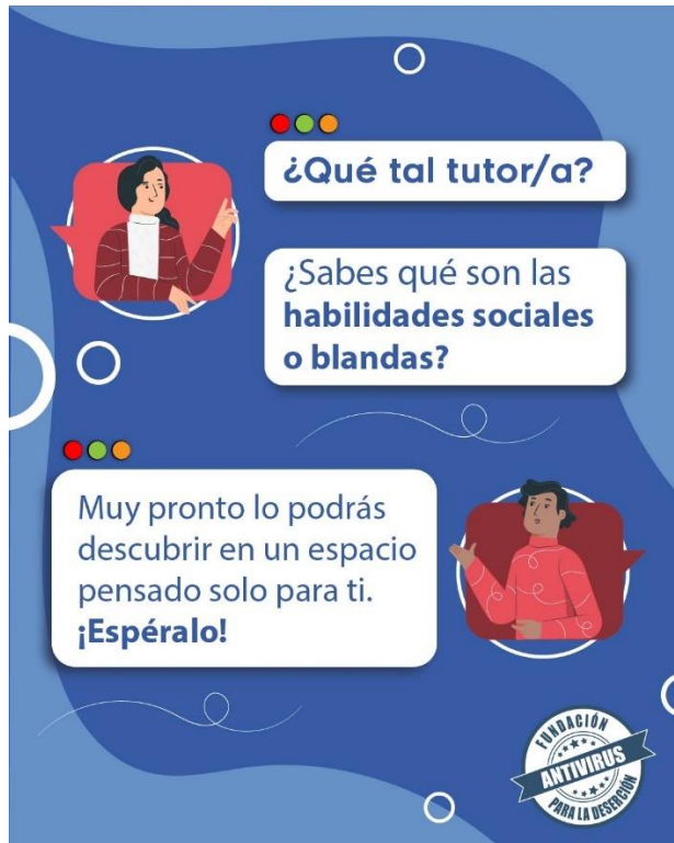
Figura 2 Difusión expectativa 1

Nota: Fuente: Antivirus para la Deserción