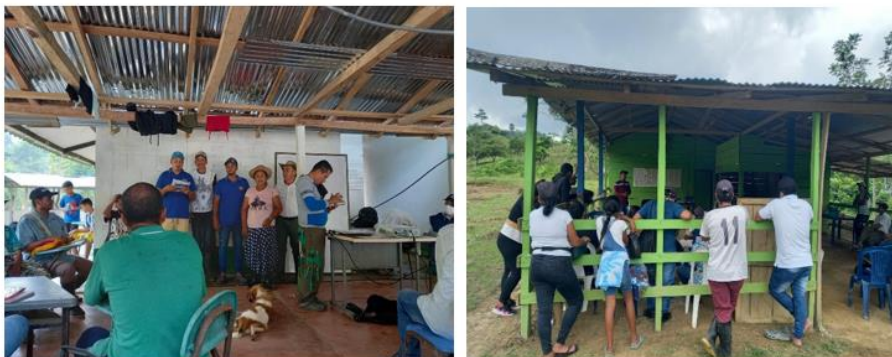
Tabla 7 Diario de campo