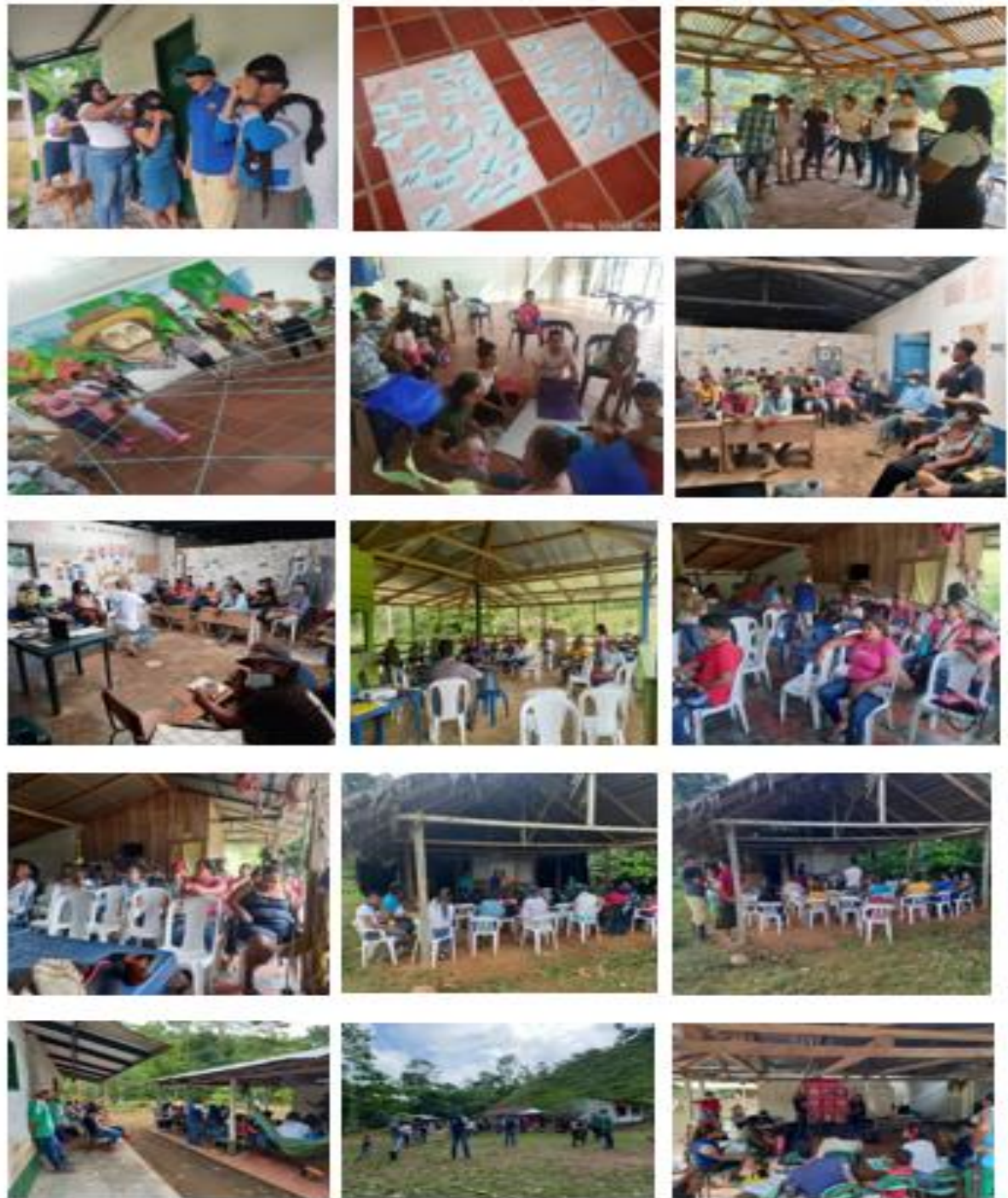
Figura 7 Recopilación de actividades ejecutadas en el ejercicio de prácticas

Nota: Fotos de la experiencia de práctica en veredas del corregimiento San José de Apartadó.