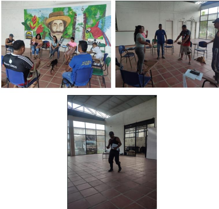
Tabla 6 Diario de campo