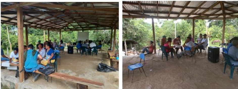
Tabla 8 Diario de campo