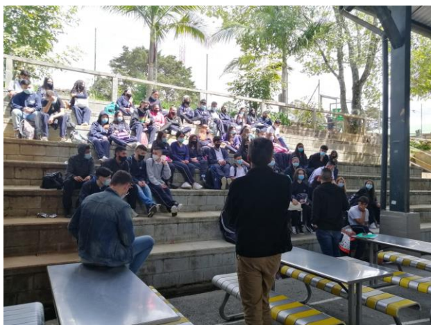
Fotografía 3. (Mesa de Concertación en la Institución Educativa Las Palmas en Envigado)

También se tuvo la oportunidad para el mes de marzo, de presenciar la primera sesión de la Comisión de Concertación y Decisión donde se buscó la coordinación del plan de trabajo que se realizaría durante el año con el equipo del programa de Envigado Joven y la juventud del municipio. También se hizo lectura de los informes de gestión de Envigado Joven del año 2020, del plan de acción del programa y la caracterización de la población en el municipio que se adelantó durante meses anteriores con la intención de poder brindar un informe de gestión de lo que venía adelantado la secretaría en temas de juventud.