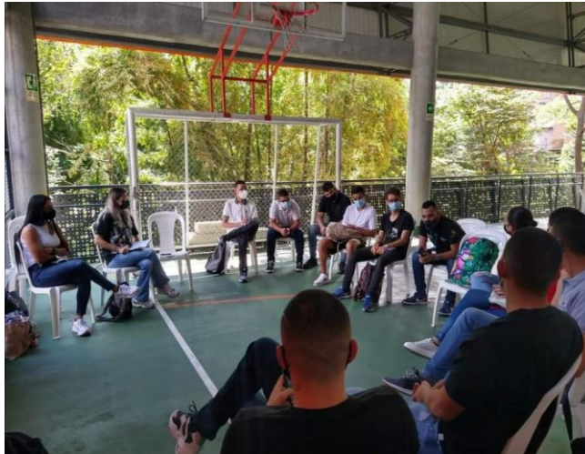
Fotografía 1. (Mesa concertación urbana en el Centro de Encuentro Ciudadano -CEC- de San Marcos del Municipio de Envigado).