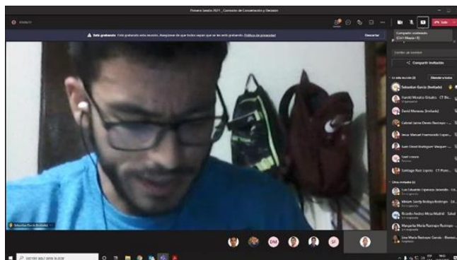
Fotografía 3. (Primera sesión de la Comisión de Concertación y Decisión virtual)

También se tuvo la oportunidad para el mes de marzo, de presenciar la primera sesión de la Comisión de Concertación y Decisión donde se buscó la coordinación del plan de trabajo que se realizaría durante el año con el equipo del programa de Envigado Joven y la juventud del municipio. También se hizo lectura de los informes de gestión de Envigado Joven del año 2020, del plan de acción del programa y la caracterización de la población en el municipio que se adelantó durante meses anteriores con la intención de poder brindar un informe de gestión de lo que venía adelantado la secretaría en temas de juventud.