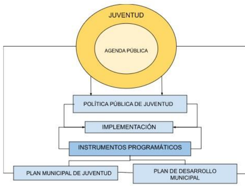
Gráfico 1. Estructura de relacionamiento de los conceptos.

Incluso, muchos alegaban que la implementación era simple, y que por eso no parecía involucrar asuntos significativos. Por su parte, Van Meter y Van Horn (1975) señalan que la implementación de políticas abarca acciones de individuos o grupos públicos y privados que buscan el cumplimiento de los objetivos previamente decididos. Sus acciones son pequeños esfuerzos con el objeto de transformar las decisiones en principios operativos, así como esfuerzos prolongados para cumplir los cambios, pequeños o grandes, ordenados por las decisiones políticas.