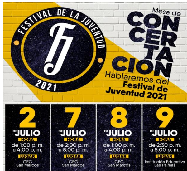
Fotografía 2. (Ecard de las Mesas de Concertación del Festival de la Juventud en Envigado)