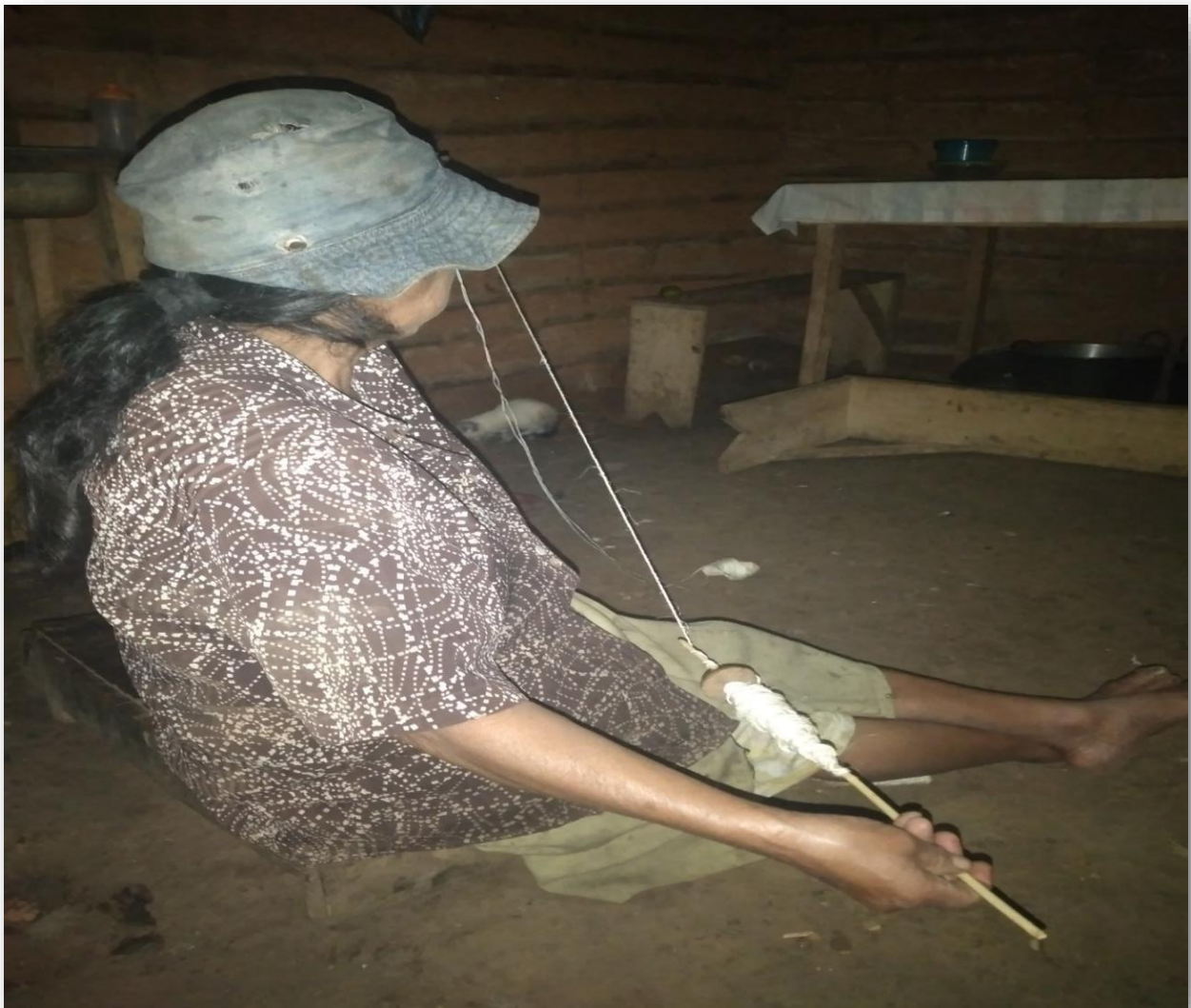
Evidencia fotográfica. Nueo 1. Tomada por Liliana Dagua 23 de marzo 2022.