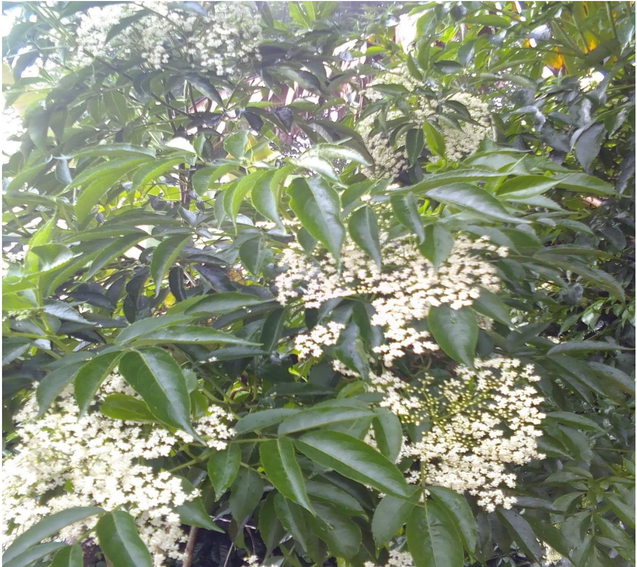
Evidencia fotográfica. Número 19, tomada por Liliana Dagua 20 de marzo 2022.

La planta sagrada del sabuco los mayores la cocinan las flores para la gripe y mucha tos, la recomendación es no consumirlo en mucha cantidad cuando no tenga síntomas de gripa por que puede generar diarrea por las propiedades frías que posee.