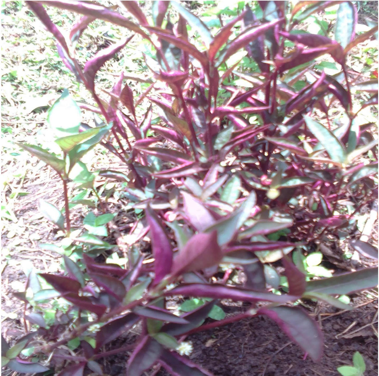
Evidencia fotográfica. Número 21, tomada por Liliana Dagua 20 de marzo 2022.

Es una planta fresca que la utilizan los mayores espirituales en los rituales, sin embargo, algunas familias las utilizamos para la fiebre haciendo el proceso de machacar las hojas y el sumo tomarlo o echar en la frente, cuello o espalda .