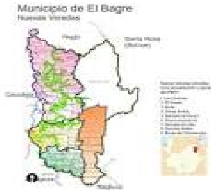
figura 2 mapa del Bague Antioquia

La comunidad indígena los Almendros se encuentra localizada en la jurisdicción del municipio de El Bague, en la subregión del Bajo Cauca Antioqueño a 22 kilómetros aproximadamente vía al corregimiento de Puerto López.