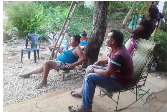
figura: 7 socialización de la semilla con mi familia