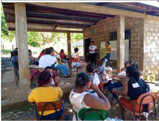
figura: 17 socialización del proyecto

protegernos entre nosotras mismas y así mismo cuidar de nuestra familia, comunidad y territorio; las mujeres recomendaron que se involucre a toda la comunidad ya que contamos con los mayores que están dispuestos a seguir trabajando por la comunidad, ya que los jóvenes, hombres y mujeres se necesita que se apropien más de la cultura; en la socialización de la cosecha participaron un grupo de mujeres en compañía de un médico tradicional y una partera.