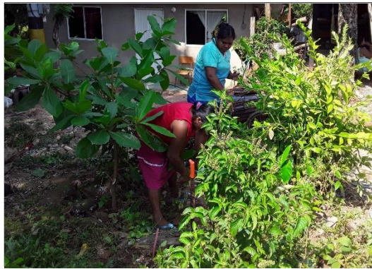
Figura: 6 siembra familiar

Creación de grupo de mujeres veedoras del cuidado de la siembra.