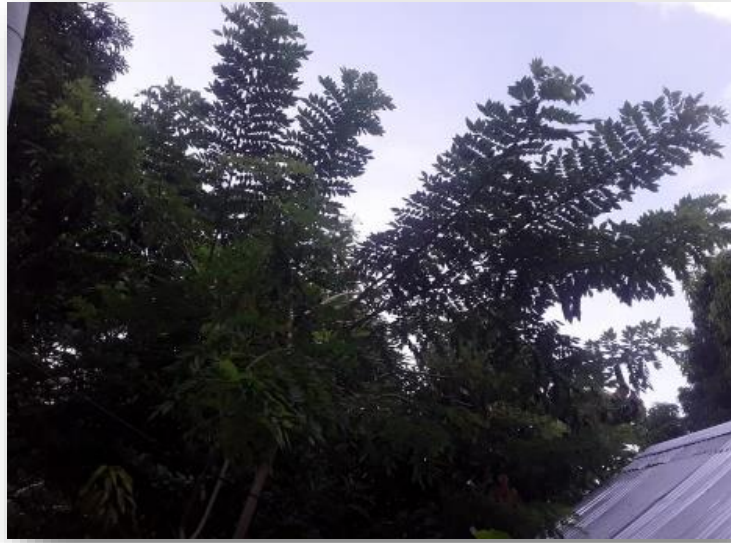
Figura 10 planta Matarratón (Gliricidia)

fiebres muy fuerte, en cuanto a la madera muy poco se manipula ya que es más manejada para cercas vivas.