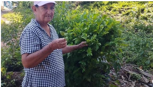
Figura:15 Abuela conocedora de la planta

Las plantas medicinales juegan un papel muy importante en la identidad cultural, ya que la mujer a diario está tejiendo conocimientos a través la medicina tradicional, la cual es la práctica basada en las creencias y experiencias propias, donde la mujer ocupa un papel muy importante, así como lo menciona el sabio de la comunidad “ las mujeres en la comunidad y en la familia ocupan un lugar muy imporre ya que aunque son dadoras de la vida también tienen el instinto de cuidar, proteger a la familia ya que son las que más se ocupan de la salud de los que la rodean; las mujeres tienen mucha relación con las plantas, ya que son las encargadas de cuidar, proteger y generar vida y aun así las plantas medicinales es una parte que demuestra identidad cultural Senú y está más relacionada con las mujeres”. (Conversatorio, con medico tradicional Teodoro, marzo 2021).