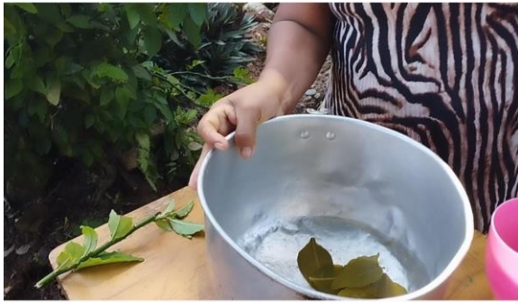
Figura: 13 practica del uso del Ultimorrial por una abuela.