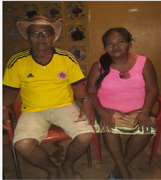
Figura 1 Padre y Madre, foto tomada por Valeria Herrera 2021