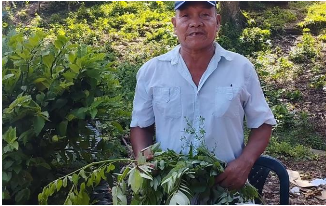
Figura 8 medico tradicional, fecha junio 2022.

(1990) definió esta disciplina como el estudio de la relación entre el hombre y la vegetación que lo rodea, en especial que lo concierne al hombre primitivo y a especies agrícolas.