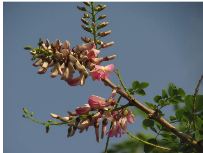
Figura 12 flor del matarratón 8

https://www.uninorte.edu.co/web/ecocampus/matarrato