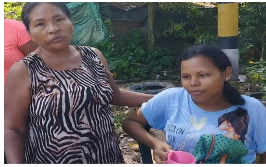
Figura: 14 conversatorio sobre los beneficios del Ultimorrial