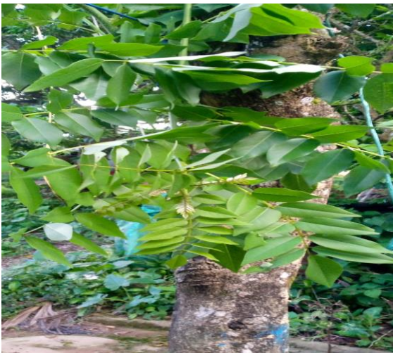
Figura 11 hojas de matarratón