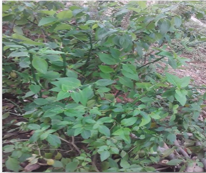
Figura: 9 Planta Ultimorrial (pedialanthus), Foto tomada: Nelis Mendoza, Fecha: agosto2021.

a la mamá gestante en el octavo mes, ya que le ayuda a sacar el frío que recoge durante el embarazo, también se utilizan las hojas para curar heridas, la leche es utilizada para tumbar verrugas