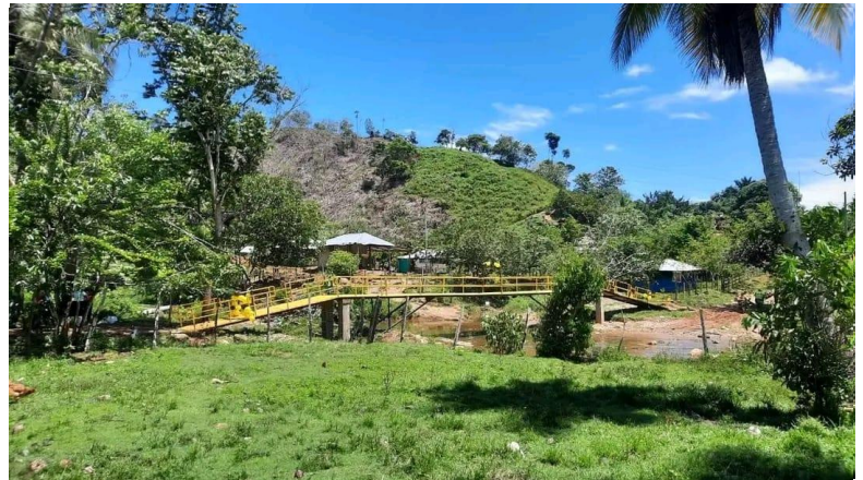
figura 5 comunidad los Almendros

https://es.m.wikipedia.org/ Septiembre 2020