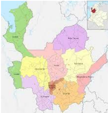
Figura 4 mapa de Antioquia

https://es.m.wikipedia.org/ Septiembre 2020