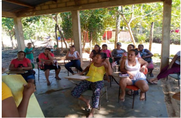
figura: 18 socialización del proyecto