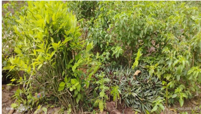
figura 19 huerta de plantas medicinales