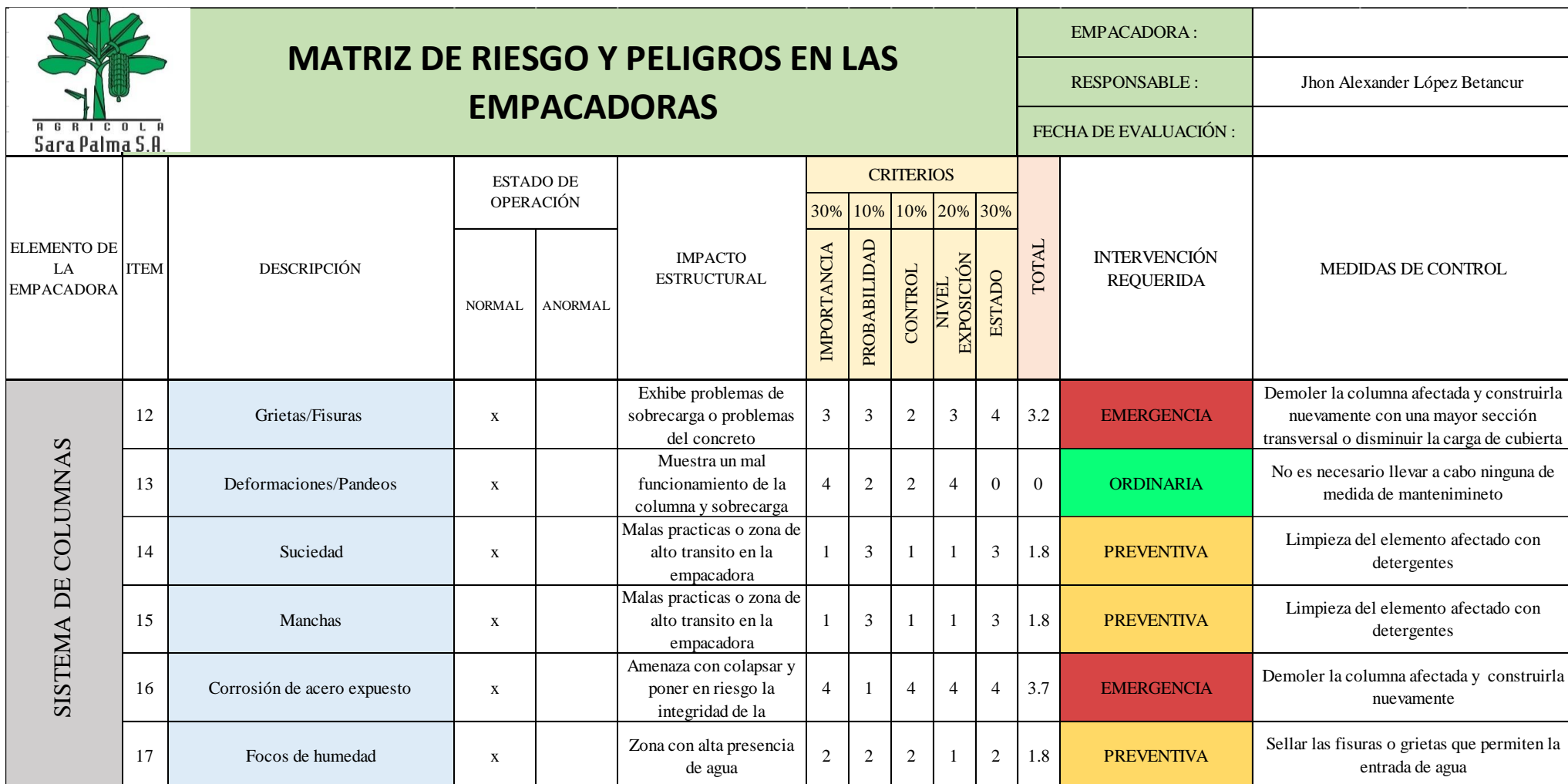
Ilustración 8. Detalle 3 de matriz de riesgo.