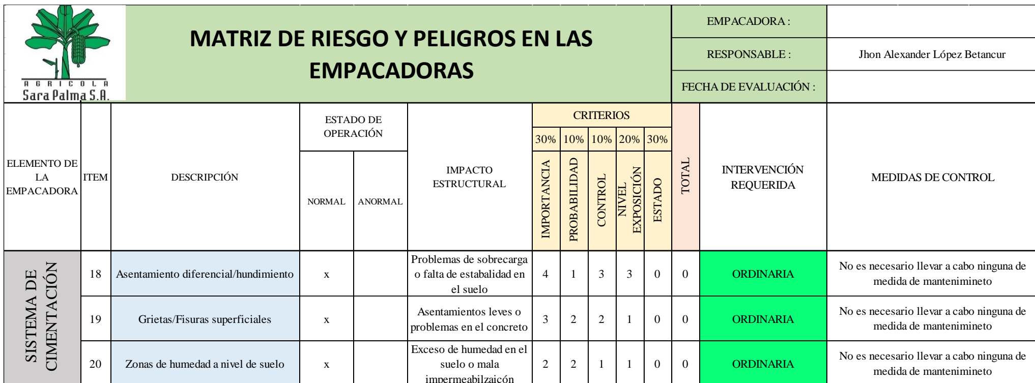
Ilustración 9. Detalle 4 de matriz de riesgo.