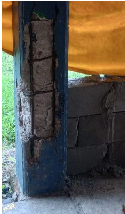
Ilustración 12. Acero expuesto de columna.

Para la recolección de la información en las diferentes fincas se hizo uso de los formatos de chequeo, en total se evaluó el 77% de todas las fincas del grupo SARA PALMA y por cada finca visitada se hizo la revisión de los planos existentes para conocer la distribución de la finca previo a la visita. A continuación, se muestra el resultado de uno de estos formatos completamente diligenciado luego de una visita de campo en la Ilustración 15 y algunas de las patologías encontradas en la Ilustración 12 , Ilustración 13 e Ilustración 14 .