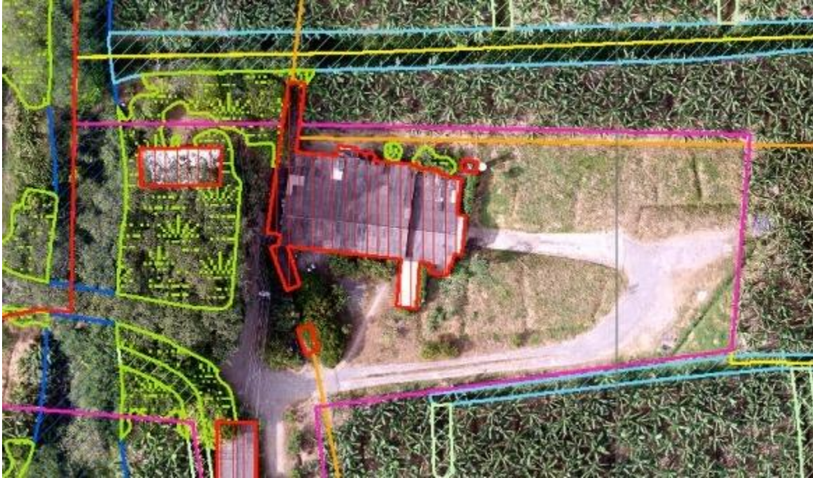
Ilustración 1. Vista en planta de empacadora.