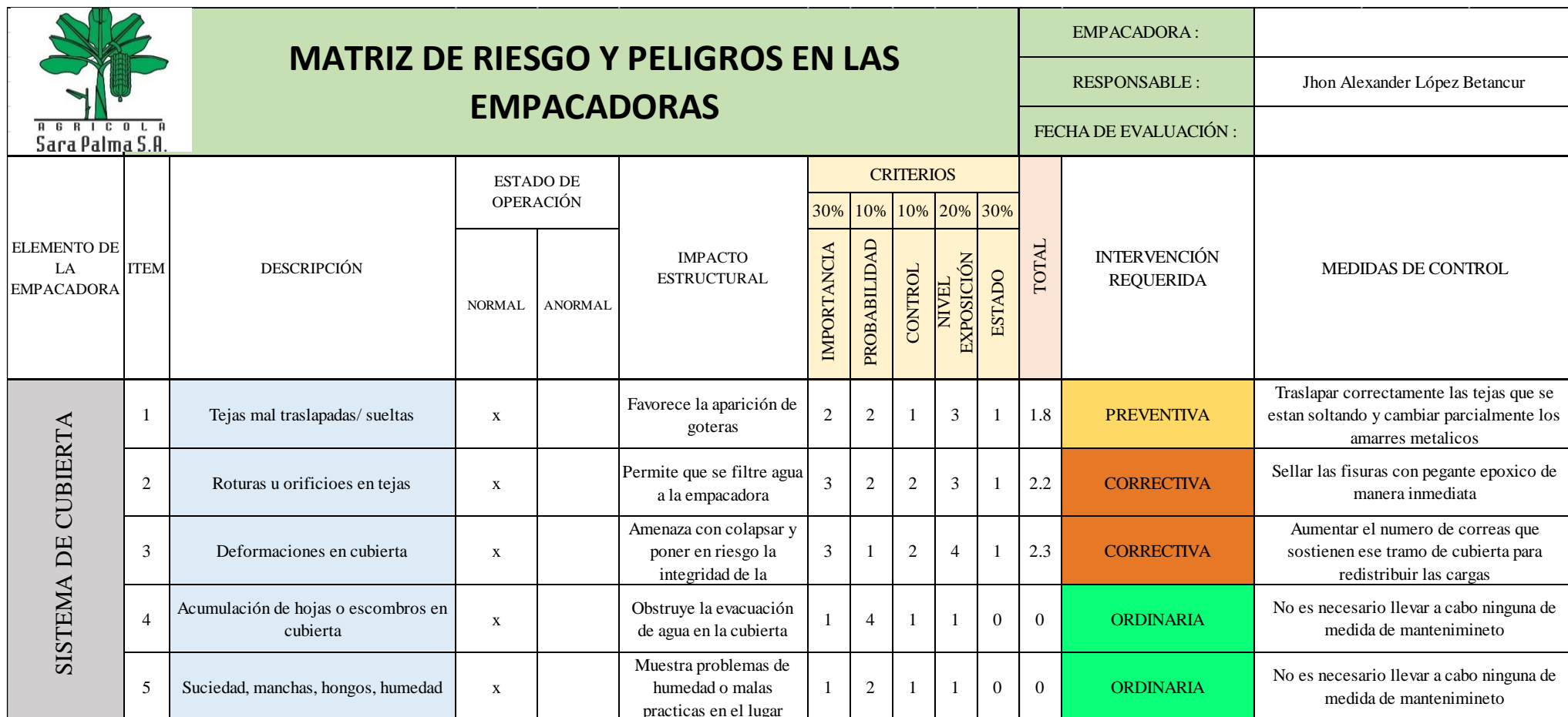
Ilustración 6. Detalle 1 de matriz de riesgo.