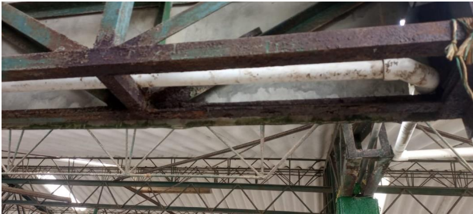
Ilustración 14. Corrosión en cerchas de acero.