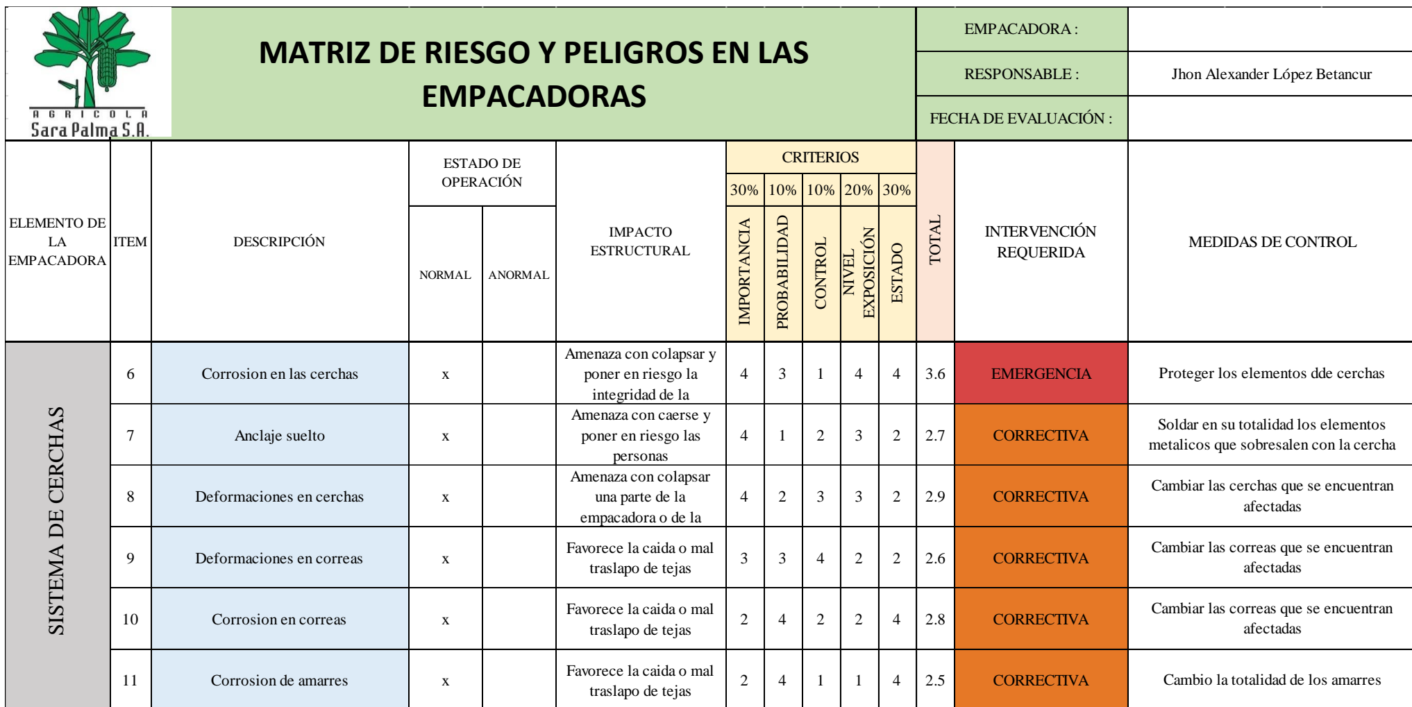
Ilustración 7. Detalle 2 de matriz de riesgo.