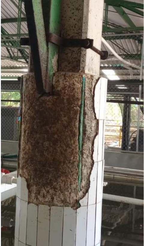
Ilustración 13. Desgaste de columna.