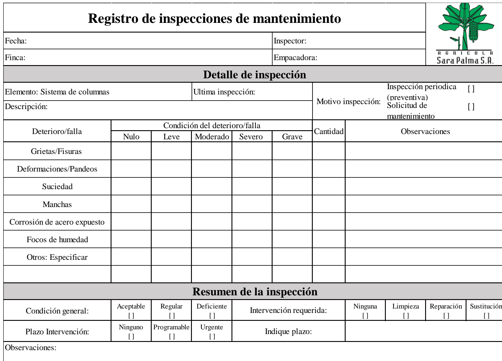
Ilustración 11. Formato de chequeo.