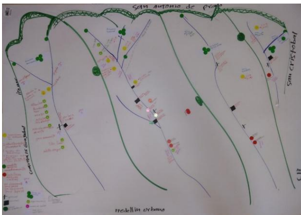
Mapa 1. Representación realizada por el equipo de cartógrafos sociales del sector cultural y comunitario.

La cartografía realizada por los líderes comunitarios, fue una construcción realizada desde algo común: Altavista el territorio que habitan, transitan, perciben y construyen desde su actividad como líderes comunitarios. Para ello, los ocho líderes participantes se distribuyeron en dos equipos de cuatro integrantes y se les pidió que hicieran un mapa según las indicaciones ofrecidas. De ese ejercicio se lograron dos mapas (ver mapa 1 y 2) que fueron presentados por cada uno de los equipos. Luego el equipo en pleno, tuvo la oportunidad de construir un tercer mapa (ver mapa 3) en el cual plantearon a escala corregimental, aquellos problemas o situaciones relevantes que se presentan así como algunas acciones sugeridas para darles solución.