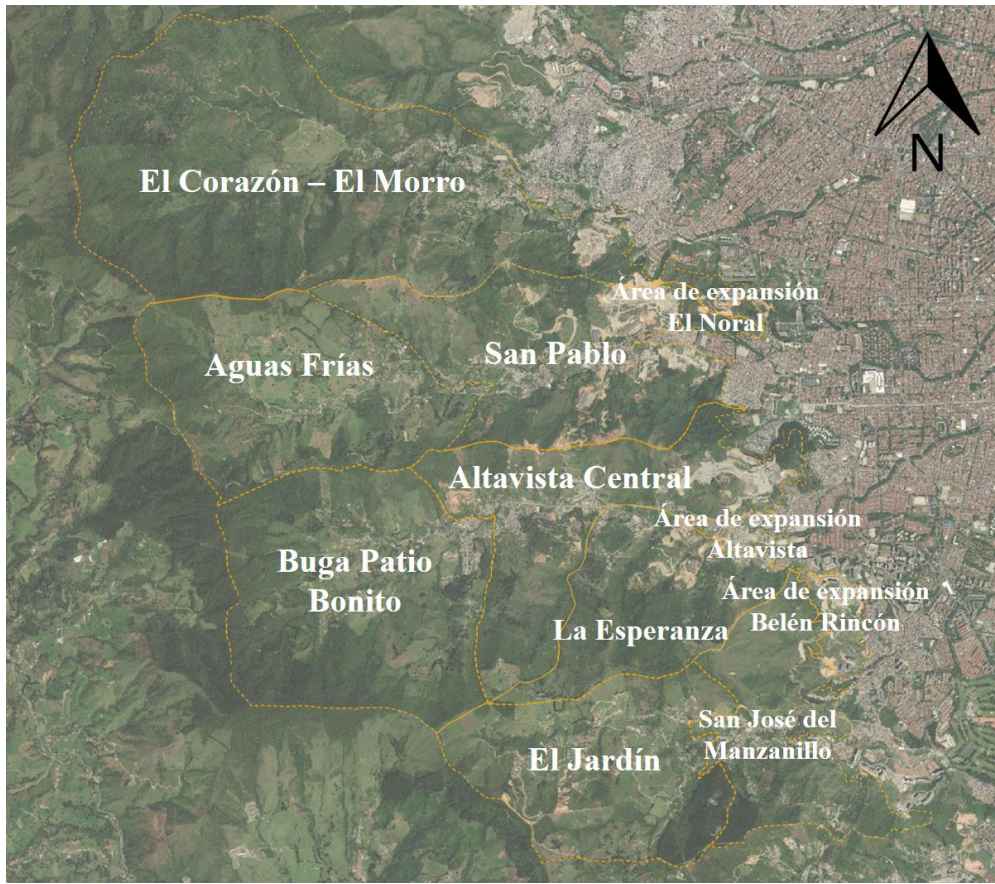
Mapa 1. División del corregimiento Altavista en veredas.

De acuerdo con el Plan de Desarrollo Local del corregimiento, el territorio “hace parte de la vertiente occidental de la cordillera central; posee un relieve quebrado de cañones intra-montañosos que conforman un sistema de valles longitudinales, paralelos y rectilíneos” (Alcaldía de Medellín, 2015, p. 28) lo cual explica las fuertes inclinaciones de algunos de los terrenos en los que crece bosque nativo y se presentan intervenciones antrópicas de diversa índole. Además, la topografía irregular y pendiente del corregimiento, permite el desarrollo de determinadas actividades agrícolas, el crecimiento de una amplia y variada fauna y flora, la cual se puede observar al recorrer sus caminos de herradura, parques, corredores verdes, cauces de quebradas, entre otros lugares.