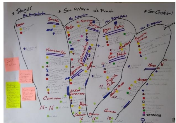
Mapa 2. Representación realizada por el equipo de cartógrafos sociales de la Junta Administradora Local de Altavista.