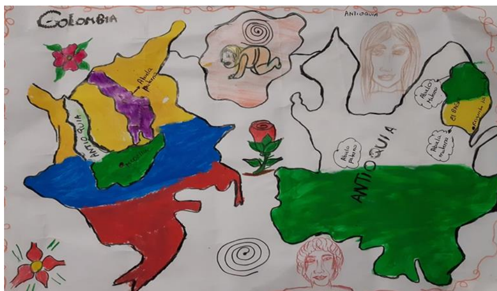
Figura 1. Mapa de Colombia y Antioquia con representación del municipio del Bage Antioquia.