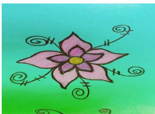
Figura 8. Representación de la flor del Chin Pin.

“(Mendoza, 2021) nuestros ancestros como lo decía mi papá en los años 40, 50, 60, cuidaban los ojos de agua porque era su sustento de vida, eran sitios sagrados y se encontraban en las quebrada y arroyos, con esas aguas curaban los enfermos y la cargaban en tinajeras de barro esto era una tradición de nuestros mayores con esas aguas sagradas curaban a toda persona enferma y hacían rituales, el que no iba al ritual o se entraba sin permiso se lo llevaba el chin pin que era una mata que tenía unas flores rosadas grandes y se encontraba como protectora en las orillas o dentro de los ojos de agua y el que se metía solito por ese sitio se perdía en la montaña, la persona que se lo llevaba el chin pin comenzaba a tener escalofríos fiebre y mucho vomito hasta que la persona moría pero los médicos tradicionales le hacían rezos y muchos se salvaban e iban a pedir perdón pero otros no contaban con suerte, por eso se cuidaba el medio ambiente, las aguas y también para la pesca para poder tener abundancia de peces para la alimentación por eso nuestros ancestros la cuidaban.”