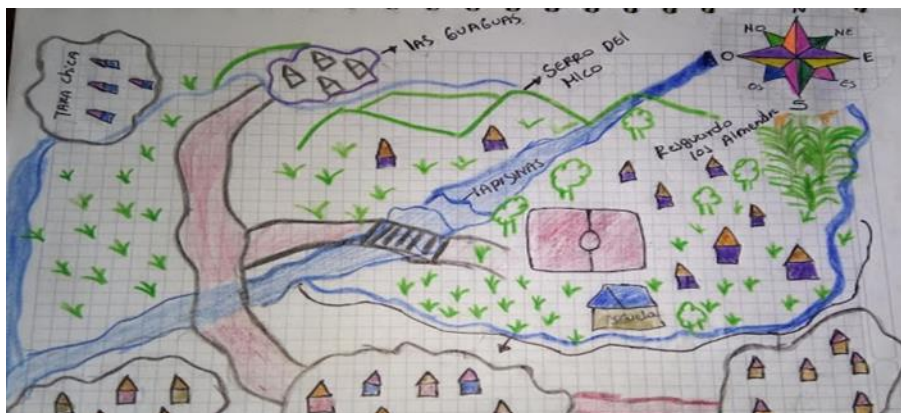
Figura 5. Mapa realizado por los niños y niñas del resguardo los Almendros durante el encuentro local.