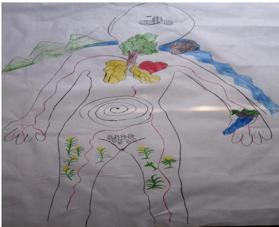
Figura 9. Representación de los conceptos de mi investigación.