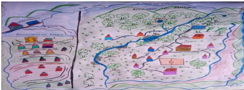
Figura 2. Cartografía del resguardo los Almendros con el municipio del Bagre, creación propia de las actividades de la pedagogía de la Madre Tierra, curso Perspectiva Intercultural