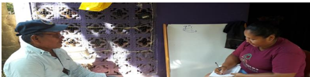
Figura 7. Escucha de las historias del agua del pueblo Zenú.

Entrevista realizada con un mayor del resguardo los Almendros, tuvo como propósito recopilar las historias del agua del pueblo Zenú desde la ancestralidad que dan significado al origen del agua. En estas entrevistas desde mi sentir tuvo mucha importancia al descubrir tanta espiritualidad perdida, desde la palabra sentí el recorrido del camino de mis ancestros recordando desde el vientre de mi madre.