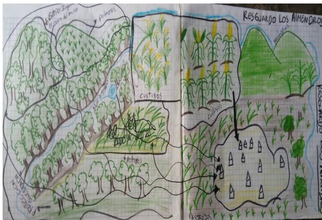
Figura 6. Mapa realizado por los niños y niñas durante la actividad sobre el suelo de nuestro territorio.

Se realizó con los niños y niñas en el resguardo los Almendros, tuvo como objetivo la importancia de los suelos, recordando desde la historia de origen hasta la actualidad, de como por la tumba y la quema de los árboles para los cultivos se ha maltrato a nuestros suelos y esto ha afectado la disminución de los nacederos de agua de la bocatoma, se logró aprendizajes sobre la importancia que tiene nuestro territorio. Esta actividad por medio de una cartelera mostrando un antes y un después, luego cada uno (a) mostraron las partes deterioradas del territorio, y se desarrolló de forma recreativa.