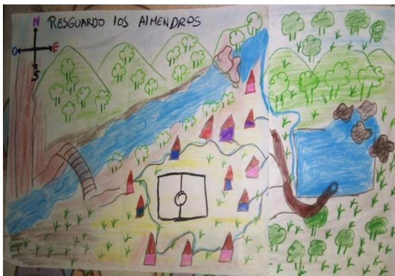
Figura 4. Realización de la actividad conservación de nacimientos de agua. Cartelera realizada por los niños, niñas.

Esta actividad se realizó con los niños niñas del resguardo los Almendro, tuvo como objetivo generar la importancia de los nacimientos de agua, que se encuentran en el territorio ya que de ahí proviene nuestra bocatoma, se desarrollaron actividades por medio de dibujos para colorear que dieran cuenta a la valoración cuidar, de esta forma se llegó a enseñanzas y reflexiones sobre la motivación de conocer más acerca de lo trabajado.