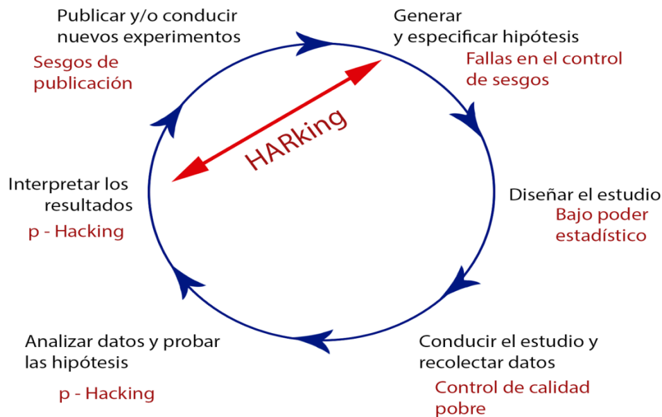
Imagen 1: Amenazas a la ciencia reproducible.

La metaciencia ha permitido establecer, entonces, el estado actual de la práctica científica, tanto en términos de sus prácticas como de los sesgos y amenazas que la afectan: