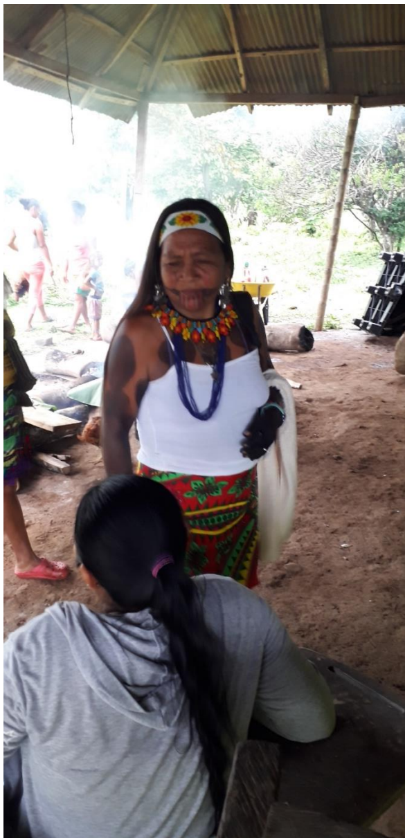
Figura 9. Representación de la modernidad.

El vestido de la comunidad ha venido evolucionando y sufriendo cambios con el pasar de los años, como se ve en la figura 9, se expone la variación que ha presentado la estructura tradicional del vestido de la mujer.