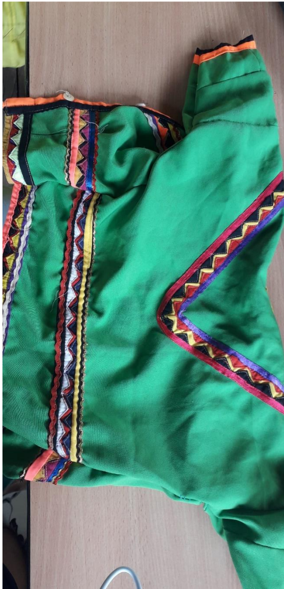
Figura 11. Blusas Embera