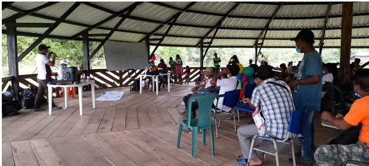
Figura 14. Reunión en casa comunitaria.

Se realizó el encuentro para dialogar sobre las oportunidades y el espacio que tienen las mujeres dentro de la comunidad.