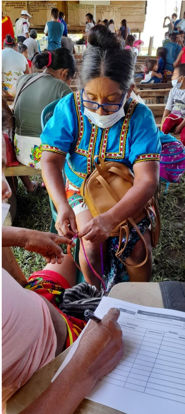
Figura 13. Demostración de tejido.

Sabia portando el vestido tradicional es tejedora y sembradora, una demostración de su tejido (Figura 13).