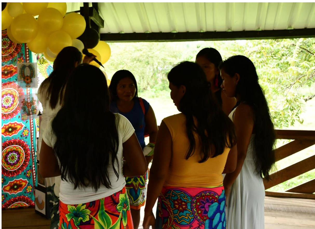
Figura 15. Drama de emociones.