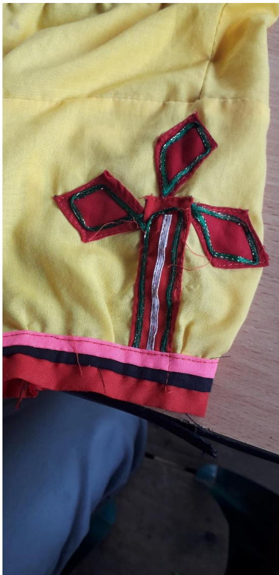
Figura 10. Blusas Embera.

VOCES DE EMPODERAMIENTO: EL VESTIDO DE LAS MUJERES EMBERA WERA representa como mujer, está en conexión con la madre tierra, ya que nosotras somos dadoras de vida y así mismo es la tierra y la pinta de las culebras que se consigue en los bosques.