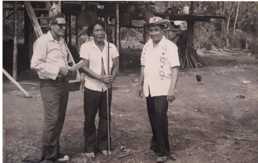
Imagen perteneciente de la comunidad de Citará, tomada por la estudiante (18/11/2019)