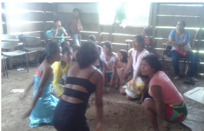
Figura 2. Estudiante de bachillerato y primaria - institución educativa Embera Katio, Citará 2018.

Tomada por la estudiante Prácticas de danzas y clase en el área de artística y sociales (10/06/2018)