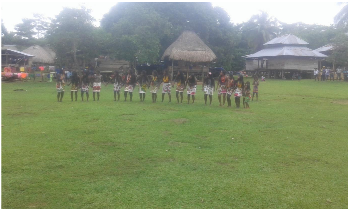
Figura 7. Grupo de danza de la comunidad.