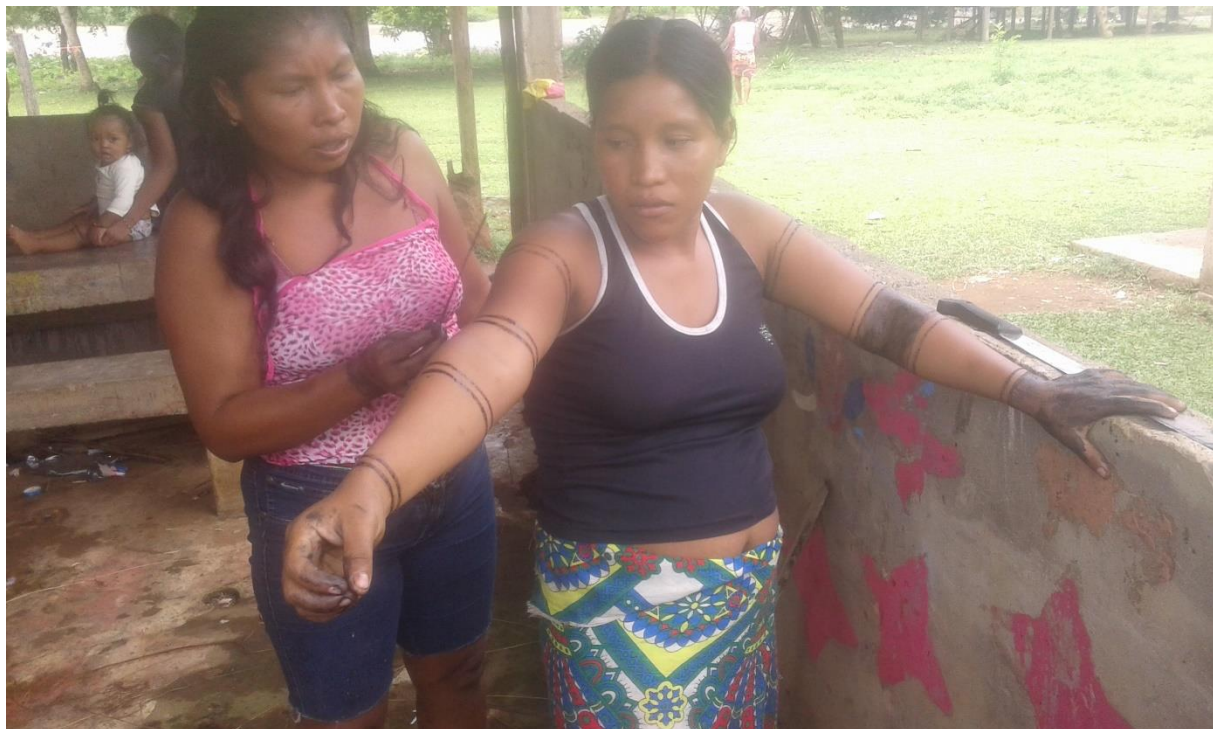
Figura 6. Demostración de figuras representativas para la comunidad.