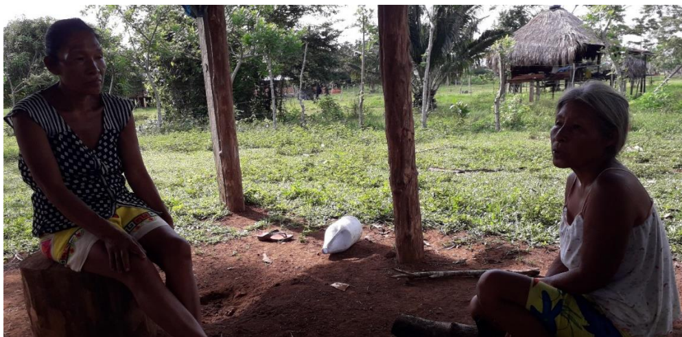
Figura 8. Diálogo con la sabia.

Se realizaron diálogos con las sabias, sobre el encanto del ser mujer y el sentido que tiene para ellas portar el vestido y la apropiación que tiene para las mujeres de la comunidad. La importancia además que les da ser mujeres líderes, compartiendo su sabiduría con los más jóvenes, respecto a las historias de vida (Figura 8).