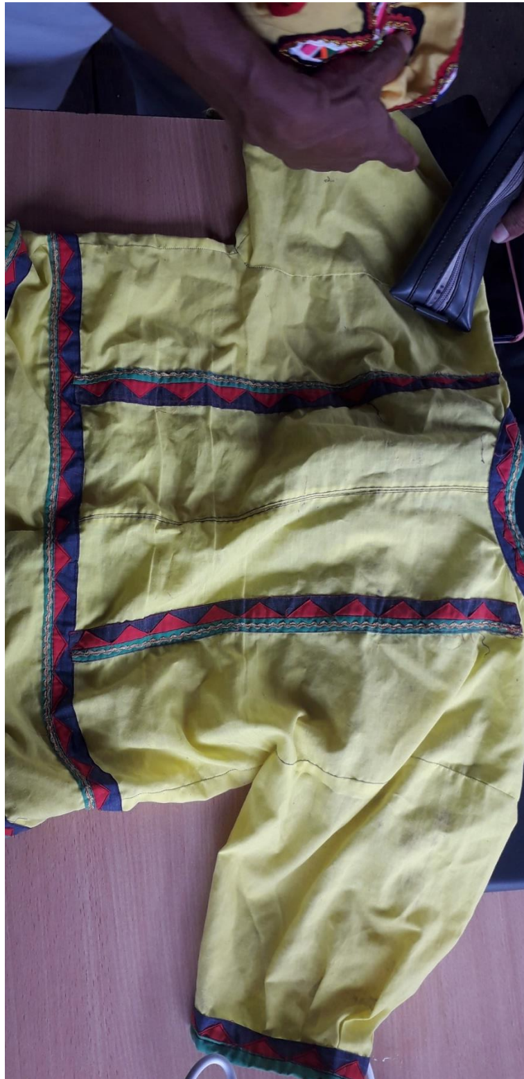
Figura 12. Blusas Embera