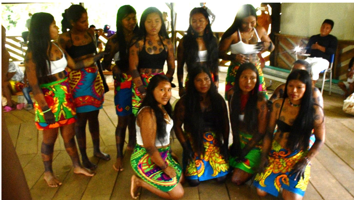
Figura 17. Grupo de mujeres de danza.

Se mostró el grupo de danza del caminar por la siembra.