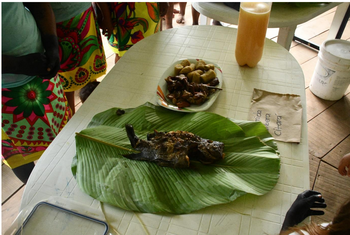
Figura 16. Comidas tradicionales.