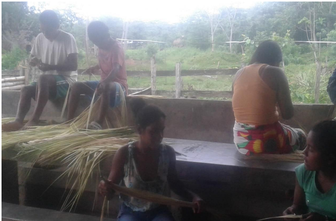
Figura 5. Tejido con iraca.

Se realizó un compartir con las tejedoras, donde se enseña la elaboración de canastos a base de iraca (Figura 5).