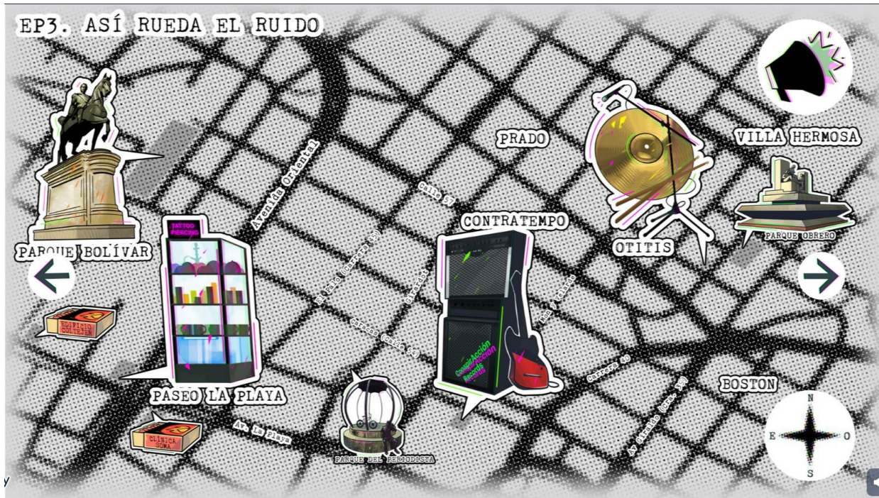
Mapa del centro de Medellín, lugares del episodio 3

Nota. Fuente https://sites.google.com/view/ratas-de-ciudad/inicio?authuser=5 (Diez Góez & Rojas Cortina, 2023)