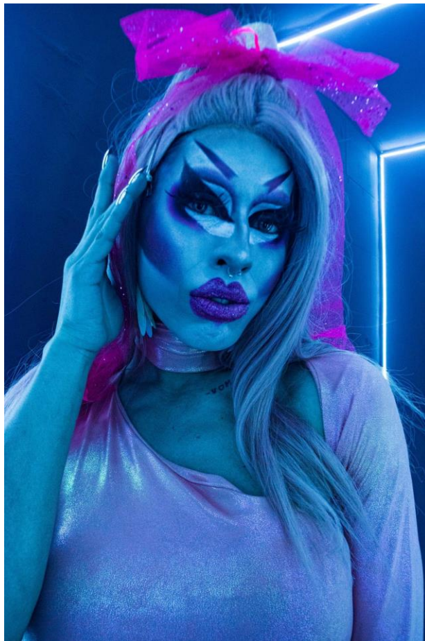
Ilustración 10 Metal Castle- Fotografía tomada por las investigadoras

En las cuatro artistas se ve reflejado este aspecto y sus elementos escópicos o visuales son los que nutren el personaje y recalcan la personalidad o identidad que los artistas deciden darle a sus looks. Metal, por ejemplo, hace uso de elementos como las espumas y la cinta en forma de fajón con la intención de simular un cuerpo mejor formado que las demás participantes, a esto le suma el uso de colores como el fucsia y el plateado para dejar claro en el público la impresión de Barbie de plástico con la que ella se identifica. “Se puso todas sus espumas y pantimedias logrando el cuerpo de muñeca que le pertenece a Metal, unas caderas anchas y unos glúteos grandes que luego adornaría con sus medias de malla color piel con piedritas” (Diario de campo Metal, 17 junio del 2022).