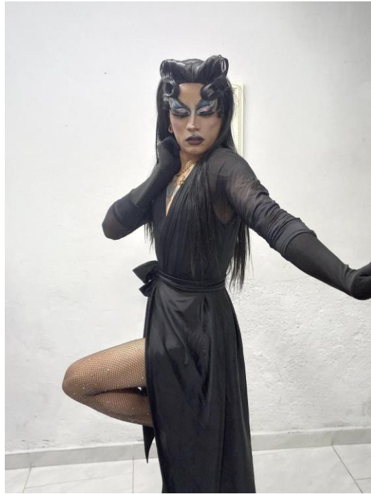
Ilustración 16 La Tina Bomba