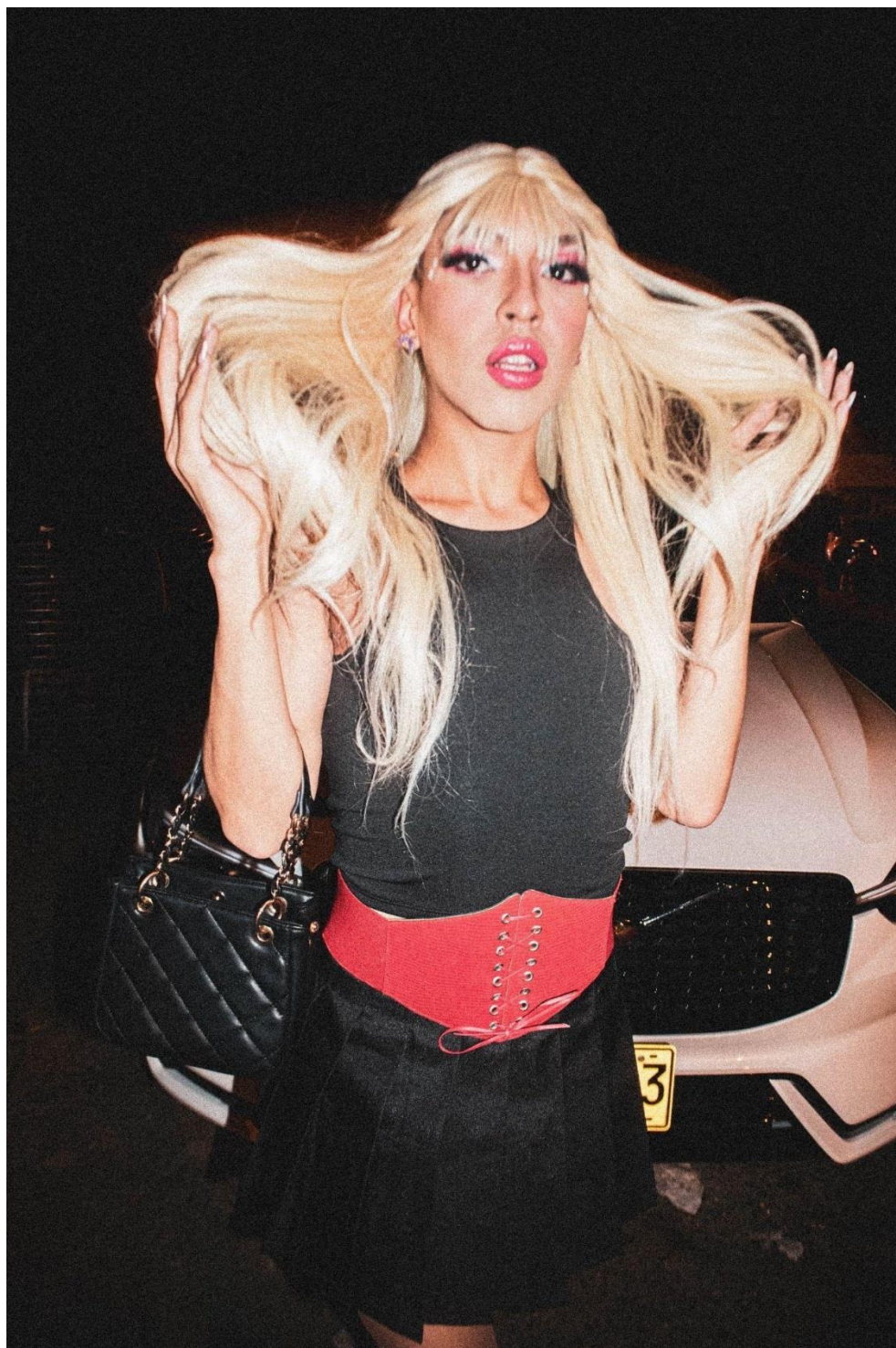
Ilustración 4 Yuyis Love