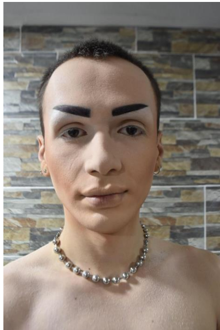
Ilustración 14 El Cuerpo Celeste- Fotografía tomada por las investigadoras