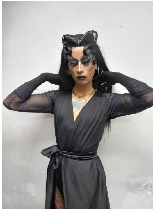
Ilustración 17 La Tina Bomba