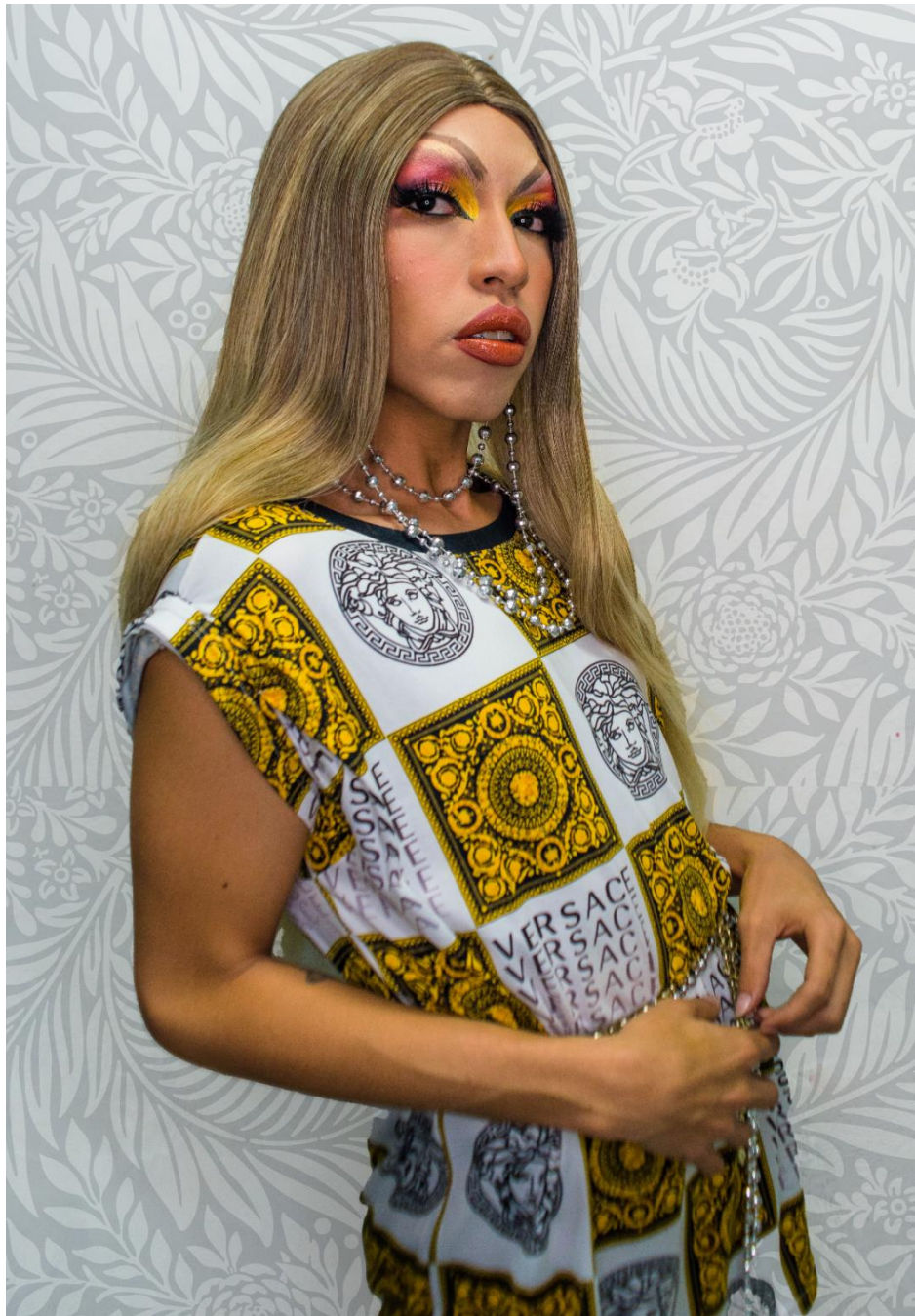
Ilustración 3Yuyis Love