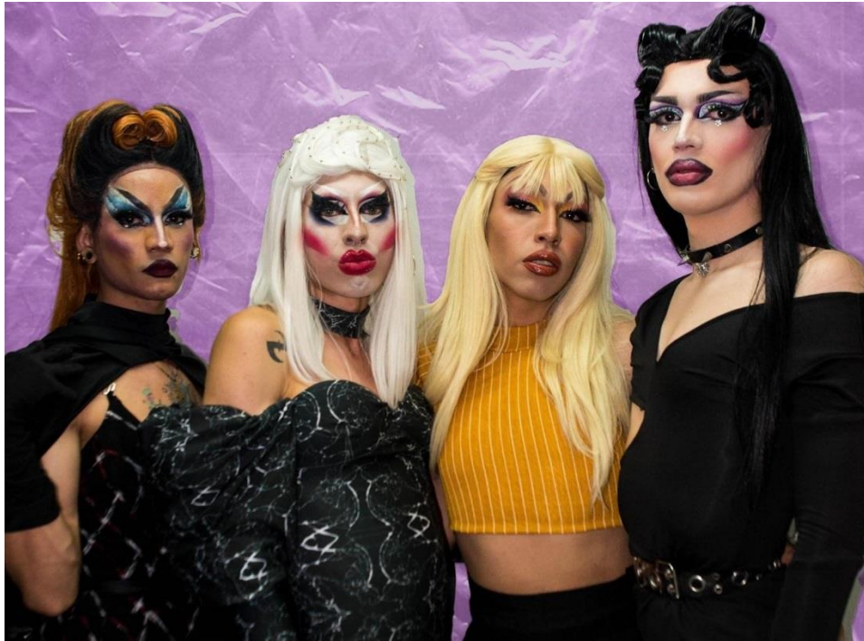
Ilustración 1 Segundo espacio de observación