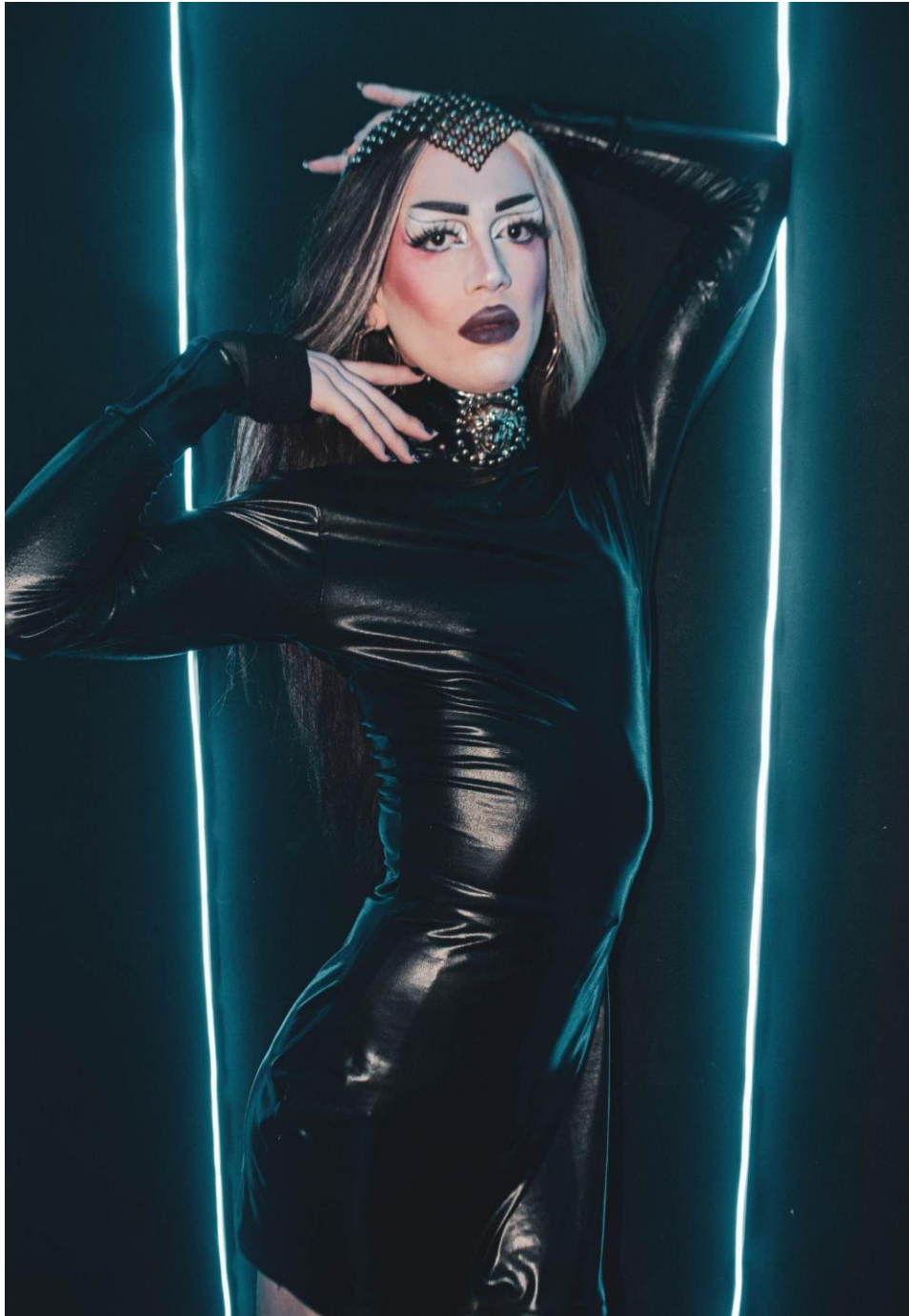
Ilustración 5 El cuerpo Celeste