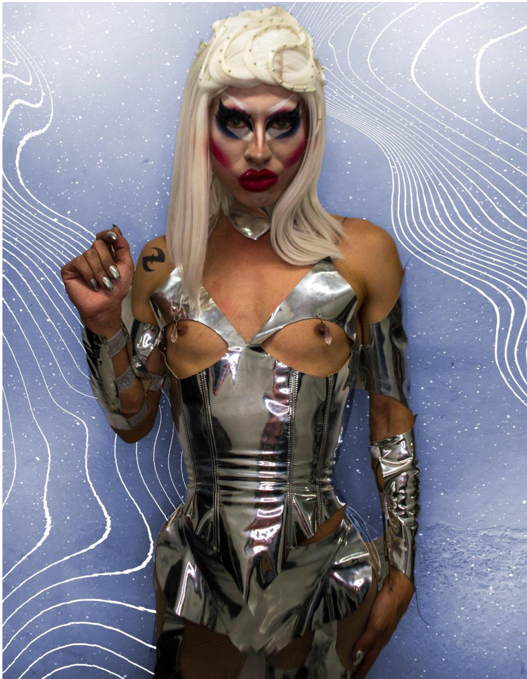
Ilustración 6 Metal Castle