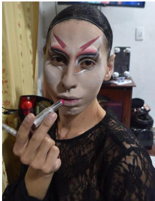
Ilustración 13 Metal Castle