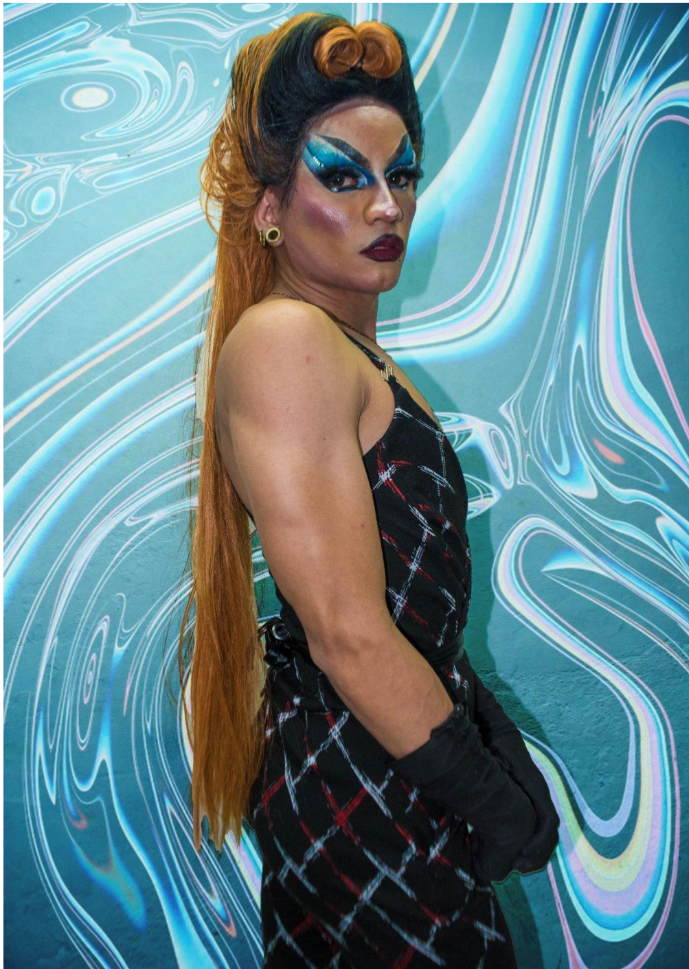
Ilustración 7 La Tina Bomba