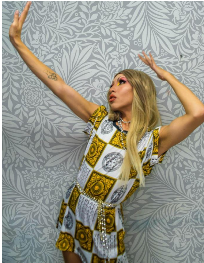
Ilustración 12 Yuyis Love