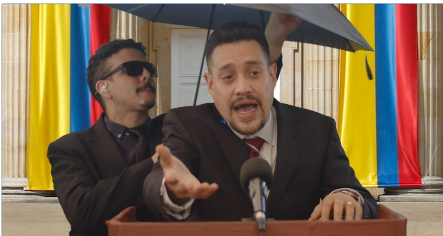
Figura 8. Fotograma.

Comenzaré hablando sobre el proceso de edición y montaje del sketch de cambio climático. Dado que el discurso del político atraviesa la mayor parte del sketch, lo primero que debí hacer fue juntar las tomas del político, de tal forma que su discurso se sintiera fluido y coherente. Esto, acompañado con las acciones y sucesos de cada cambio de clima que también debían tener coherencia con el discurso y no debían verse interrumpidas por los