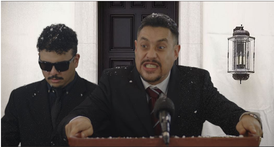
Figura 9. Fotograma.

sencilla de un portón, el cual nos da una sensación de ser un edificio importante, pero no nos da un referente claro de cuál pueda ser.