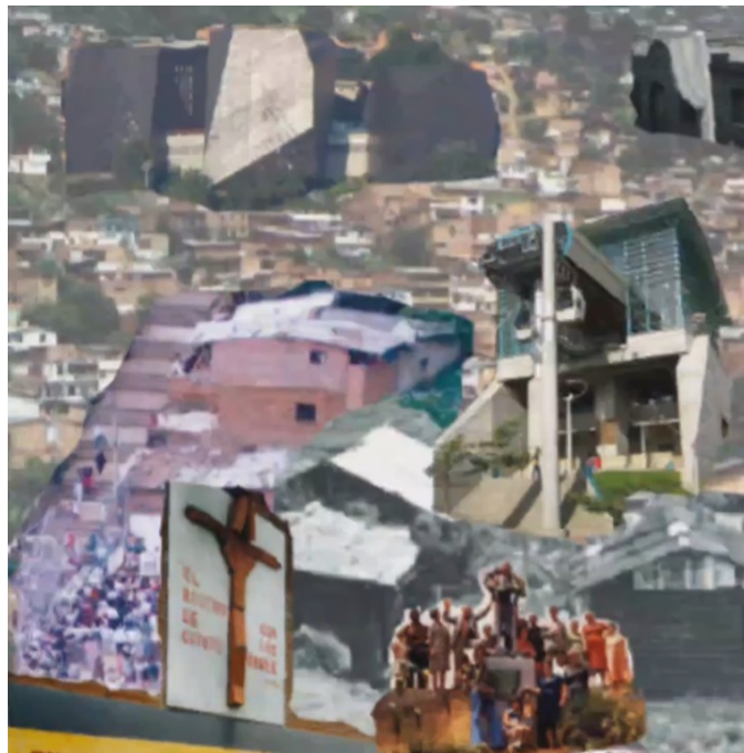
Imagen tomada del sonoviso.