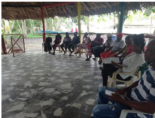
Taller socialización de la guía para el plan etnodesarrollo Puerto Girón. Programa Ritual, año 2022.