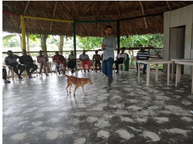
Taller socialización de la guía para el plan etnodesarrollo Puerto Girón. Programa Ritual, año 2022.