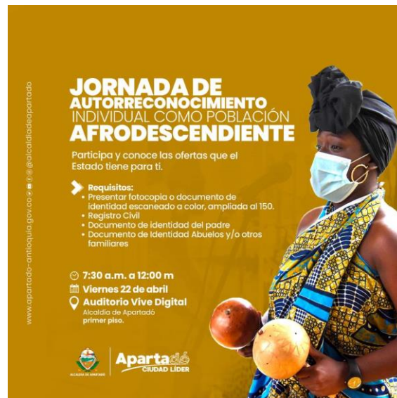
E-Card Jornada de autorreconocimiento. Alcaldía de Apartadó. (2022). [ Pagina de Facebook] Recuperado 10 de agosto de 2023 de https://m.facebook.com/story.php?story_fbid=pfbid02pYKPzuNhKCPjEJ4qVyDz3joWQ7g wQAxMUwtCsYmF21HVABAkGWSABbCk82dUQa2l&id=1544628472467679&mibexti d=Nif5oz