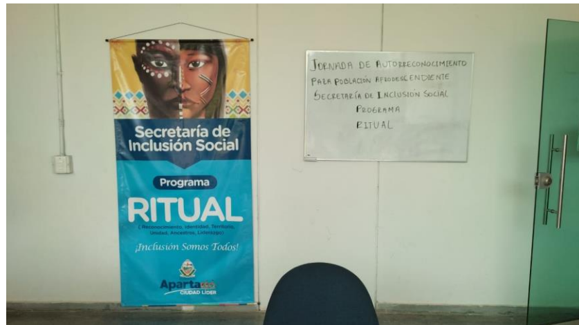
Jornada de autorreconocimiento. Programa Ritual, año 2022.