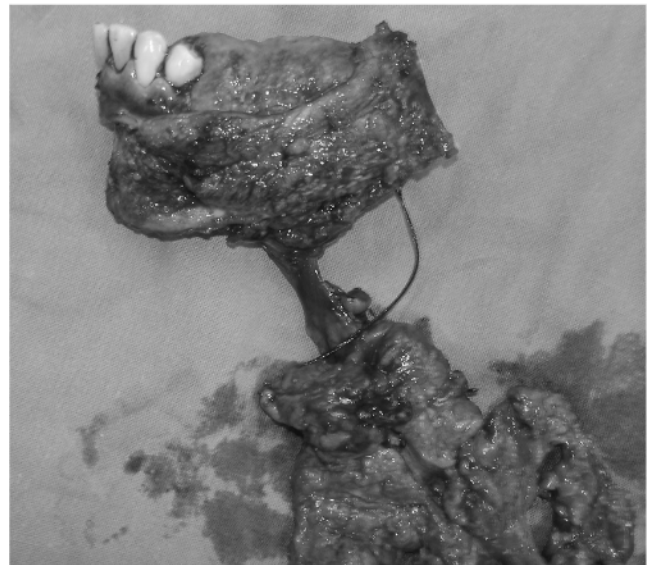
FIGURA 5. Producto de glosomandibulectomía con vaciamiento radical modificado izquierdo en bloque

La técnica de la biopsia de ganglio centinela, que es uno de los avances más significativos de los últimos tiempos, debe utilizarse solo cuando su uso haya demostrado utilidad, como en el cáncer de mama, los melanomas y los tumores de cabeza y cuello 23-25 . Para esto debe disponerse de experiencia en su realización e interpretación y, también, debe planearse con cuidado para evitar cualquier acción que puede menguar su capacidad predictora.