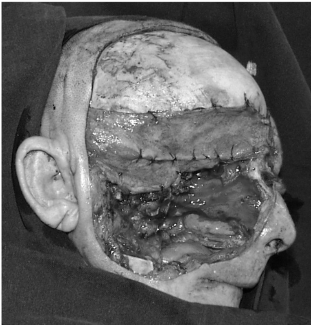
FIGURA 6. Lecho de reconstrucción de una resección de supra-meso-infraestructura ampliada a la mandíbula, que en ausencia de reconstrucción microquirúrgica inmediata, desmejoran en grado sumo la calidad de vida del paciente.