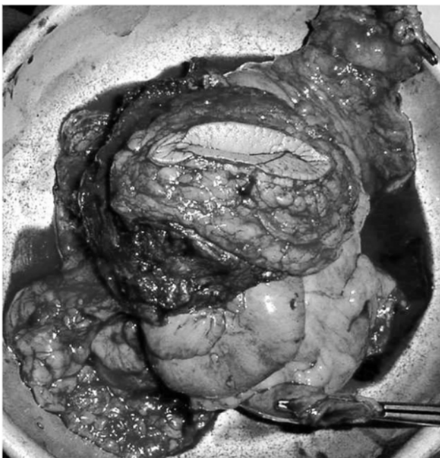
Figura 4. Recurrencia de tumor de colon sobre cicatriz de colostomía y resección tridimensional que incluye la pared abdominal.

Corolario 1. El tumor debe ser resecado en bloque.