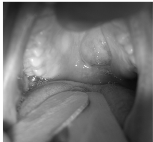
Figura 2. Tumor de paladar duro accesible a biopsia por incisión bajo anestesia local

El método de estadificación clínico más común es el del American Joint Committee on Cancer (AJCC) , conocido como TNM 6 , aunque no es el único existente. La T se refiere al tamaño y la extensión del tumor primario, la N, al compromiso ganglionar, y la M, a