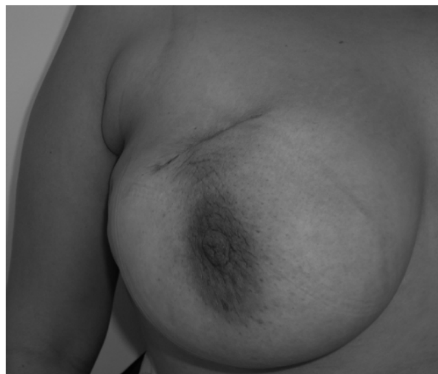
FIGURA 1. Cáncer de mama derecha con una previa biopsia por incisión en localización inadecuada

Si el resultado de la biopsia no corresponde con la sospecha clínica, se deben intentar nuevas biopsias más