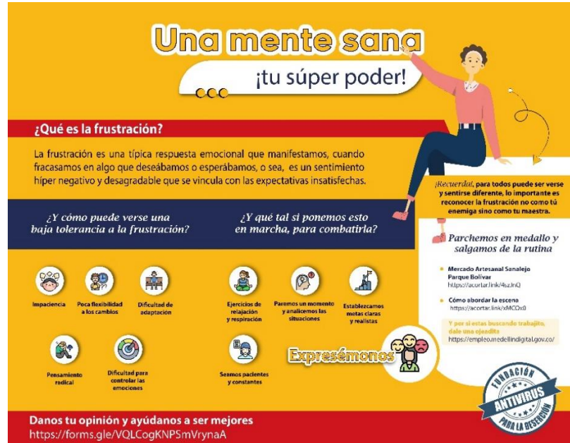
Figura 4 Boletín La frustración

Nota: boletín programado para difundirse en el mes de abril del presente año, acompañado de estos enlaces: Mercado Artesanal Sanalejo Parque Bolívar https://acortar.link/4szJnQ , Cómo abordar la escena https://acortar.link/xMCOx0 , Y por si estas buscando trabajito, dale una ojeadita https://empleo.medellindigital.gov.co/ , Danos tu opinión y ayúdanos a ser mejores https://forms.gle/hpq2B5ts22CK76Y66