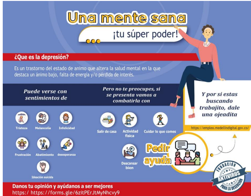
Figura 3 Boletín La depresión

Nota: boletín difundido el 07 de marzo de 2023, acompañado de estos enlaces: Pulp movies cineclub primera temporada 2023 : https://acortar.link/Aev9I0 , Clases de Yoga en el Jardín, Botánico: https://acortar.link/ESQLum , Y por si estas buscando trabajito, dale una ojeadita https://empleo.medellindigital.gov.co/ , Danos tu opinión y ayúdanos a ser mejores https://forms.gle/1QQuGi2TzY6bWSKA9