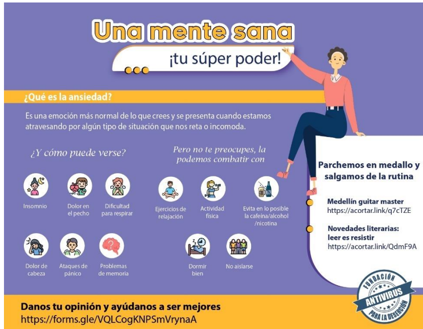
Figura 2 Boletín La ansiedad

Nota: boletín difundido el 15 de febrero de 2023, acompañado de estos enlaces: Medellín guitar master https://acortar.link/q7cTZE , Novedades literarias: leer es resistir https://acortar.link/QdmF9A , Danos tu opinión y ayúdanos a ser mejores https://forms.gle/VQLCogKNPSmVrynaA