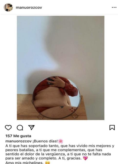
Figura 1. Captura de pantalla post de Manuela.

Con ella intentaron también el uso de fajas, el ejercicio antes de ir al colegio y diferentes medicinas alternativas para bajar de peso.