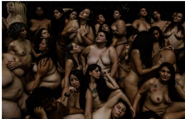
Figura 5. Fotografía Jardín de las delicias .

“Es una comunidad brutal, en la que lo que menos nos importa es ver el cuerpo de la otra” (Palacio, comunicación personal, noviembre de 2023), “El desnudo sigue siendo un tabú, o mostrar el cuerpo y más en un cuerpo grande, en una corporalidad grande sigue siendo tabú, entonces como que te libera o me libera a mí de muchos estereotipos” (Vergel, comunicación personal, noviembre de 2023).