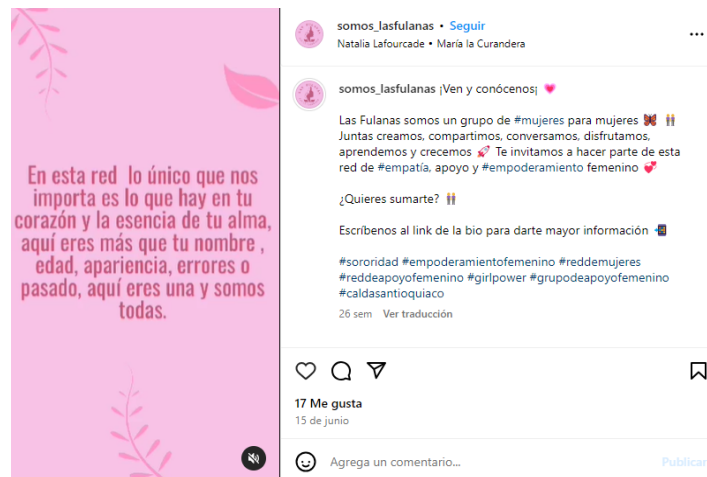
Figura 6. Captura de pantalla reels de Somos Fulanas.

van muchas mujeres, que en definitiva necesitan... tener ese entorno... ese entorno tranquilo y ese entorno en paz” (Caro, comunicación personal, noviembre de 2023).