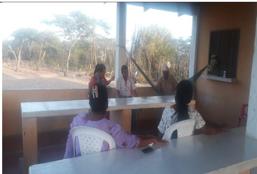
Figura 6: Compartir de la palabra en la comunidad Anuátakat con algunas mujeres.