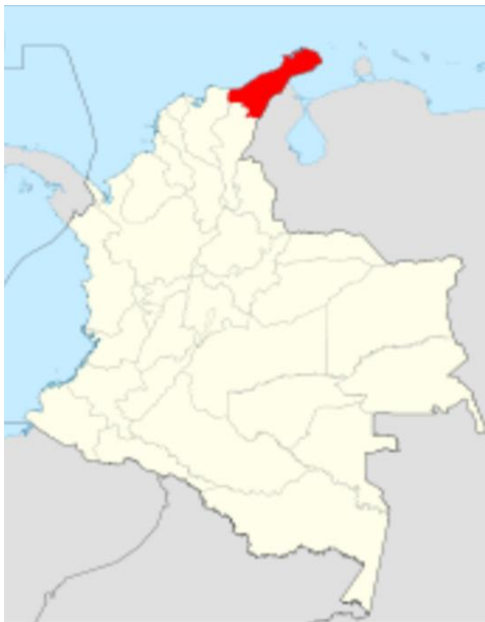
Figura 2: Departamento de la Guajira- Colombia.