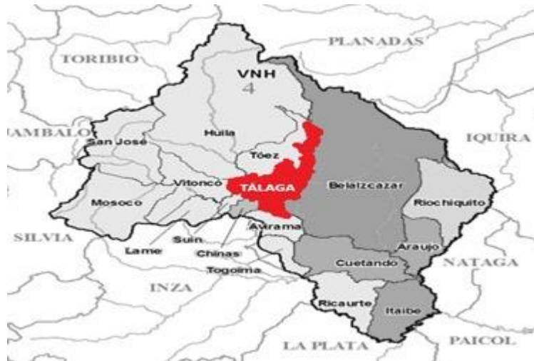
Imagen 3: Mapa ubicación del resguardo de Tálaga y el municipio de Paéz.

nos vamos a centrar en nuestro municipio de Paéz, más concretamente del Resguardo de Tálaga, vereda Taravira.