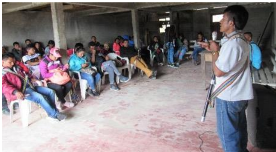
Imagen 12: Comunidad y autoridad.

la tarea es de todos, al hablar de despertar, de cuidar, de recuperar y proteger los nacimientos de los ojos de agua son compromisos que debemos ir aplicando. La concienciación sobre la importancia de cuidar y proteger el territorio en su integridad está en nosotros. Los guardianes y protectores de la madre tierra debemos ser todos y todas.