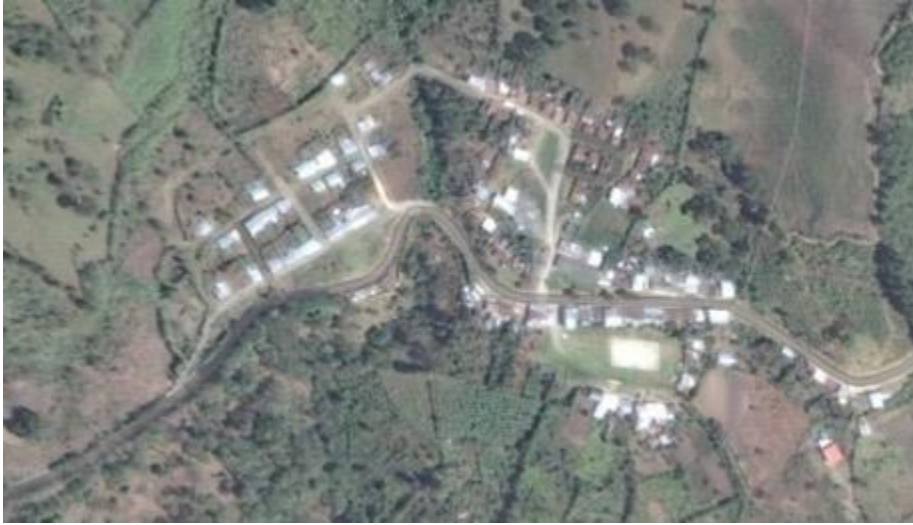
Imagen 4: cartografía vereda Taravira, Resguardo de Tálaga.