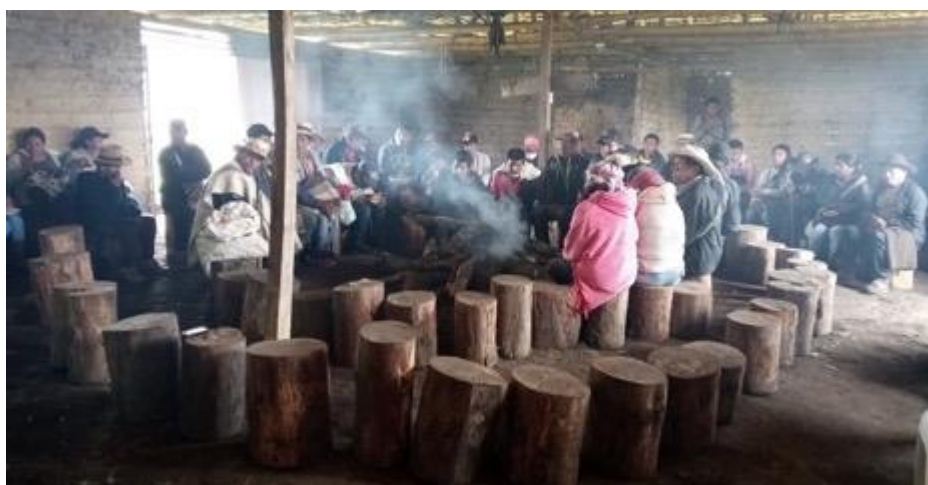
Imagen 13: Tulpa Nasa, vereda Taravira con mayores y mayores.

- Actividad 7. Diálogo de saberes con mayores y mayores del territorio