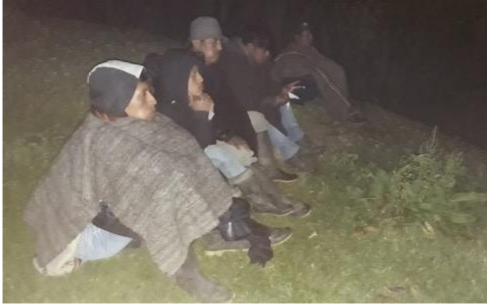
Imagen 5: apertura de camino, año 2018.

- Actividad 1. Armonizaciones para abrir camino sobre el trabajo a realizar hacia el cuidado del agua.