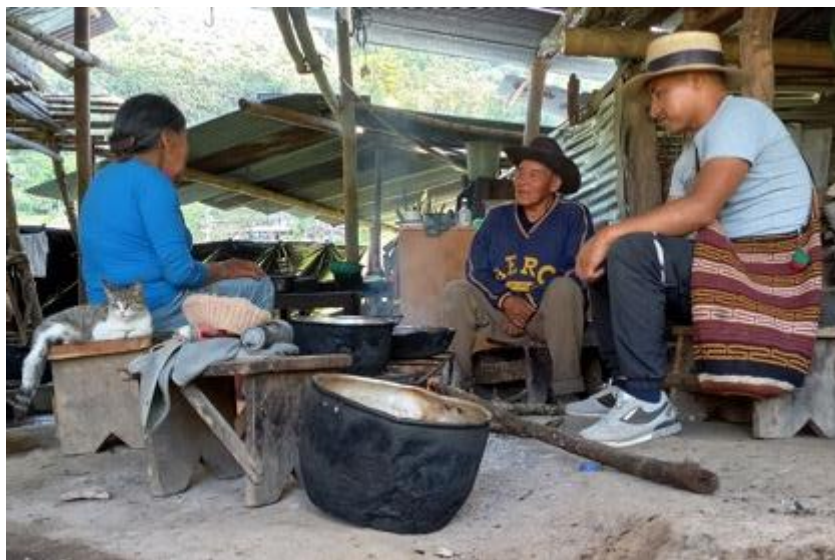
Imagen 7: Conversatorio con el mayor y la mayora, vereda Taravira, año 2019.

En este sentido, la mayora hizo su intervención y mencionó lo siguiente: “sobre los saberes y prácticas ancestrales para el despertar y el cuidado de los ojos de agua hay que seguir vivenciando, este trabajo es indispensable de seguir fortaleciendo; es por eso que hay que seguir reencontrando y visitando el sitio de investigación de la semilla, de modo que tenemos que dar continuidad con el ofrecimiento de plantas medicinales, tenemos que brindar bebidas tradicionales; son prácticas permanentes que hay que hacer. Por otro lado, es indispensable reencontrar espiritualmente y conversar con el espíritu del agua, hay que sentir, hay que dialogar con ella. Paulatinamente el caudal del agua ira brotando, poco a poco aumentará; el espíritu del agua, esta, revivirá. Así nos han indicado los sueños, cosmogónicamente así está orientando los Nehjwe’sx (espíritus mayores – creadores)”. De esta manera se hicieron los aportes y reflexiones de la sabia.