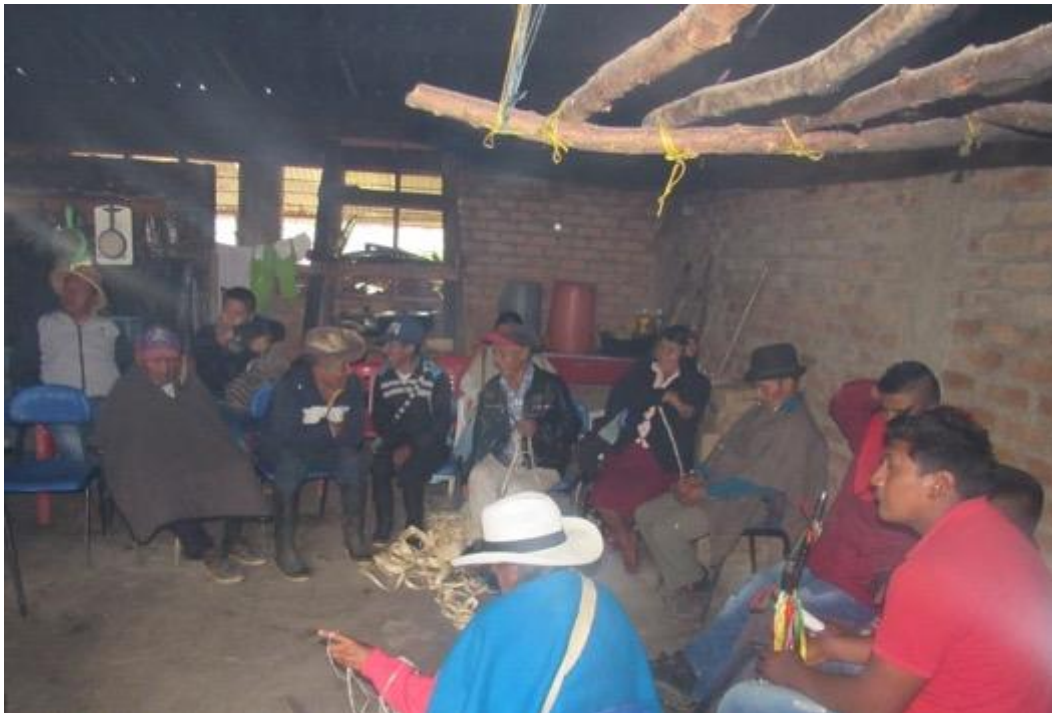
Imagen 14: Socialización de la cosecha, con mayores y mayores de la comunidad. Año 2023.