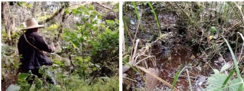
Imagen 8: Sitio de poder Laguna Seca, vereda Taravira, año 2020.