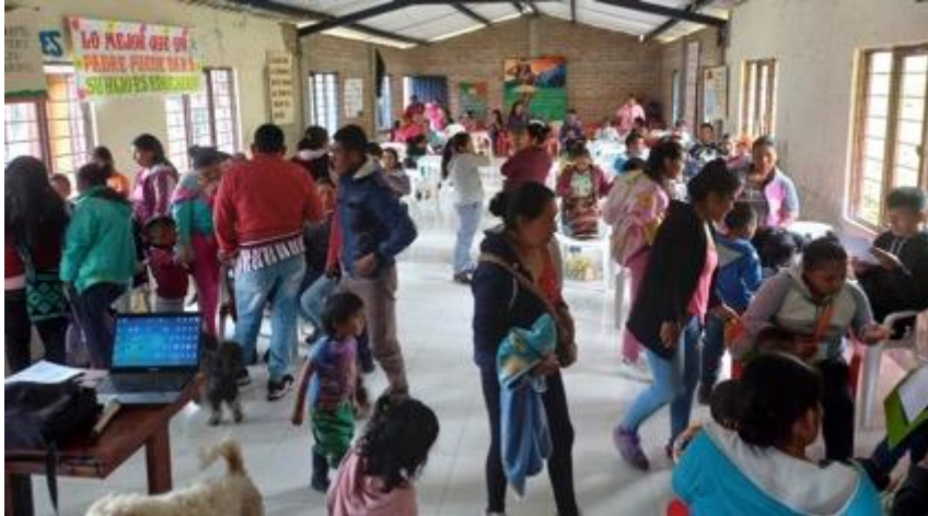
Imagen 15: Socialización cosecha a la comunidad educativa.

Frente al trabajo de socialización de la cosecha de la semilla se tuvo que programar otra fecha con la comunidad y con la autoridad. En este encuentro se hizo el mismo ejercicio de socialización tal cual como se dio a conocer a los sabios y sabias; haciendo mención sobre la contextualización del proceso de investigación de la semilla, luego dando a conocer el objetivo del proyecto investigativo y al mismo tiempo los avances alcanzados frente al trabajo de la semilla.