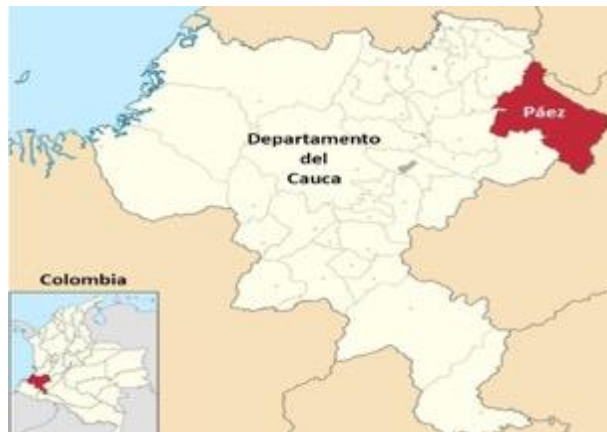
Imagen 2: Ubicación del municipio de Paéz en el Cauca y en Colombia.