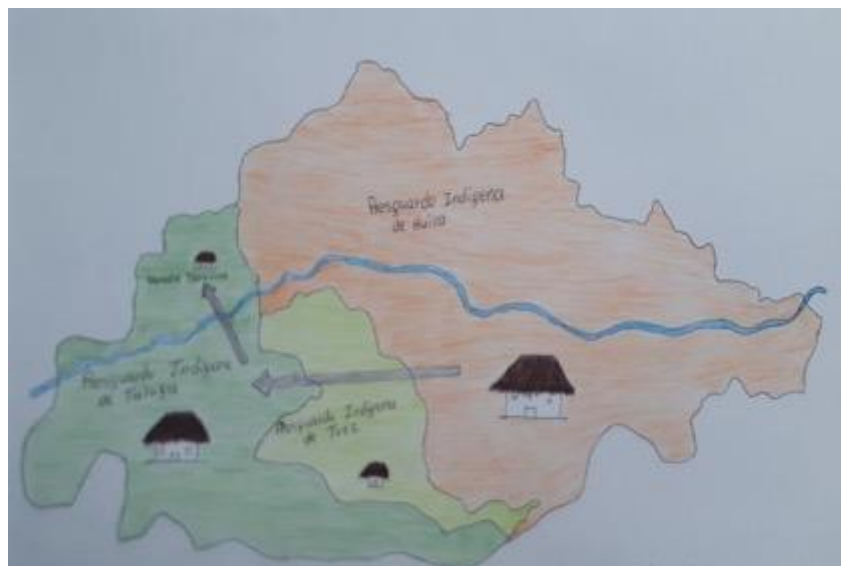
Imagen 1: Mapa del vientre de mis padres

A continuación, se presenta un mapa de las historias de vientre de mi familia: