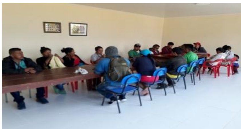
Imagen 9: Docentes de la escuela vereda Taravira y representantes de asociación de padres de familia. año 2020

- Actividad 4. Encuentro con docentes de la comunidad para buscar estrategias sobre el cuidado del agua.