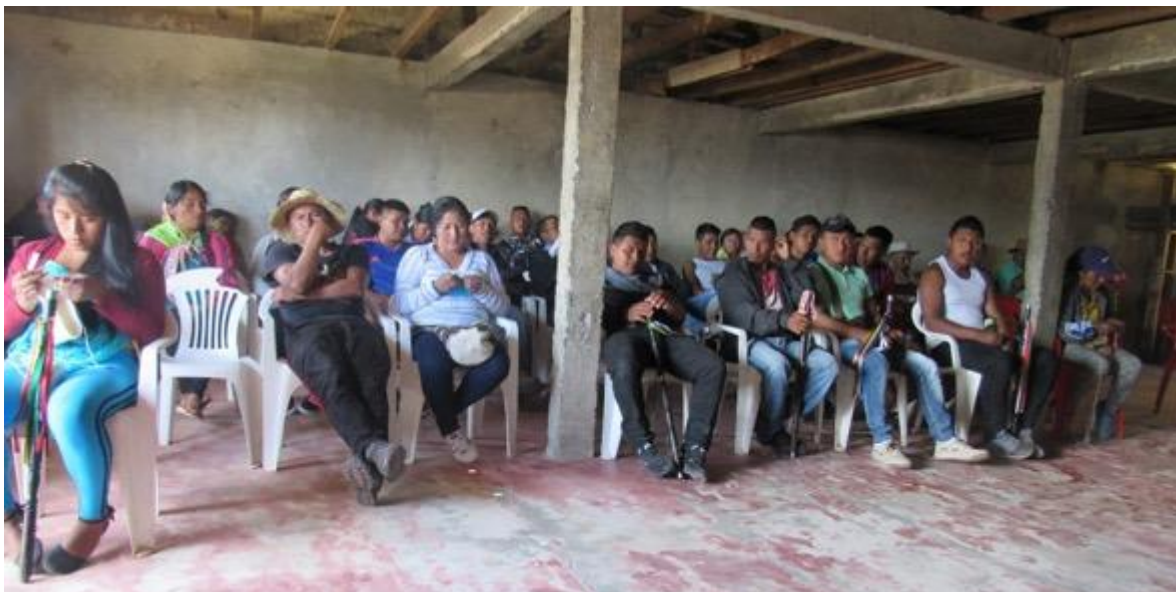
Imagen 11: Comunidad y autoridad, casa cabildo de Taravira. año 2021