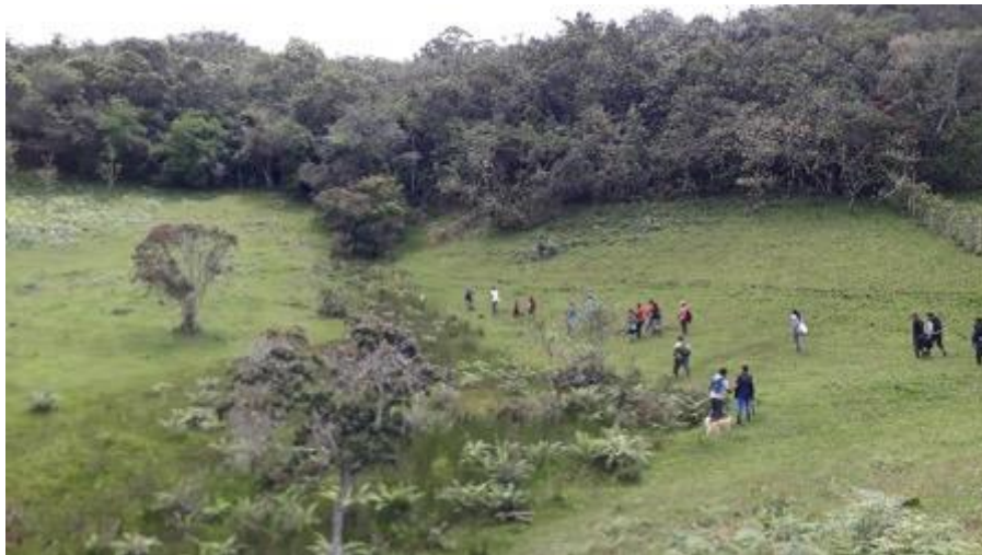
Imagen 10: Recorrido territorial con mayores, mayoras y comunidad.