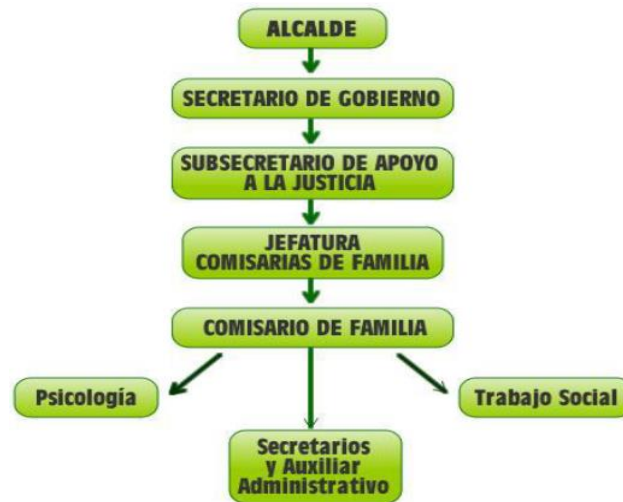
Organigrama Comisarías de Familia de Medellín