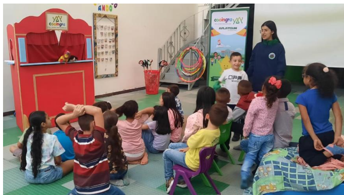
Encuentro Jugando Ando en Cooingra