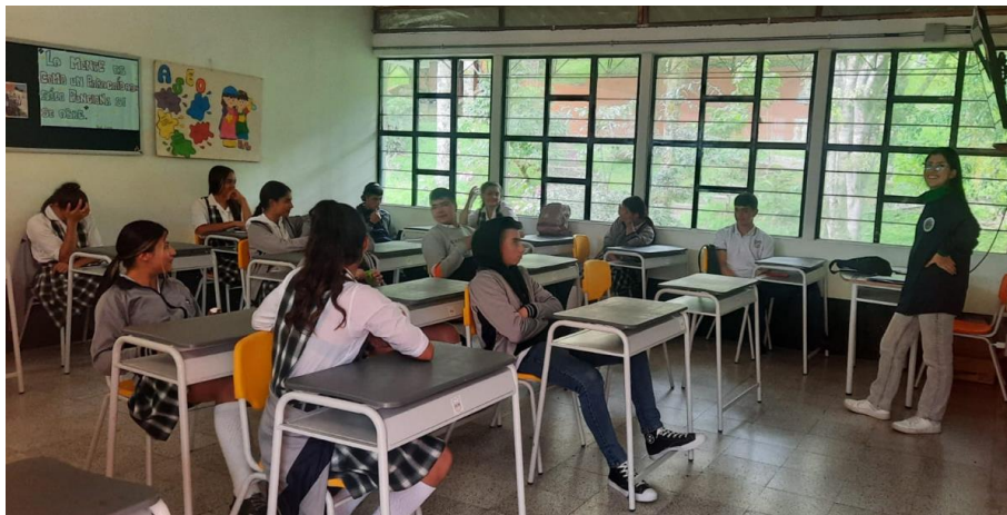
Encuentro Bachillerato Campesino, décimo grado