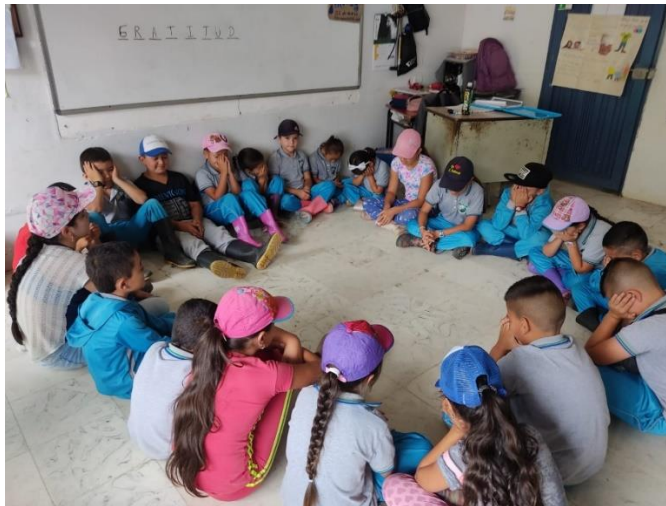
Encuentro Escuela La Cascada

También se reconoce el proceso con los niños y las niñas de Cooingra, donde se desarrolla la estrategia “Jugando ando” los días sábados, que se consolidó como un espacio formativo donde ellos y ellas aprenden a través del juego.