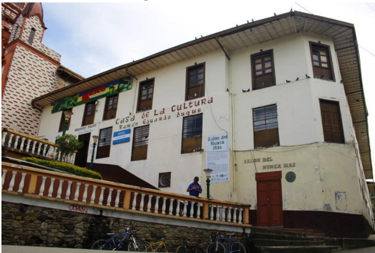
Casa de la Cultura del Municipio de Granada