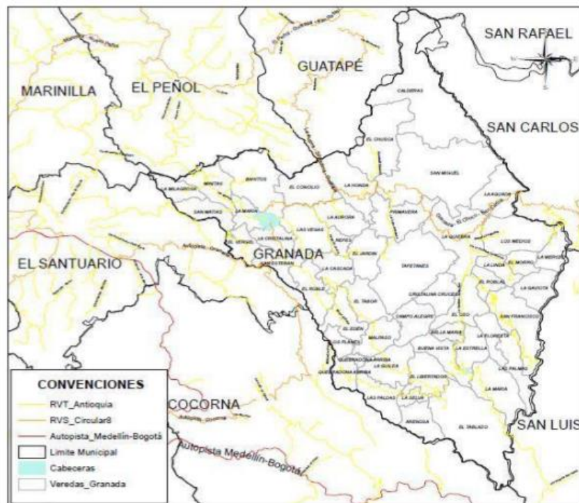
Figura 2 Ubicación geográfica del municipio

Nota. Fuente: Plan de Desarrollo Municipal 2020-2023 “Unidos por una Granada mejor”.