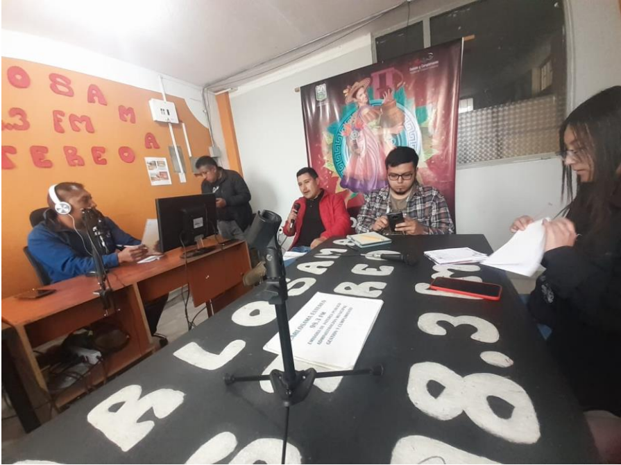
Figura 11 Programa radial