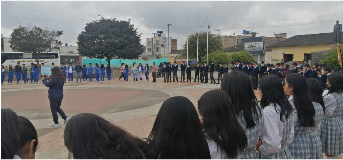
Encuentro con Institución Educativa Indígena