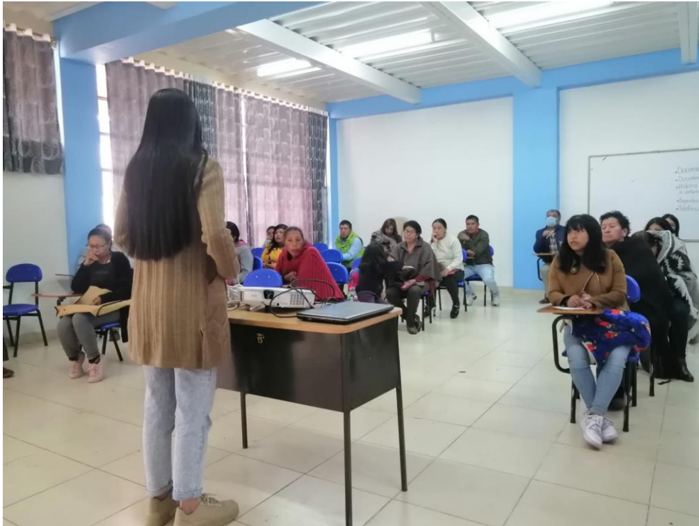
Encuentro con padres y madres de familia