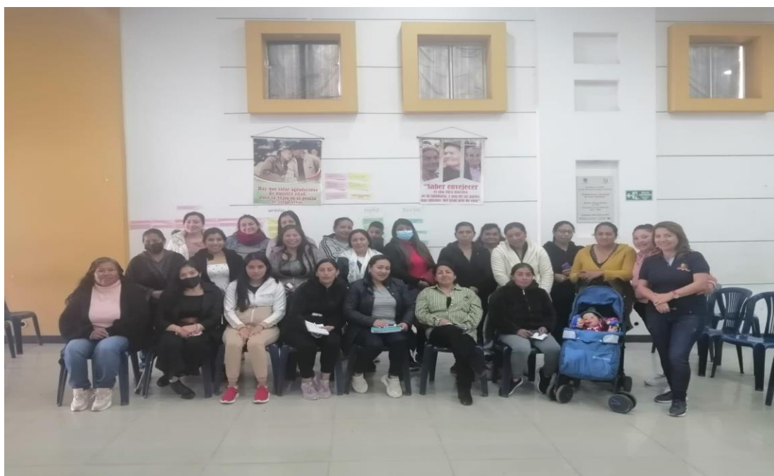
Encuentro Mesa de Participación de la Mujer