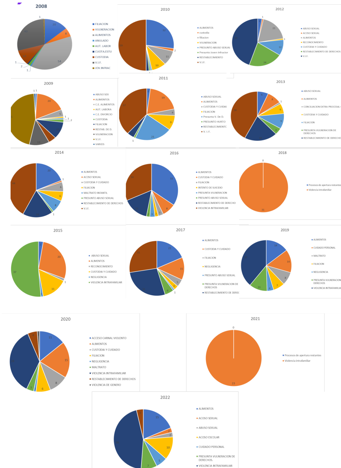
Figura 1 Revisión base de datos Comisaría de Familia