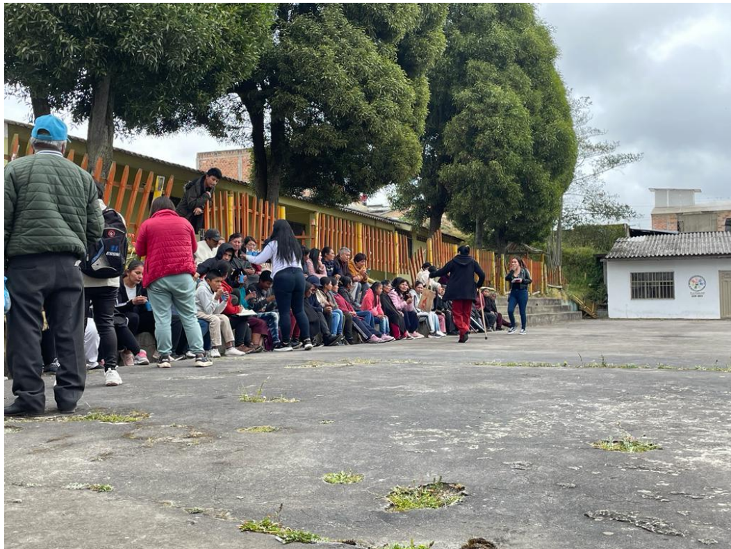
Encuentro con padres, madres y estudiantes de la parcialidad de Macas