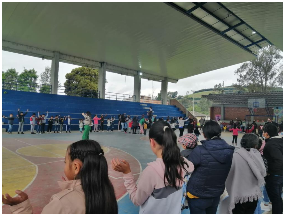
Encuentro con Niños y niñas del Resguardo de Carlosama