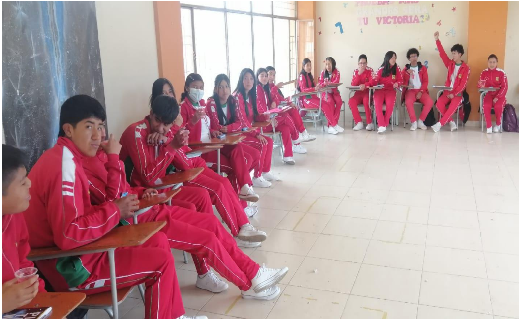
Encuentro con estudiantes Institución Educativa