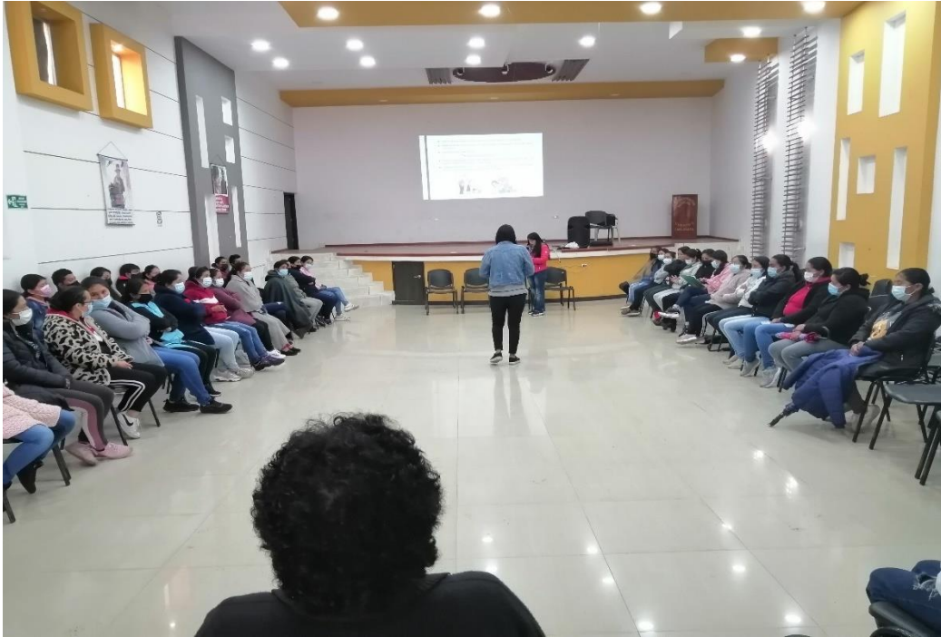
Encuentro con padres Institución Educativa