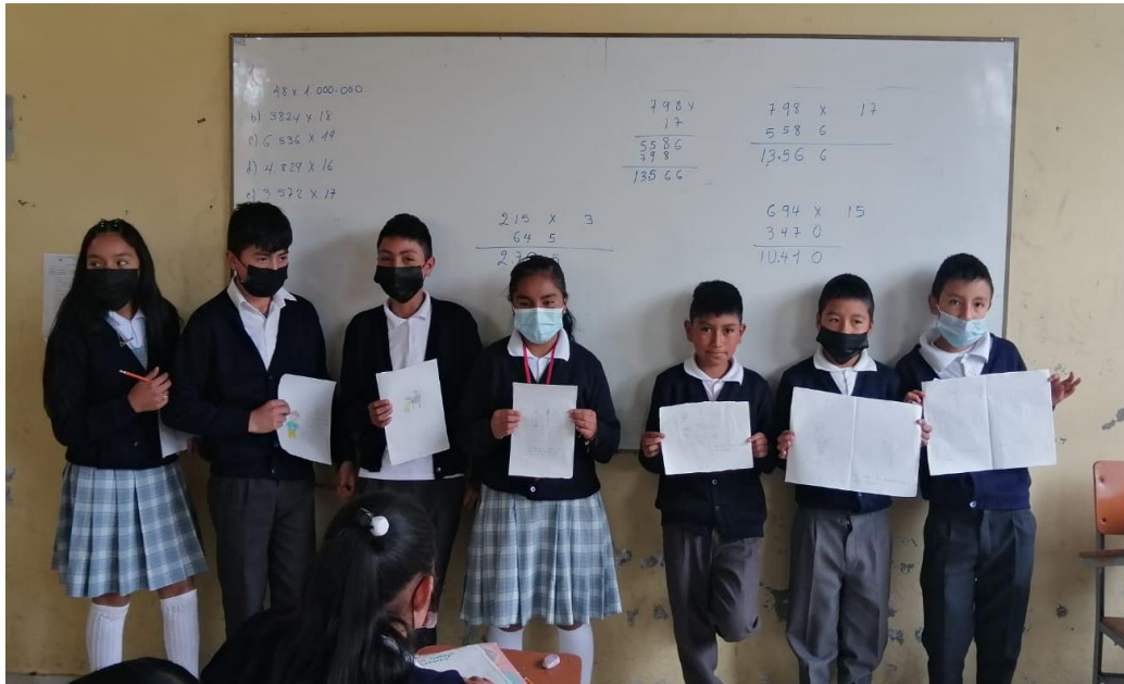
Encuentro con estudiantes Institución Educativa