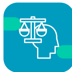
Discusión sobre la justicia