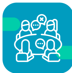
Taller de comprensión del mundo social