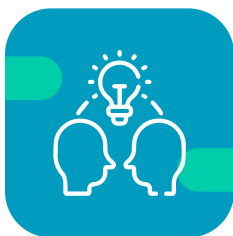
Diccionario de ideas comunes

Haz clic en cada estrategia para ampliar la información!