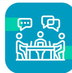
Taller de oportunidades para la educación superior