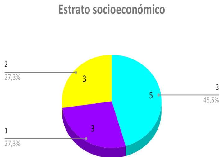
Gráfico 3. Estrato socioeconómico. Matriz de ficha de caracterización

Estrato socioeconómico. Matriz ficha de caracterización