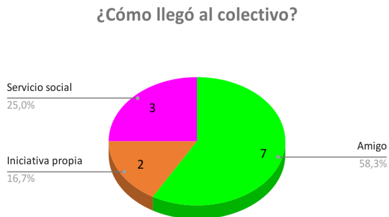
Gráfico 5. ¿Cómo llegó al colectivo?. Matriz de ficha de caracterización

¿Cómo llegó al colectivo? Matriz ficha de caracterización