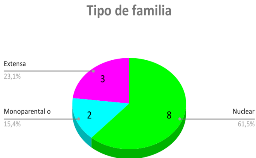
Gráfico 2. Tipo de familia. Matriz de ficha de caracterización

Tipo de familia. Matriz ficha de caracterización