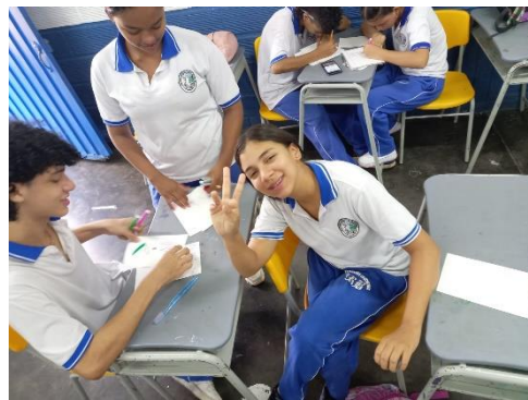
Actividad 2: Si te vieras desde mis ojos