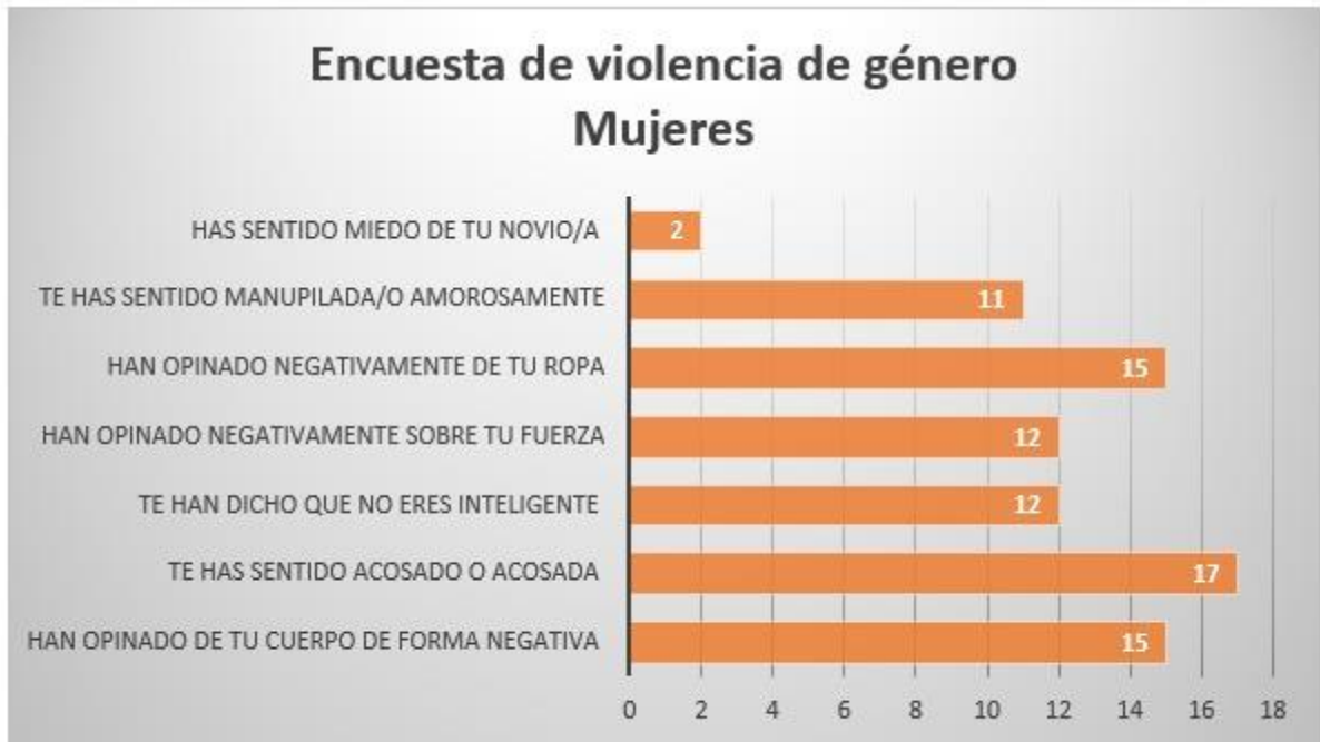
Figura 2 Encuesta