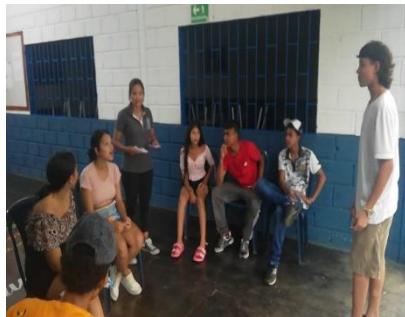
Actividad 1: Diversidad-es