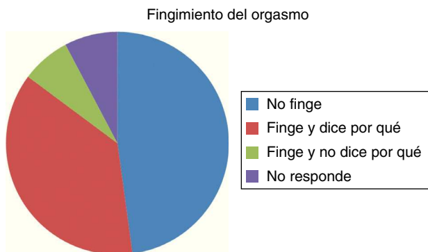
Figura 4 Opciones de respuesta al fingimiento del orgasmo.