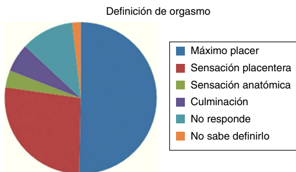
Figura 1 Categorías sobre la definición de orgasmo.