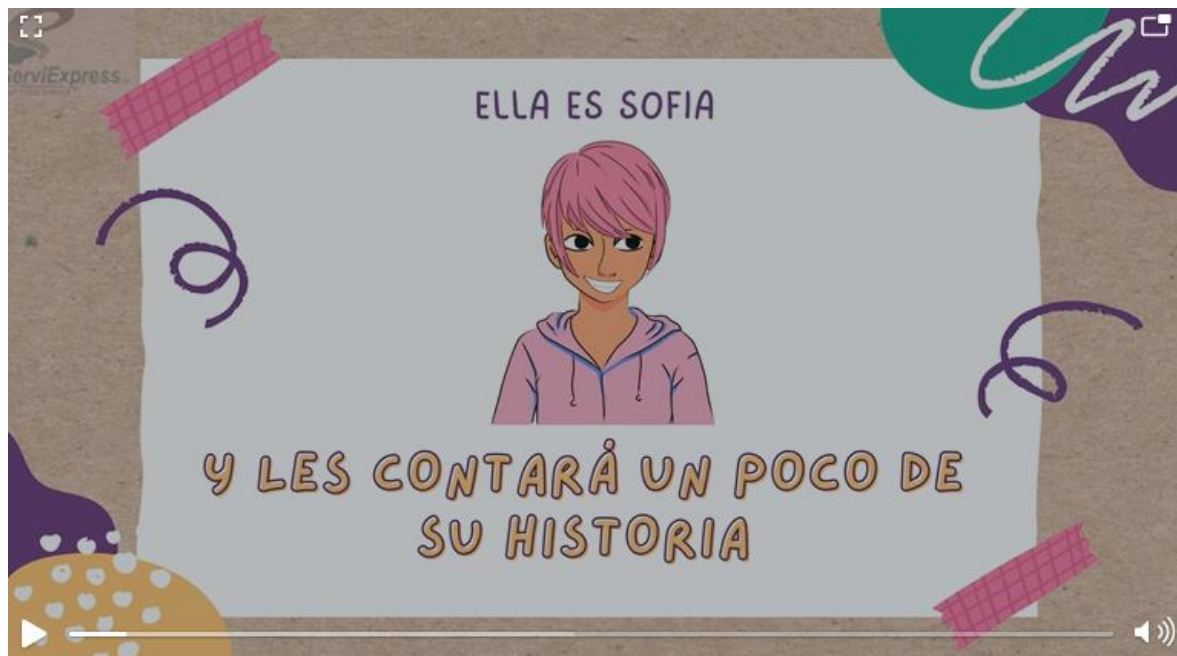
Imagen del video realizado en el marco del proyecto

Además, se brindaron charlas sobre VBG, dónde se les informó sobre los distintos tipos de violencia, como identificarlas, la importancia de autoestima, tips de autoestima, entre otras temáticas que fueron bien acogidas por los y las trabajadoras.