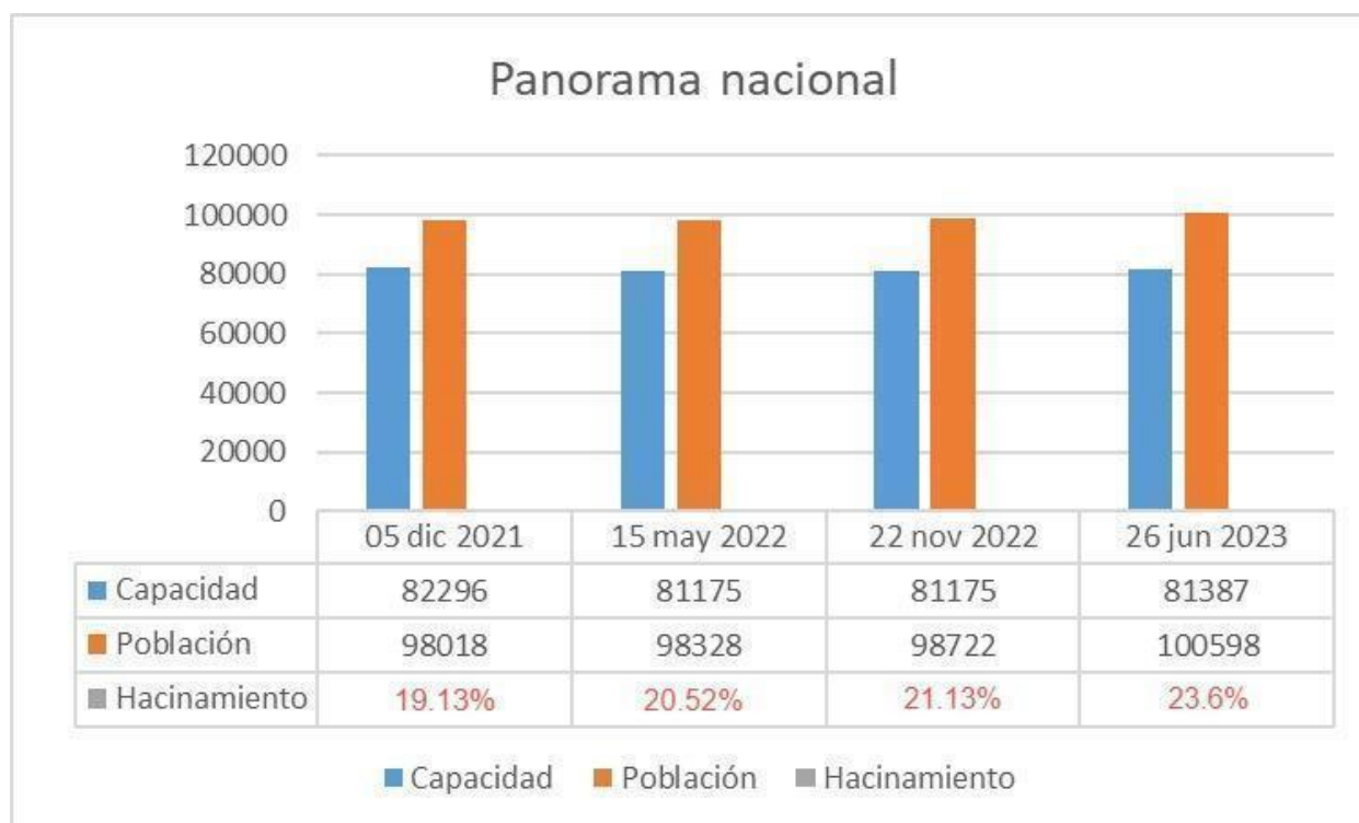
Tabla 1. Población intramural INPEC- panorama nacional

Los datos consignados en las tablas que se expondrán a continuación fueron tomados con una diferencia de tiempo de aproximadamente 5, 6 y 7 meses respectivamente, en ellos se aprecia la capacidad de ocupación para detención intramural y la población reclusa en las diferentes fechas; la relación de ambos datos demuestra que en todas las tomas estadísticas la población excede la capacidad, asunto que da lugar al porcentaje de hacinamiento 2 .