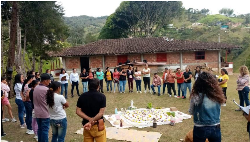
Encuentro interveredal e intergrupala de mujeres