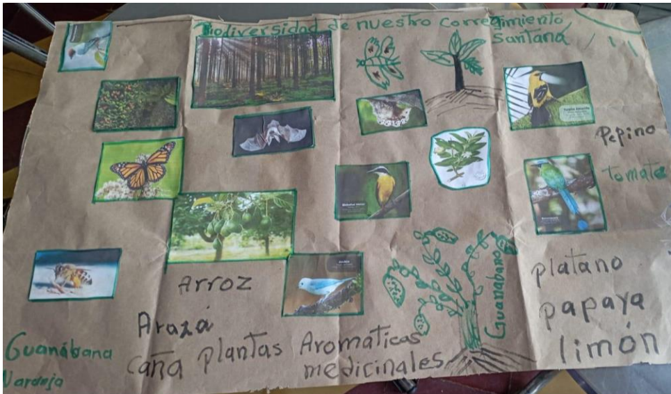
Ilustración de la biodiversidad de la vereda Santa Ana. Encuentro de mujeres durante febrero del 2024.