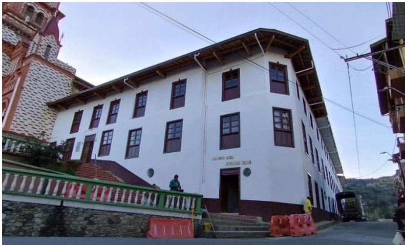
Figura 5. Casa de la Cultura del Municipio de Granada