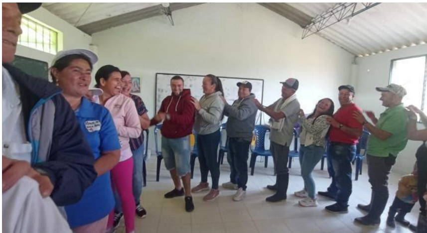
Diagnóstico rápido participativo en la vereda La Milagrosa