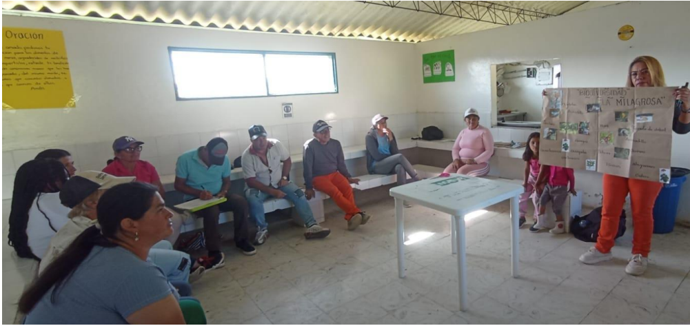
Figura 37. Ilustración de la biodiversidad de la vereda Quebradona Arriba. Encuentro de mujeres durante febrero del 2024

Encuentro comunitario en la Milagrosa sobre biodiversidad durante febrero del 2024