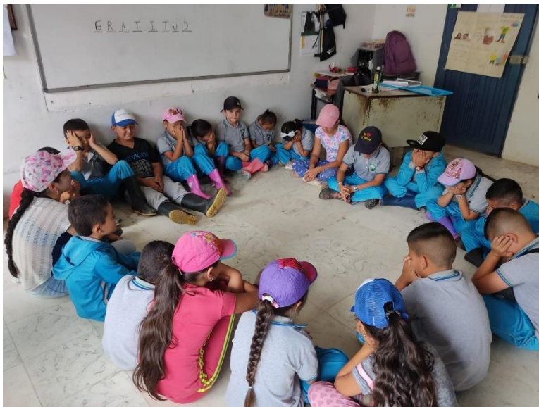
Figura 6. Encuentro Escuela La Cascada, tomada el 15 de mayo de 2023

El proceso de intervención con los niños y las niñas en el territorio se ha llevado a cabo en diferentes veredas como lo son Las Faldas, Quebradona Arriba, Los Medios, El Edén y La Cascada, en instituciones educativas y en el casco urbano. En este proceso se han abordado temas como el fortalecimiento del trabajo en equipo, la convivencia, la memoria, la construcción de paz, entre otros. Estos temas han sido posible trabajarlos con diferentes estrategias y metodologías utilizadas en los encuentros para que estos sean participativos. Actualmente, la propuesta busca brindar diferentes herramientas para la gestión de las emociones, por medio de encuentros formativos participativos donde se trabaja qué son las emociones, cómo se sienten en el cuerpo, cuáles son las emociones básicas y complejas y el reconocimiento de sí mismos. Además, se incluyen las escuelas de padres como parte del proceso.