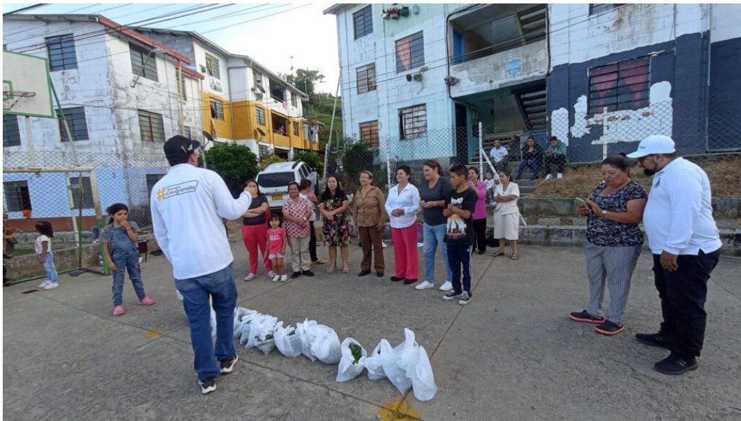
Figura 24. Encuentro en Bello Horizonte.

libre, el cuidado y autocuidado, los sueños y las proyecciones familiares, la sana resolución de conflictos, los roles de género en la familia, el apoyo mutuo, la escucha y la prevención del maltrato; además se llevó a cabo la campaña “SEAMOS” Sexualidad y Amor Responsable con la cual se sensibilizó a la comunidad y en especial a los niños y niñas del sector en relación a la prevención del abuso sexual infantil.