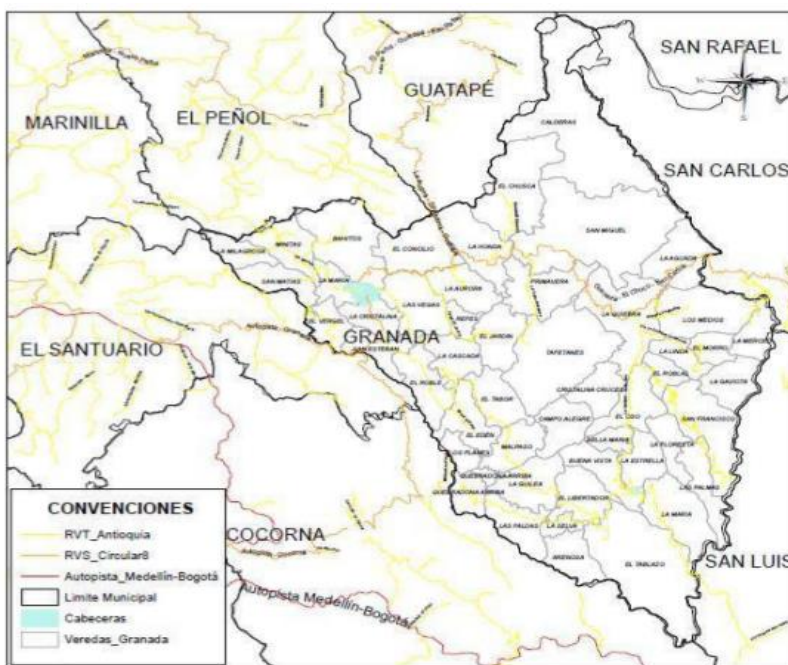
Figura 2. Ubicación geográfica del municipio de Granada

Nota: Imagen tomada del Plan de Desarrollo Municipal 2020-2023 “Unidos por una Granada mejor”